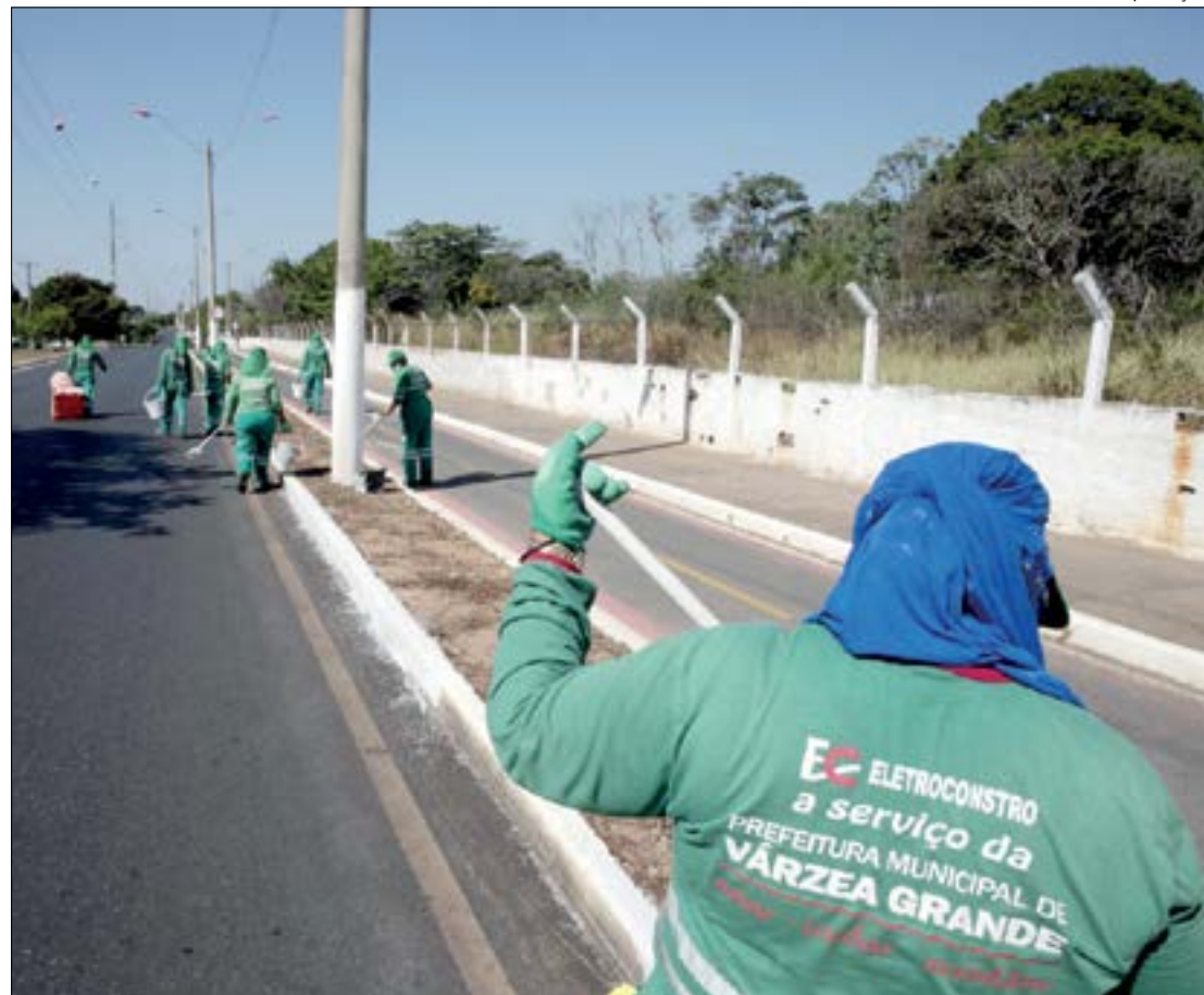
Lutando contra o preconceito, ex-detentos mostram que podem contribuir com a sociedade

"Por isso, entendemos como fundamental que empresas como a Eletroconstro sejam nossas parceiras,