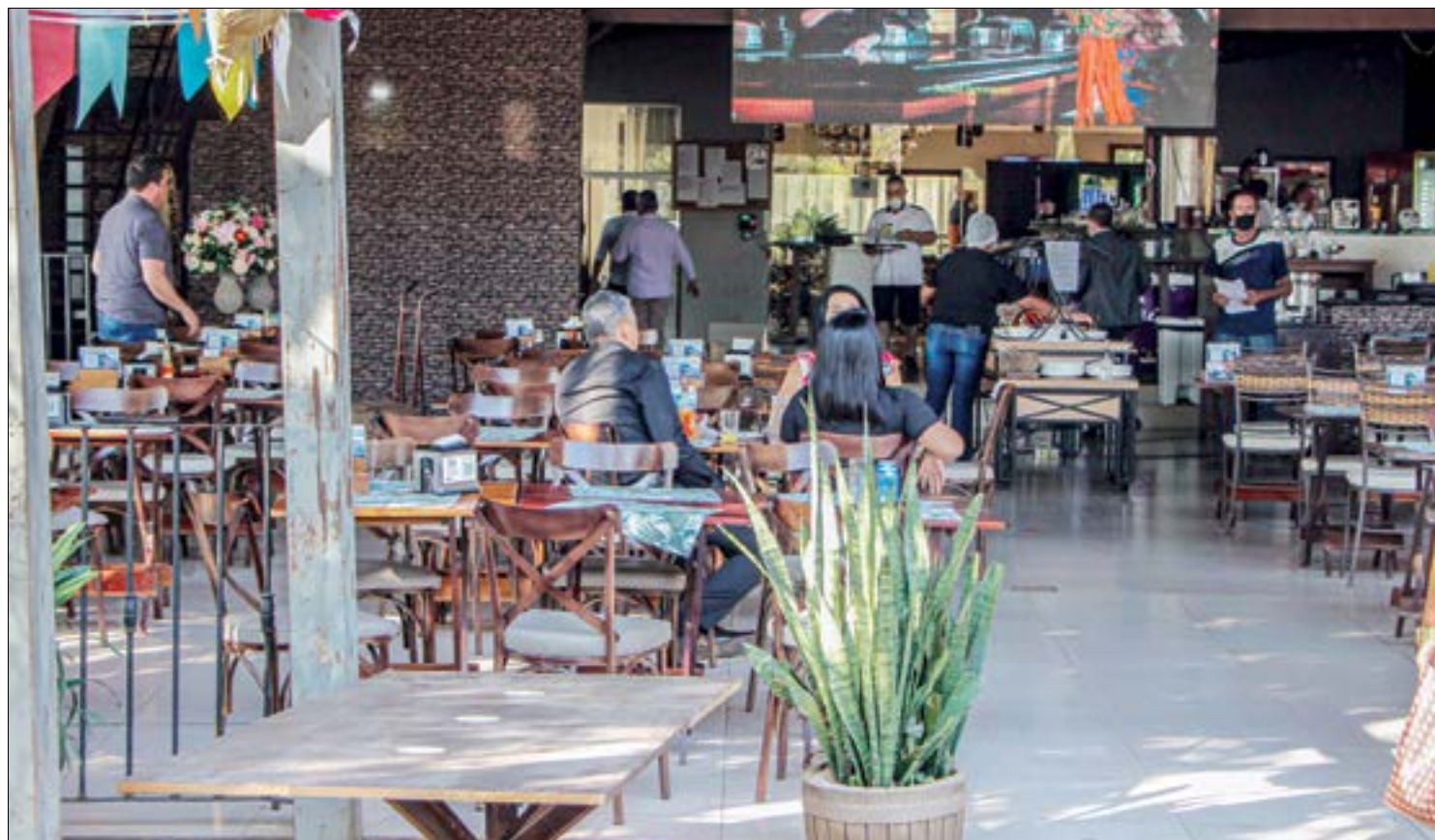
Retomada do setor de serviços melhora expectativas de recuperação da economia para o segundo semestre de 2021