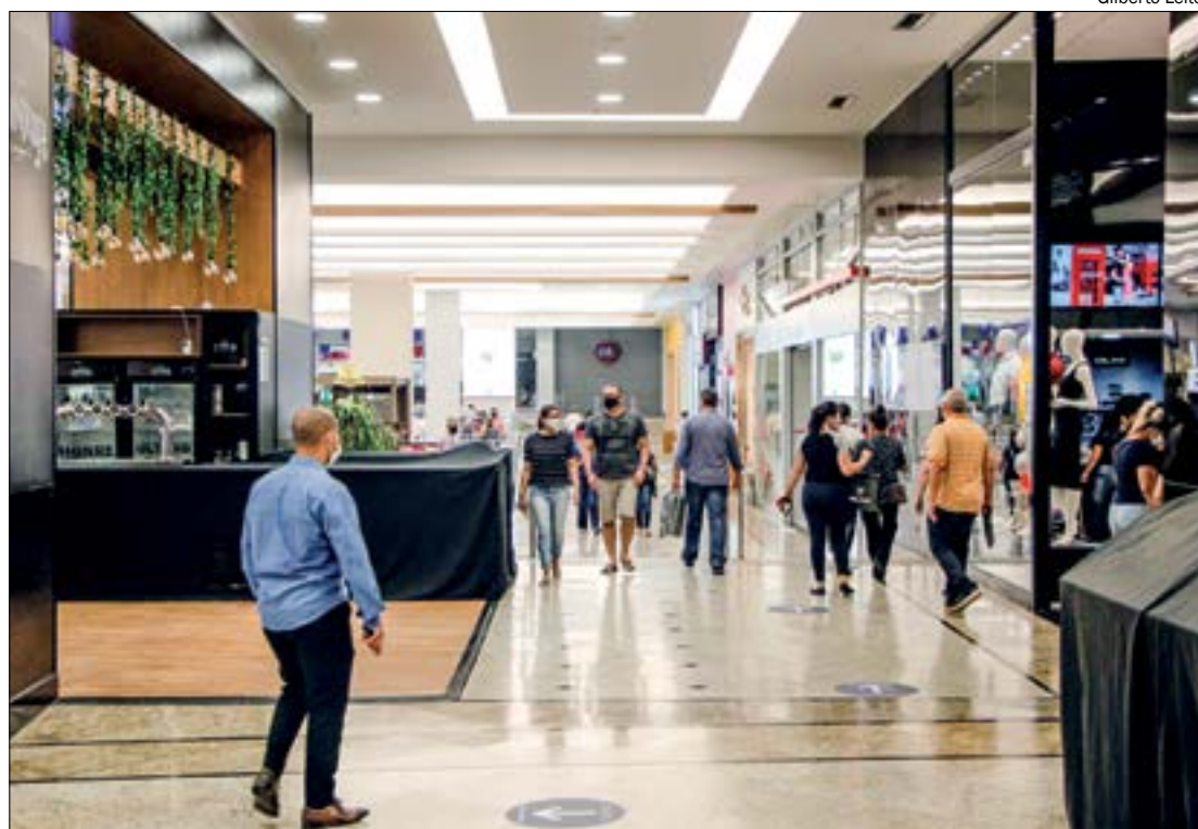
Reajuste e bandeira tarifária aumentam a pressão sobre os custos dos comerciantes, alerta entidade