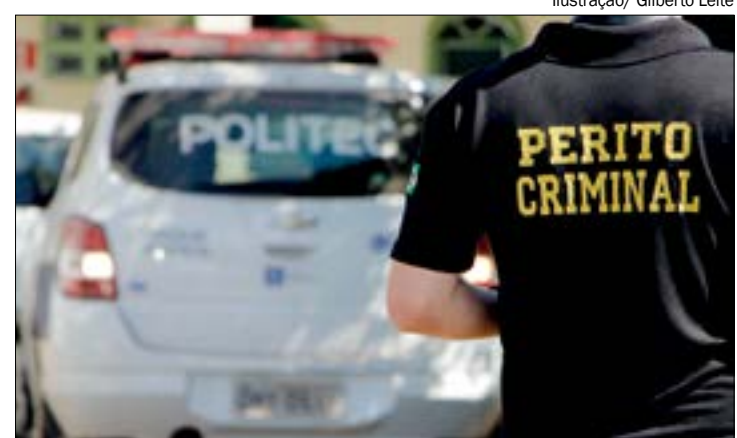
Ilustração/ Gilberto Leite

A Polícia Civil investiga o crime. Até o momento não há informações sobre os criminosos.