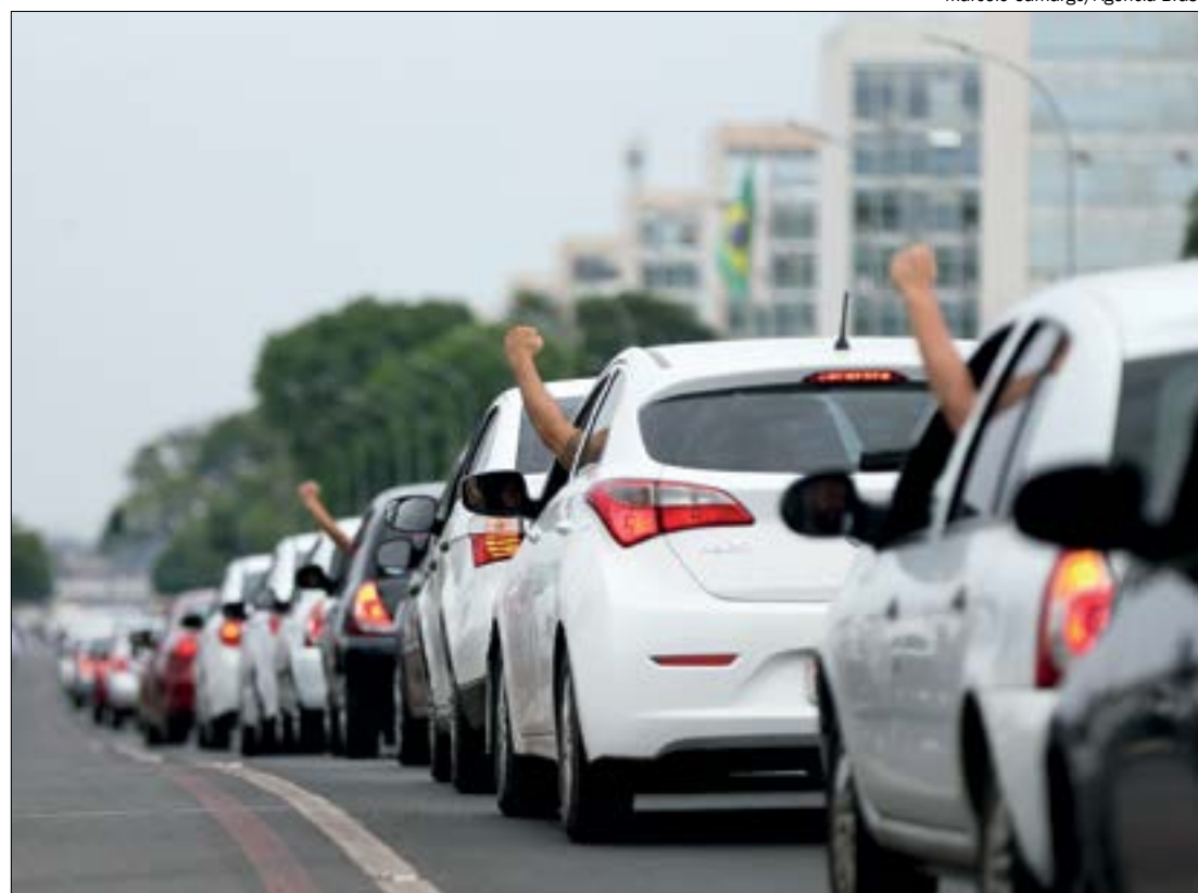
Protesto nacional cobra mais direitos para motoristas e entregadores de aplicativos

A inviabilidade também afeta os usuários desses aplicativos. Nos últimos meses, as corridas ficaram