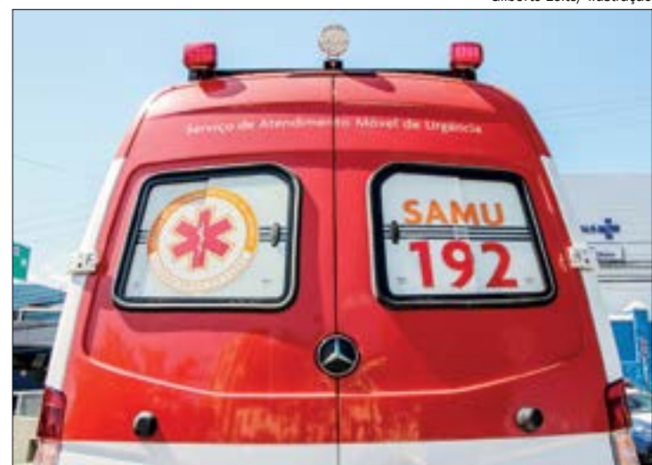
O jovem foi encaminhado ao hospital com ferimentos nas costas e abdômen