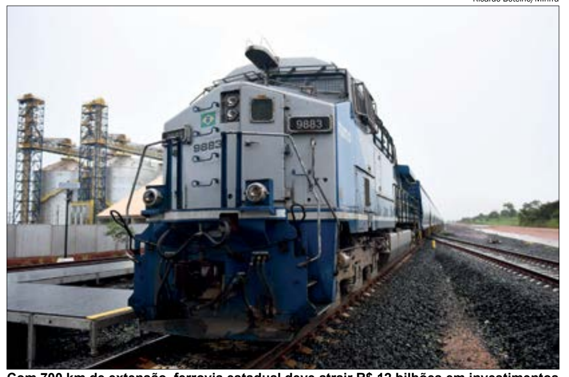
Com 700 km de extensão, ferrovia estadual deve atrair R$ 12 bilhões em investimentos