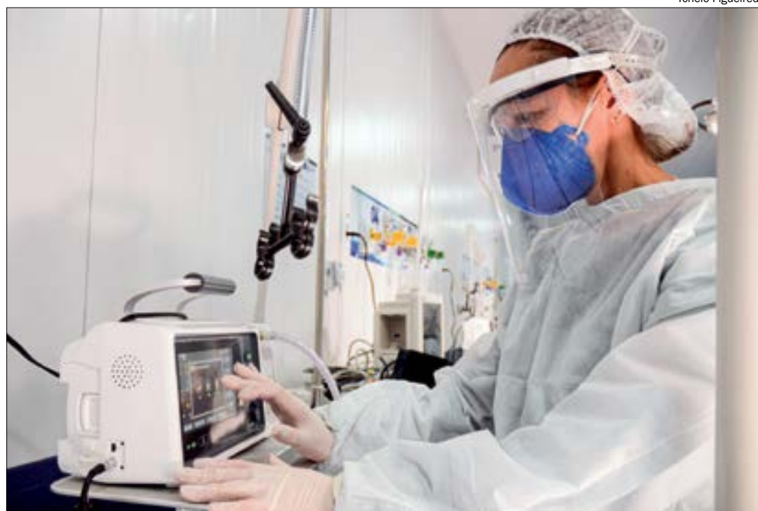
O aumento na taxa de transmissão lançou preocupação na equipe de vigilância epidemiológica da capital