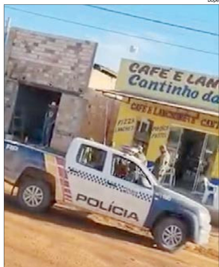
O homem foi flagrado andando pelas ruas da cidade e foi preso pelo BOPE