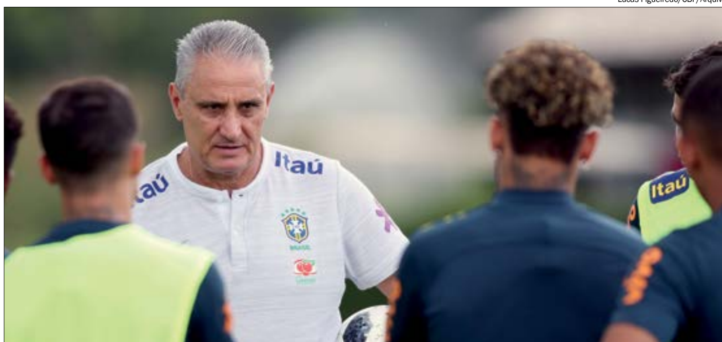
Tite não revelou detalhes sobre a escalação, mas prometeu entregar um 'grande espetáculo' aos torcedores