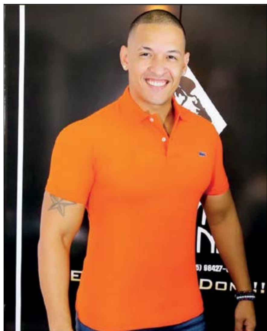
Destaque da semana para o cantor Léo Araújo

O Boticário é o tipo de contatinho que você pode chamar de moção. Afinal, mais de 500 produtos com até 50% de desconto é motivo suficiente para apresentar esse crush até para os pais! Garanta já os seus produtos pelos canais de venda. Promoção não cumulativa e válida até 18 de julho ou enquanto durarem os estoques.