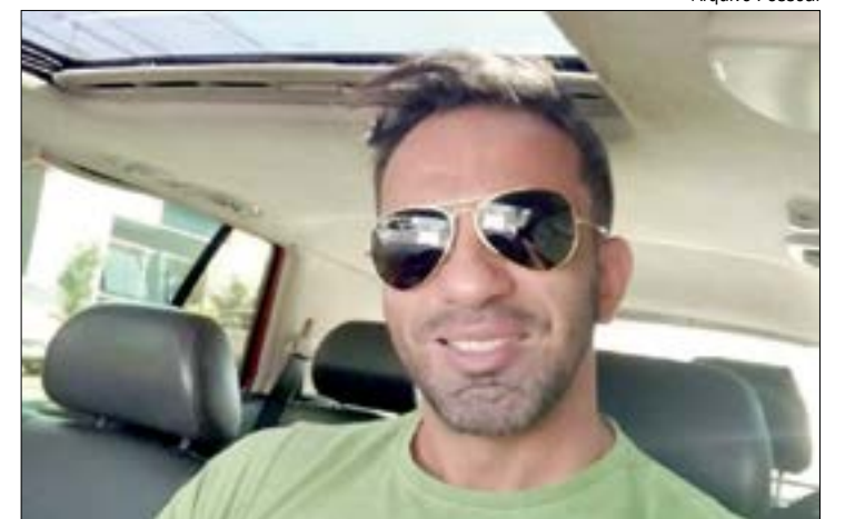
A polícia investiga se José morreu após ter uma reação alérgica ao ingerir comida japonesa