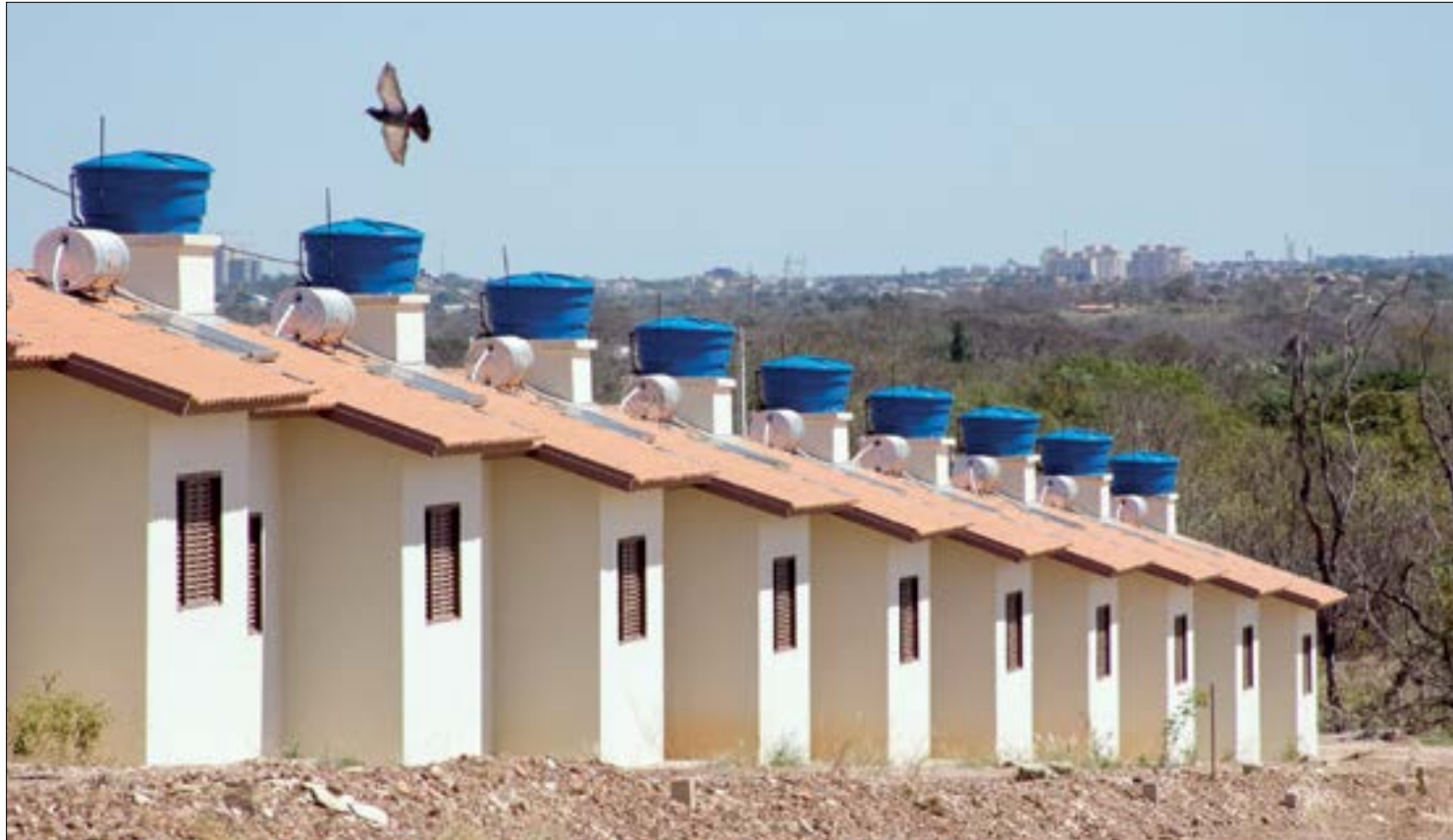
Governo destinará R$ 15 milhões para conclusão de obras habitacionais paradas