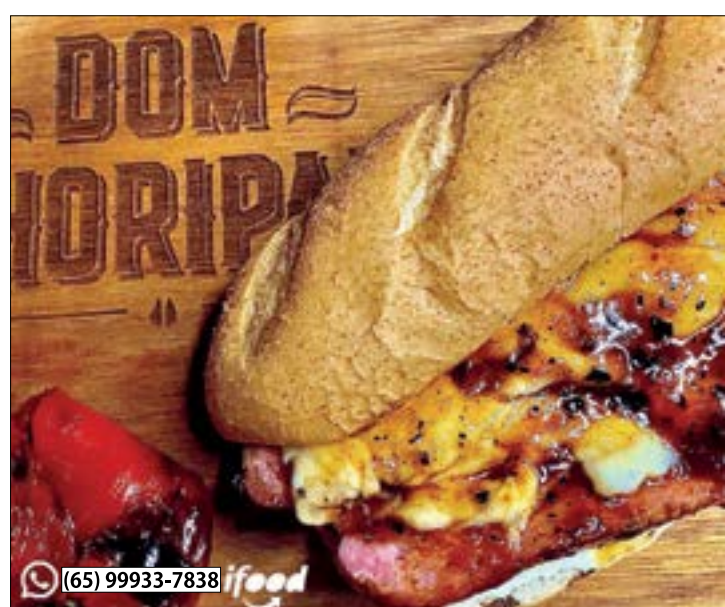
(65) 99933-7838 food

Quando os caminhoneiros forem chamados para vacinar, eles deverão levar documento original com foto, o QR Code impresso, a cópia da carteira de habilitação na categoria E, um documento que comprove o exercício da profissão e estar com a carteira do SUS atualizada.