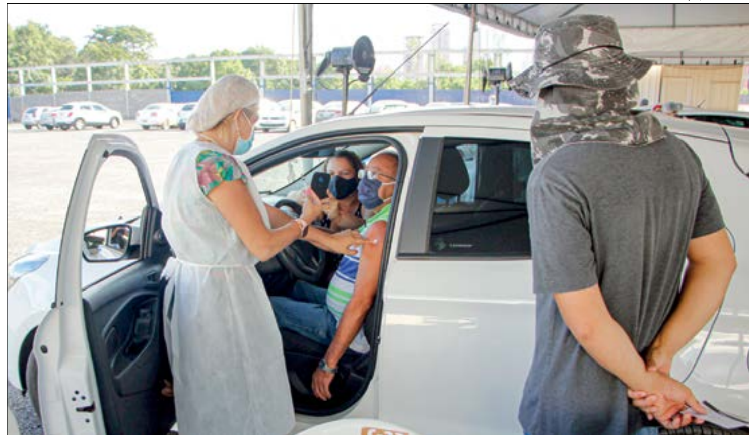
Programação de vacinação do novo grupo prioritário deve ser divulgada na semana que vem