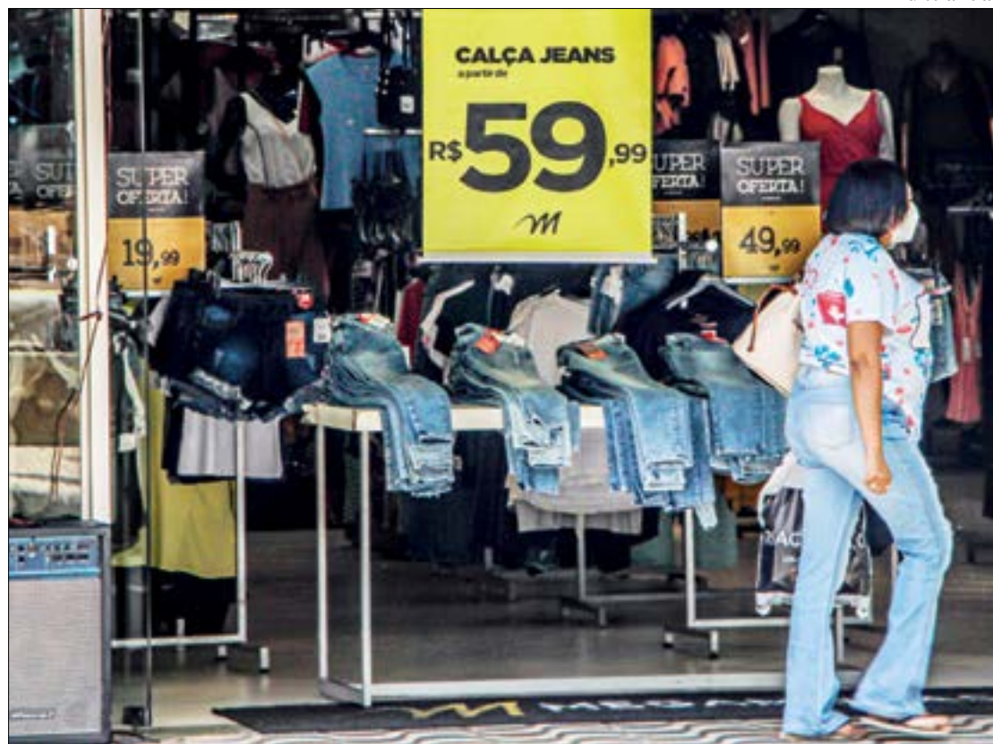
O setor também teve crescimentos de 1,1% na média móvel trimestral