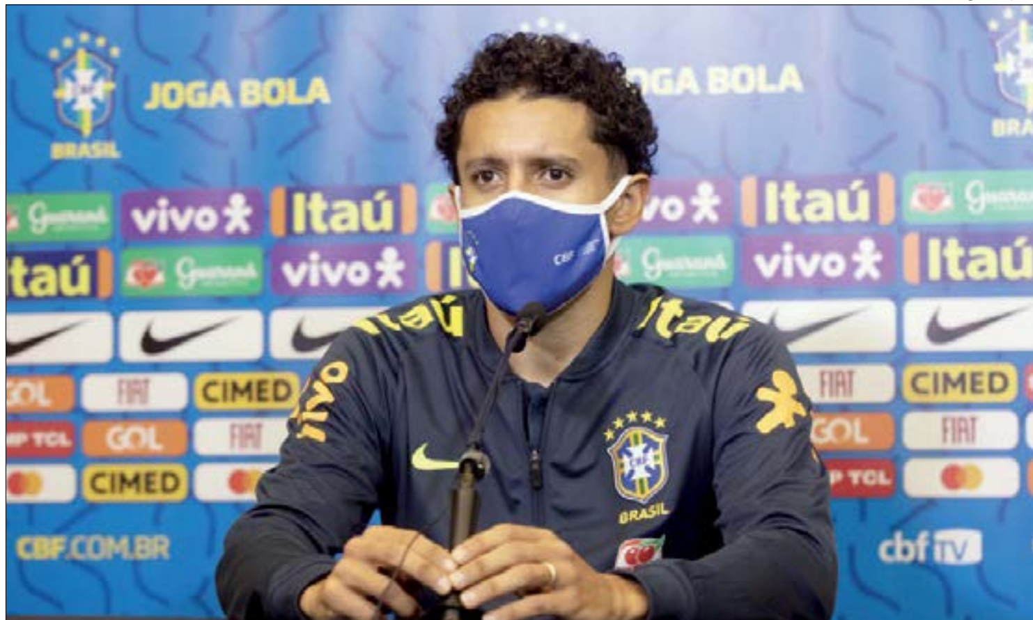
Marquinhos elogiou o desempenho da Argentina e diz que principal objetivo da zaga brasileira é frear Messi