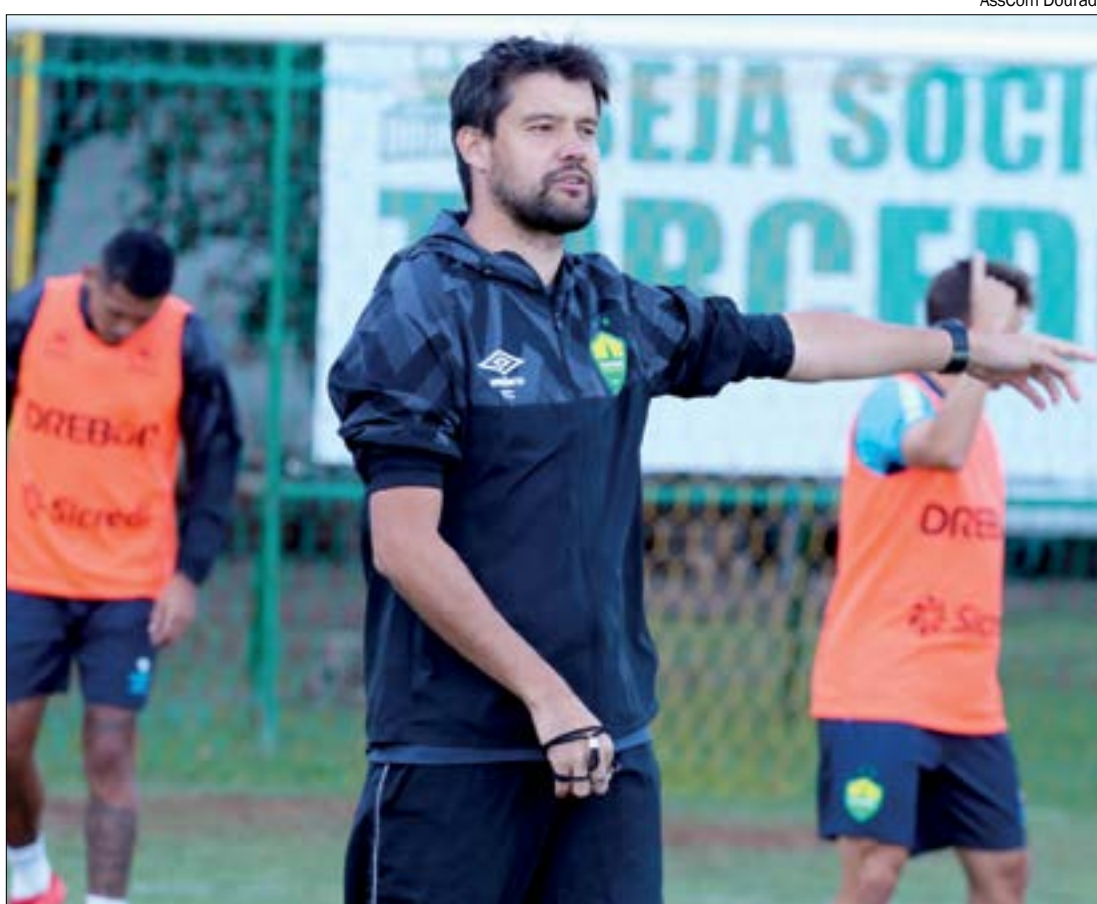
Iubel lamenta chances desperdiçadas e tenta trabalhar fundamentos do ataque para 'desencantar'

“Conseguimos criar, mas estamos passando por um momento em que a bola está teimando em não entrar. Tenho certeza que não tem outra solução, é continuar trabalhando.