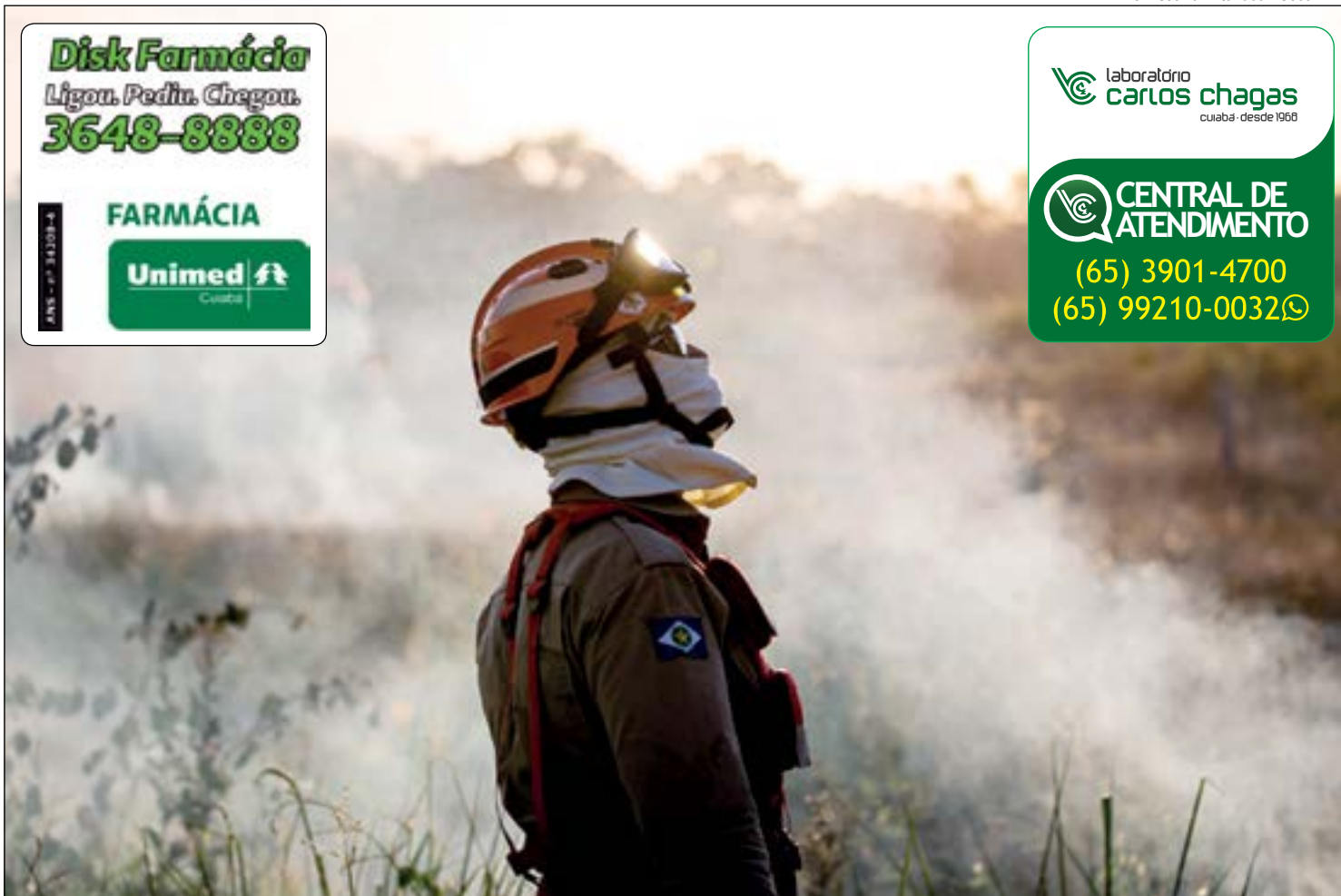
O período proibitivo de incêndios vai até 30 de outubro de 2021

Disk Farmácia Ligou. Pediu. Chegou. 3648-8888