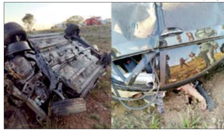
Fernando matou a esposa e o primo após flagrá-los fazendo sexo no sofá de casa