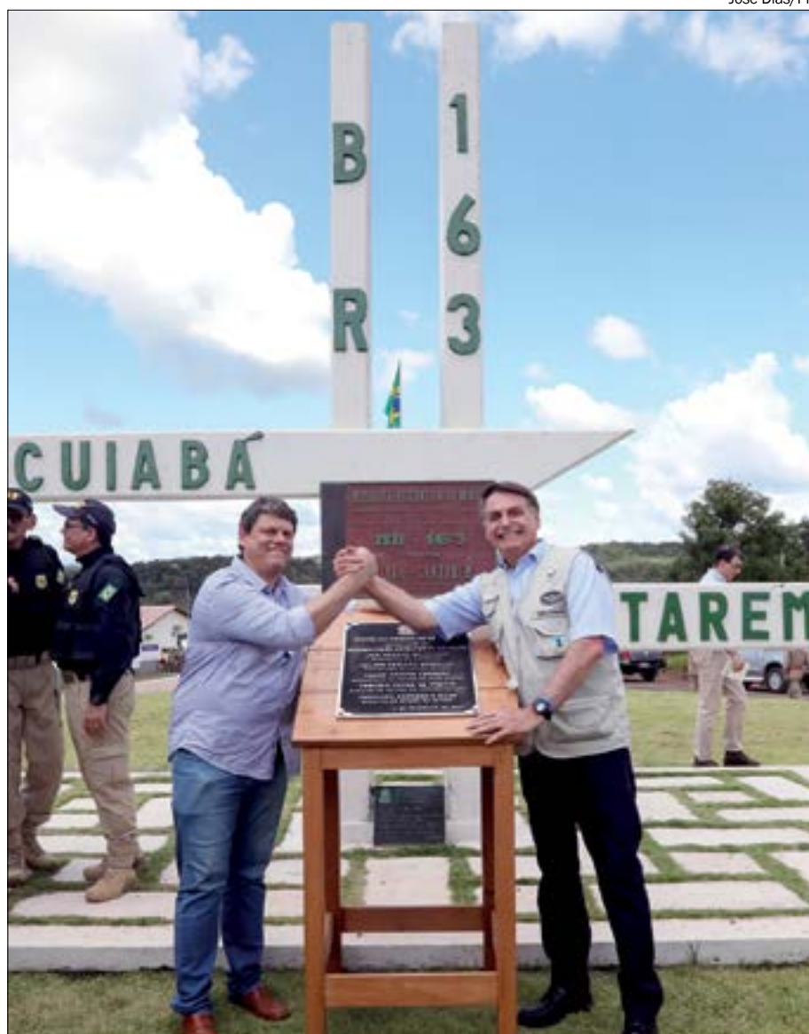
Asfaltamento da BR-163 foi inaugurado pelo presidente Bolsonaro em 2020, com promessa de concessão ainda em 2021

A juíza ainda deu prazo de 48 horas para que seja incluída no edital de concessão