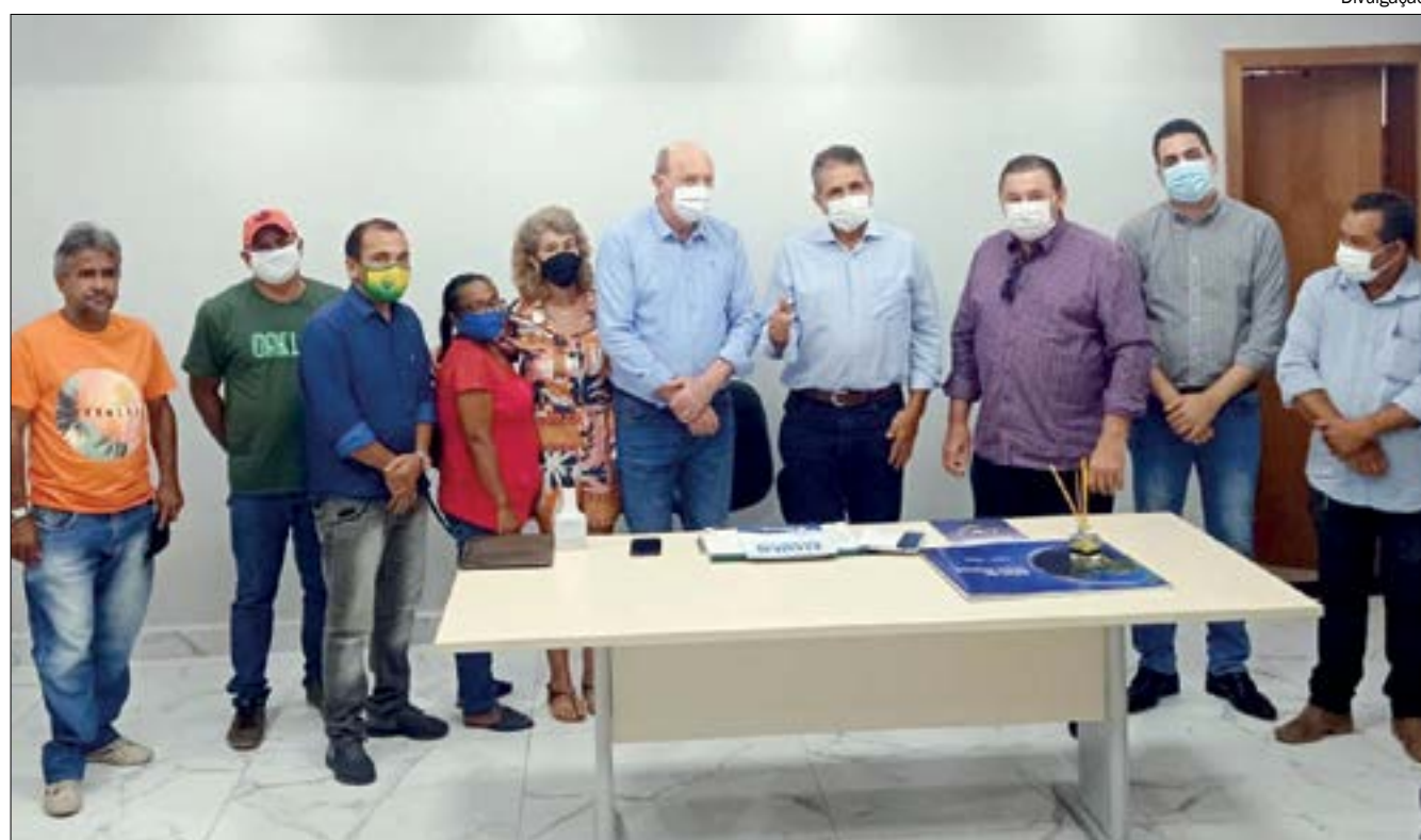
Reunião no Intermat contou com presença dos primeiros moradores do Renascer

recursos financeiros para a contratação de um convênio para a conclusão dos levantamentos”, explicou.