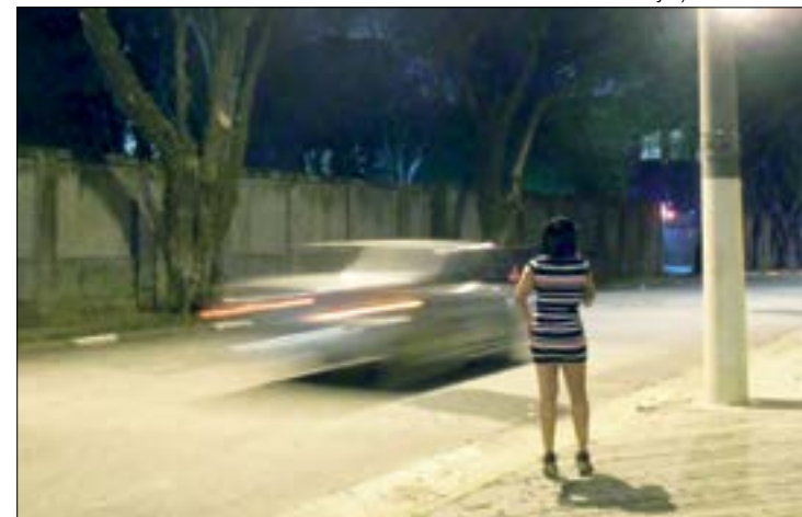
O falso cliente espancou, estuprou e ameaçou a garota de 15 anos no meio da rua