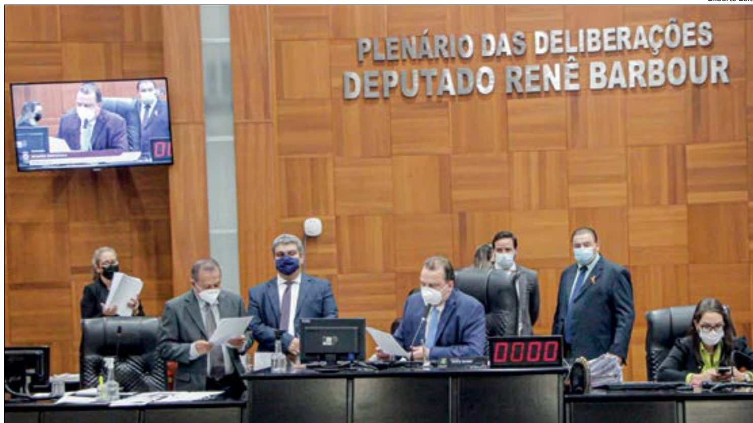
Presidente da AL pode convocar reunião extraordinária se houver avanço nas tratativas com o Conselho da Previdência