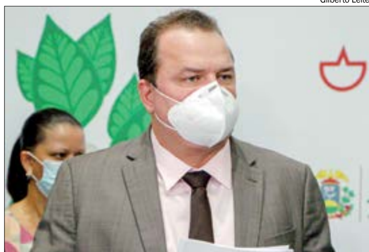
Russi cobra pagamento de pelo menos 50% das emendas até o fim do semestre