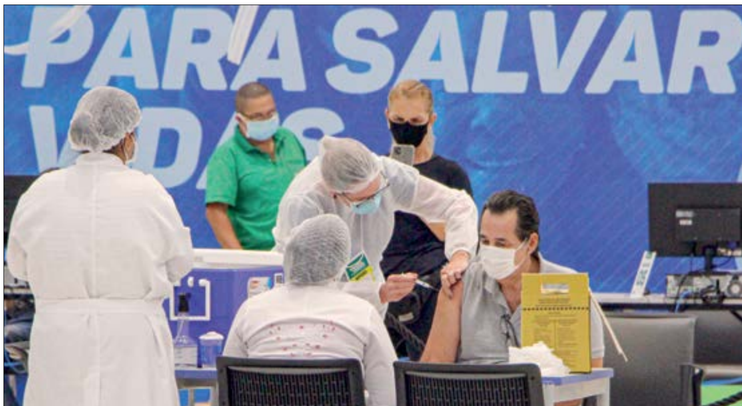
Escassez de vacinas e irregularidades no processo de distribuição são apontados como problemas para ritmo lento