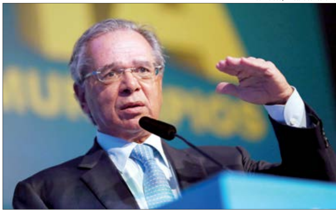
Diferentes setores podem reaproveitar comida e fortalecer programas sociais, afirma Paulo Guedes