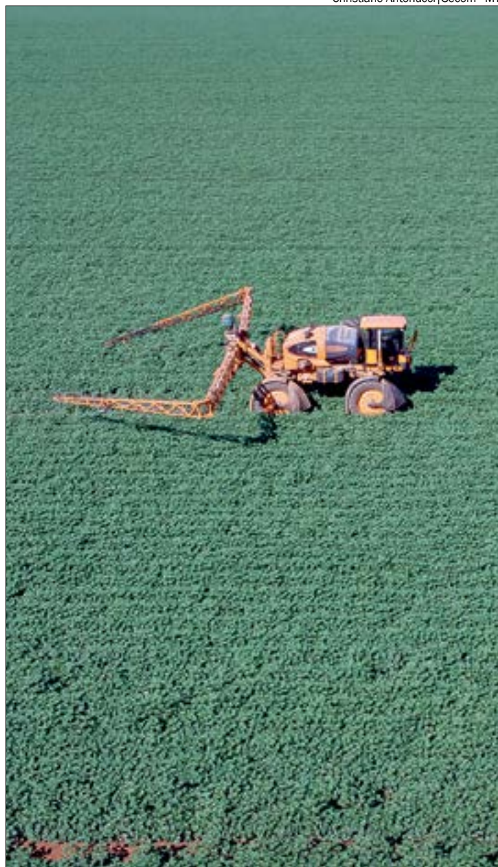
Com a entrada de novas tecnologias, a falta de profissionais qualificados pode se agravar nos próximos anos