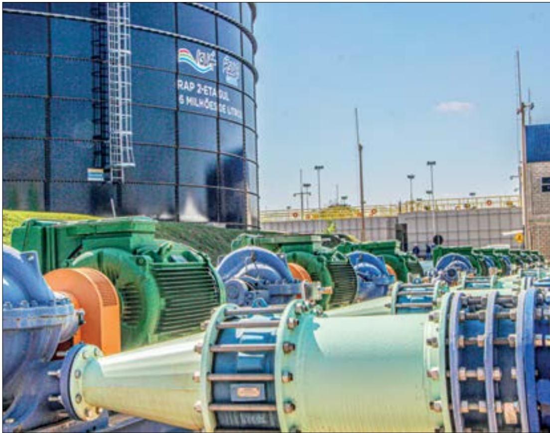
A estação já distribuiu mais de 30 bilhões de litros de água aos 86 bairros sem intermitência