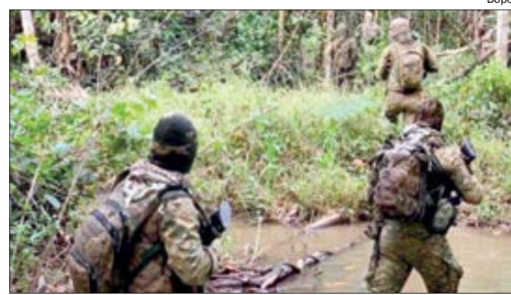
Os policiais realizam buscas atrás do restante da quadrilha envolvida no assalto