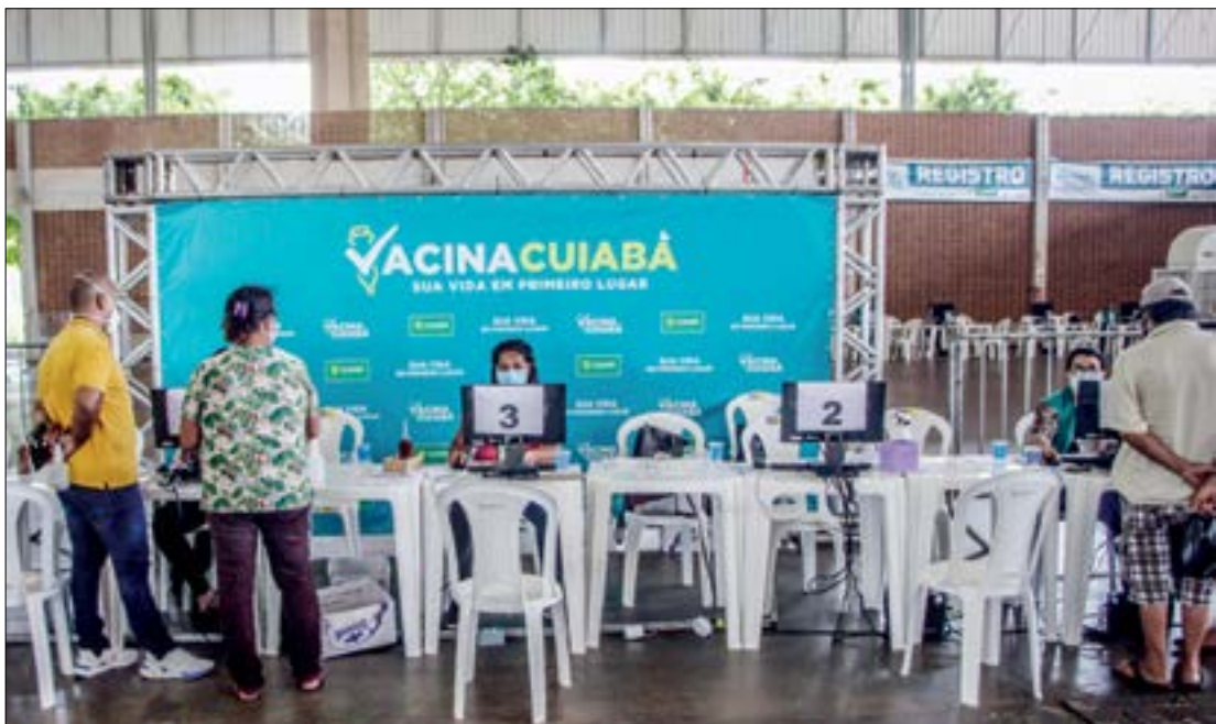
Dos 4.934 pessoas agendadas, somente 1.492 compareceram nos locais de vacinação, totalizando 3.442 faltosos