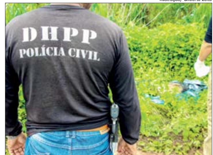
O adolescente é acusado de participar da morte do idoso em fevereiro deste ano