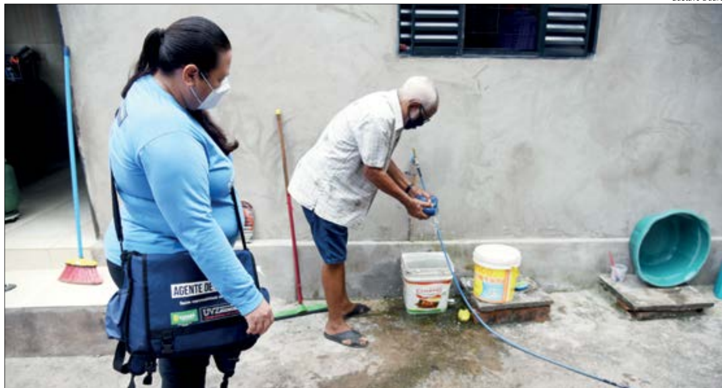
Em Cuiabá, no período de janeiro a 05 de junho, foram confirmados 301 casos de dengue