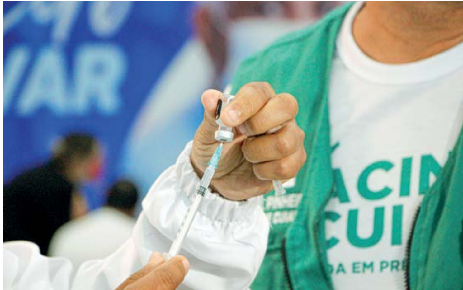
O pedido de mais de 670 mil doses foi formalizado e deve assegurar as duas doses da população acima de 18 anos

As penalidades para os crimes investigados variam de 1 a 8 anos de prisão. Quem armazena material de pornografia infantil pode cumprir pena de 1 a 4 anos de reclusão. Já para quem compartilha, a pena prevista é de 3 a 6 anos. A punição para quem produz esse tipo de material é de 4 a 8 anos de prisão.