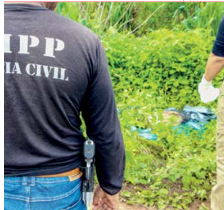
Após constatar que se tratava de um braço, policiais iniciaram buscas pelo corpo