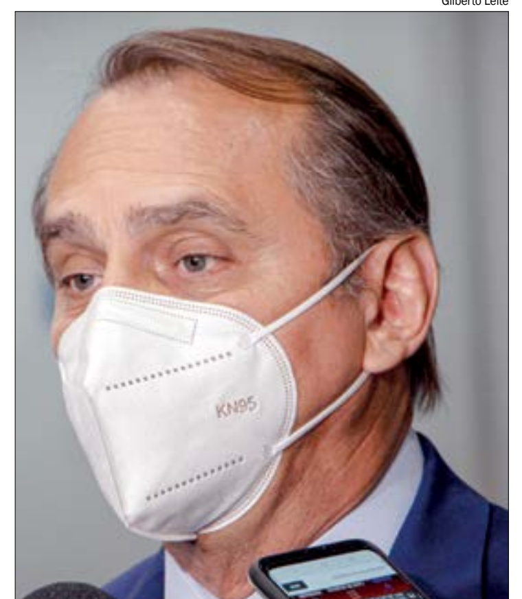
Wilson tenta barrar demissão em massa que pode acabar com a Empaer

Contudo, o direito mencionado pelo sindicalista, na verdade, garante estabilidade a servidores que já estavam em serviço público há pelo menos cinco anos na data da promulgação da Constituição Federal. Os profissionais da Empaer, por sua vez, foram aprovados em processo seletivo cinco anos depois da CF. A reportagem tentou novo contato com o sindicalista, mas não obteve sucesso.