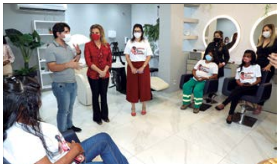
Início dos trabalhos no Salão Guilherme Bravo Beauty e Spá, com as garis