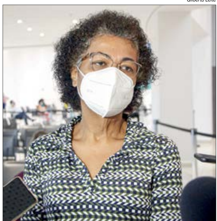
Ozenira revela preocupação com circulação de pessoas para os jogos da Copa América