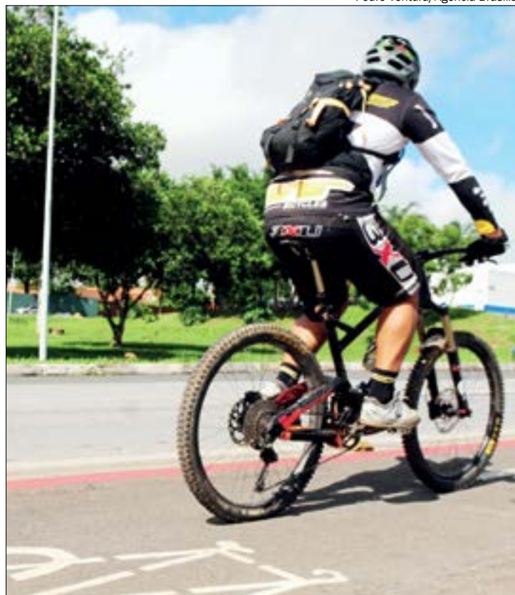
O fato de existir ciclovias, exige que os motoristas reconheçam que os ciclistas também usam as ruas