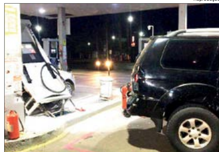
Eduardo morreu após garoto de 18 anos perder o controle de caminhonete em posto de combustível

O caso será investigado pela Polícia Civil.