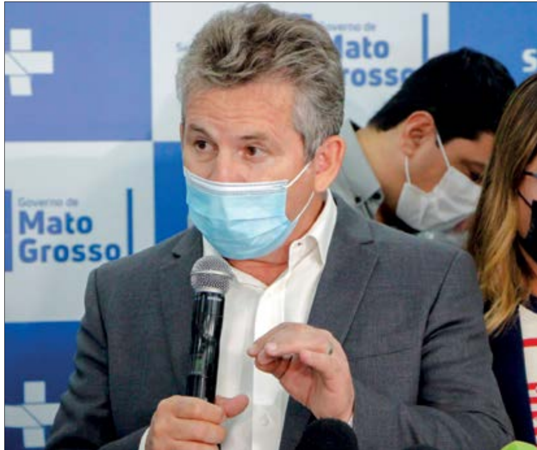
Mauro Mendes assegurou dois contratos para compra da Sputnik V, que totalizam 3,2 milhões de doses

Em negociação desde o ano passado, o governador Mauro Mendes (DEM) assegurou dois contratos para aquisição de doses da Sputnik. Só que isso não deve beneficiar o estado em primeiro momento, já que a Anvisa resolveu limitar