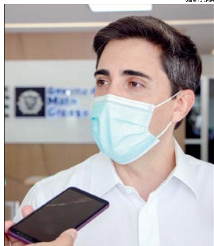
Porto lembrou que municípios já começaram a vacinar professores e prevê conclusão em até dois meses

Alguns municípios já começaram a vacinar seus profissionais. É o caso de Várzea Grande, que tem 7.089 trabalhadores da Educação e já havia ministrado a primeira dose da vacina em mais de 2 mil deles até segunda-feira (31).