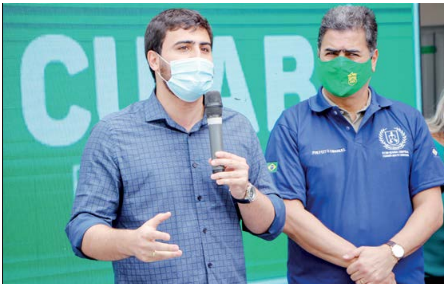
Emanuelzinho quer que governo federal 'compense' a Copa América com mais vacinas para Cuiabá