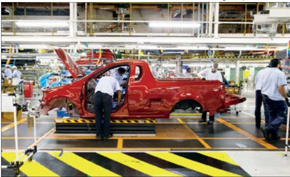
Entre as atividades em destaque, a de veículos automotores está em alta (2,6%)