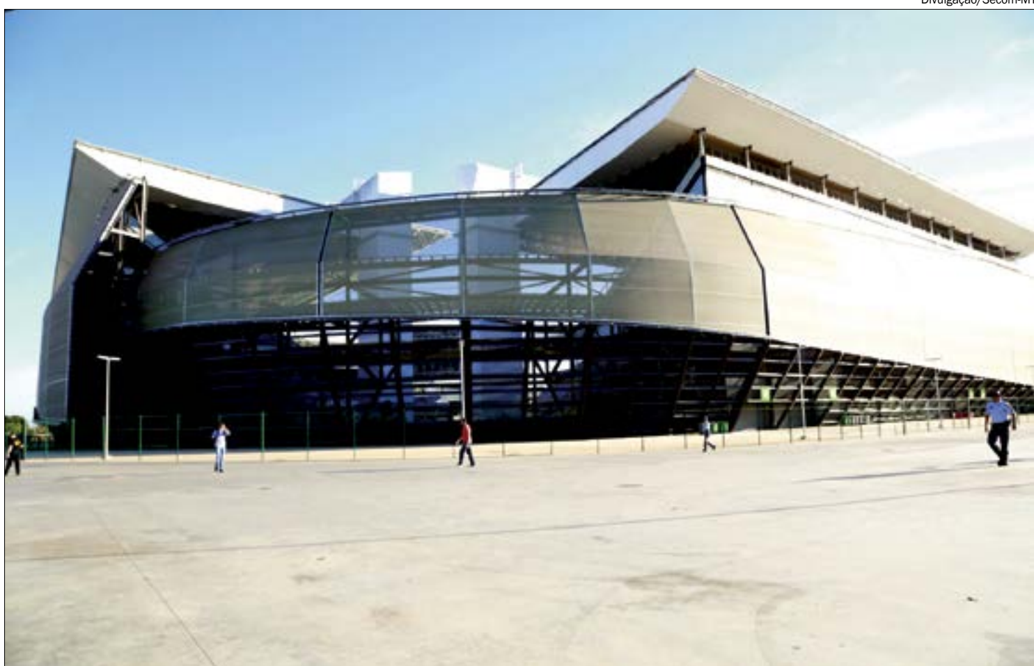
Secretário lembrou que Arena Pantanal está recebendo jogos da Série A normalmente