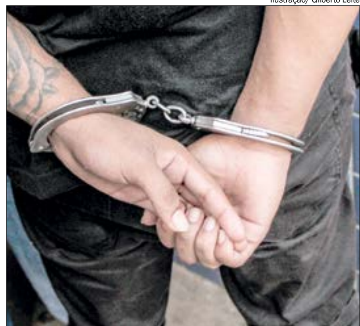
Homem não aceitou recusa e efetuou diversos tiros contra casa da adolescente