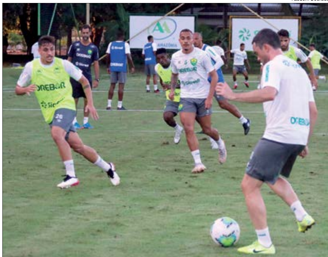
Cuiabá deve trazer novidades na estreia, incorporadas à 'espinha dorsal' do time que conquistou o Estadual