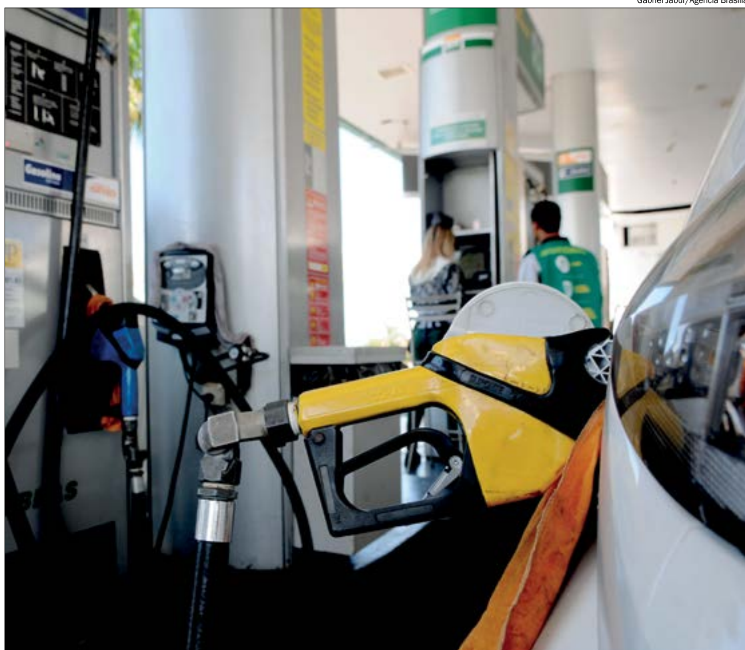
Gabriel Jabur/Agência Brasília