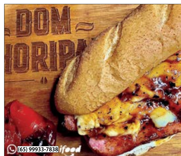
(65) 99933-7838 ifood

O prefeito afirmou que irá definir novas medidas somente após a reunião do Comitê de Enfrentamento à Covid-19 em Cuiabá, que acontecerá na segunda-feira (31).