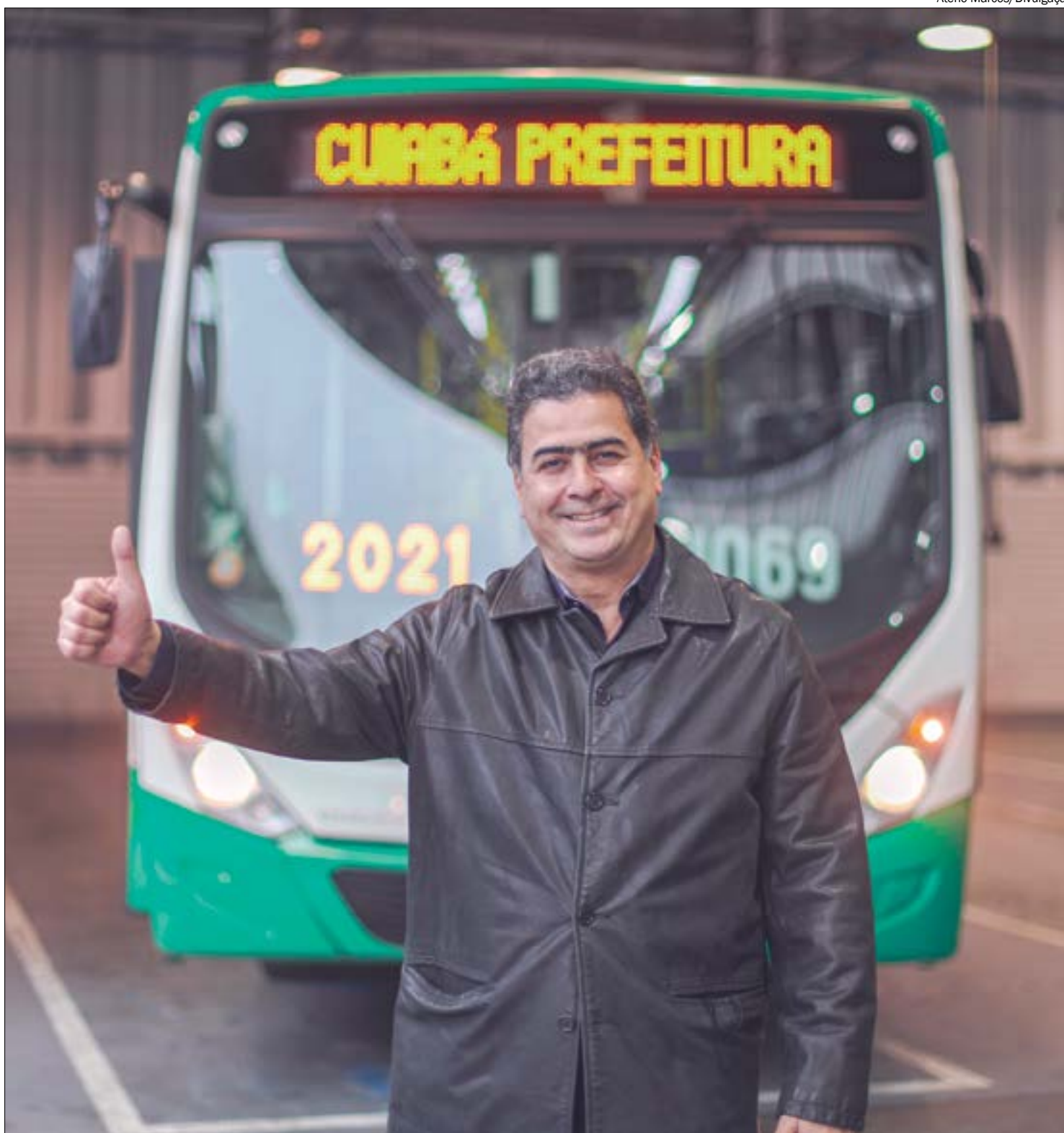
Cuiabá contará com 140 novos ônibus integrados à frota de transporte público para atender 260 mil usuários. 60% terão ar-condicionado

O prefeito realizou uma maratona de visitas aos complexos industriais das fabricantes de carrocerias Marcopolo (na cidade de Caixas do Sul-RS) e Caio Induscar (Botucatu-SP), acompanhado pela primeira-dama. As duas fábricas estão finalizando os processos