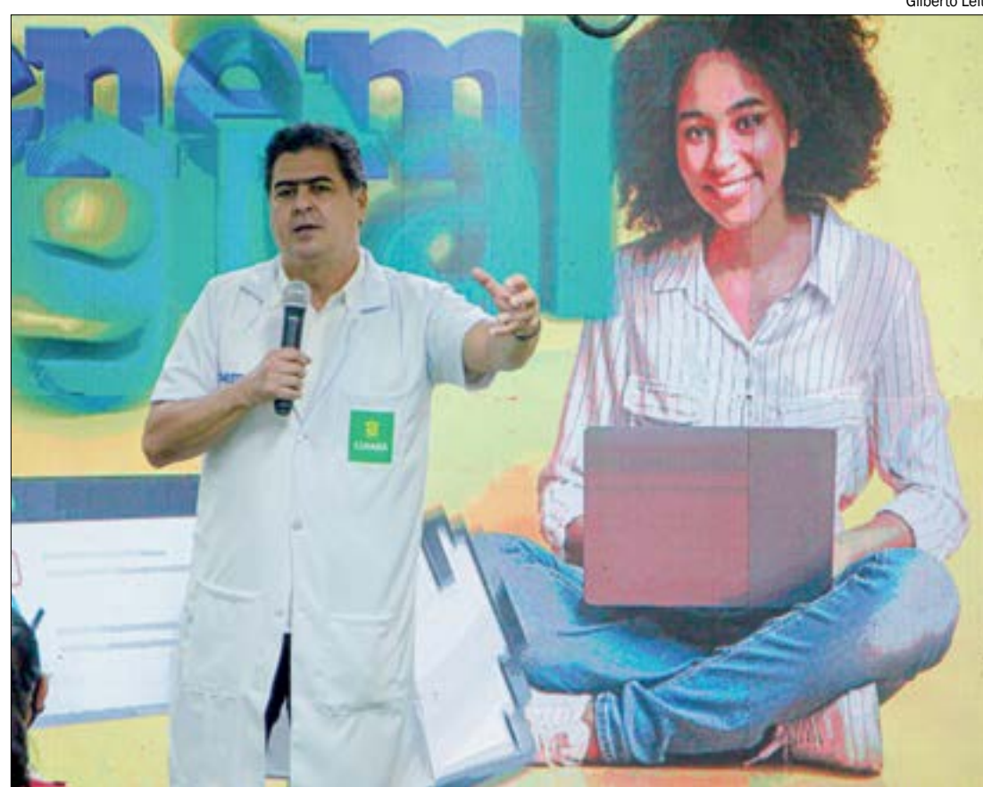
2 mil vagas estão abertas para o Enem Digital 5.0. Alunos que se destacarem terão oportunidade de estágio