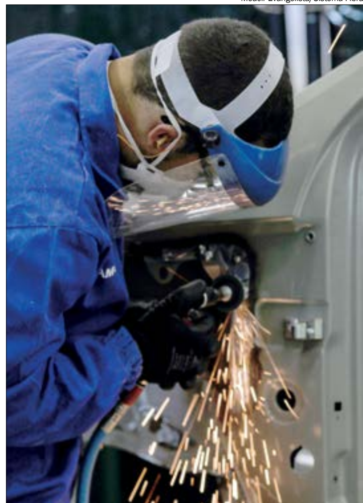
Moacir Evangelista/Sistema Fibra