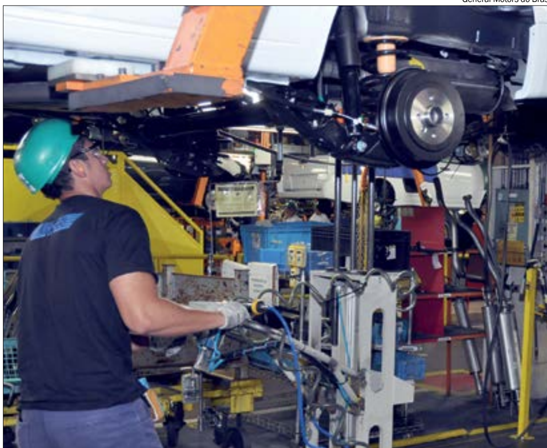
General Motors do Brasil

Além de ter mais conhecimentos para conter o