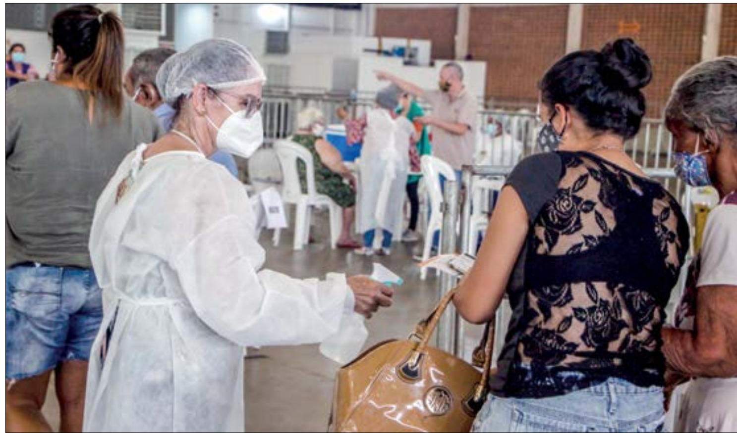
Novas regras de flexibilização possibilitam que paciente escolha qual documento apresentar para comprovar doença