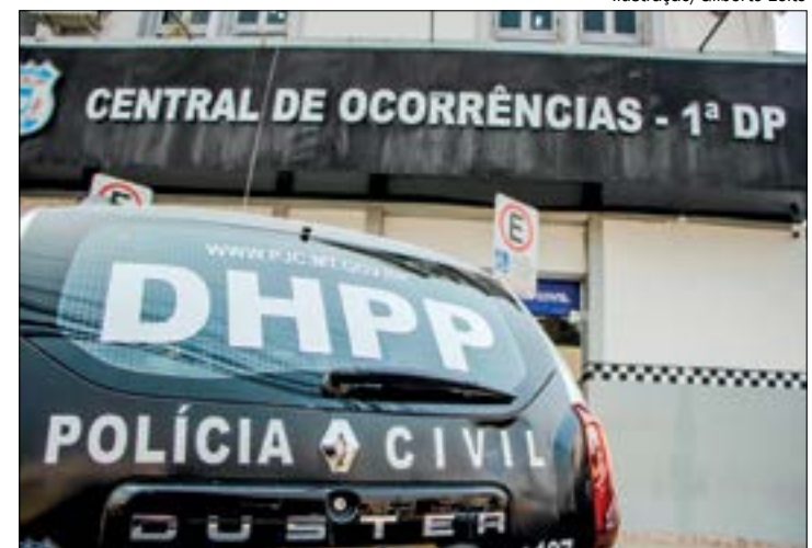
Qualquer informação que ajude a polícia a encontrar os jovens pode ser repassada pelo número (65) 9 9982-7766