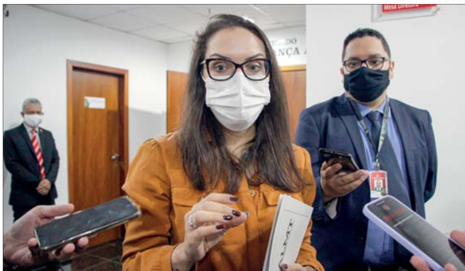
Janaina conta com chamamento de novos servidores para reforçar caixa da Previdência, o que permitiria o aumento da faixa de isenção

"Nós estamos satisfeitos, mas ainda não é o ob-