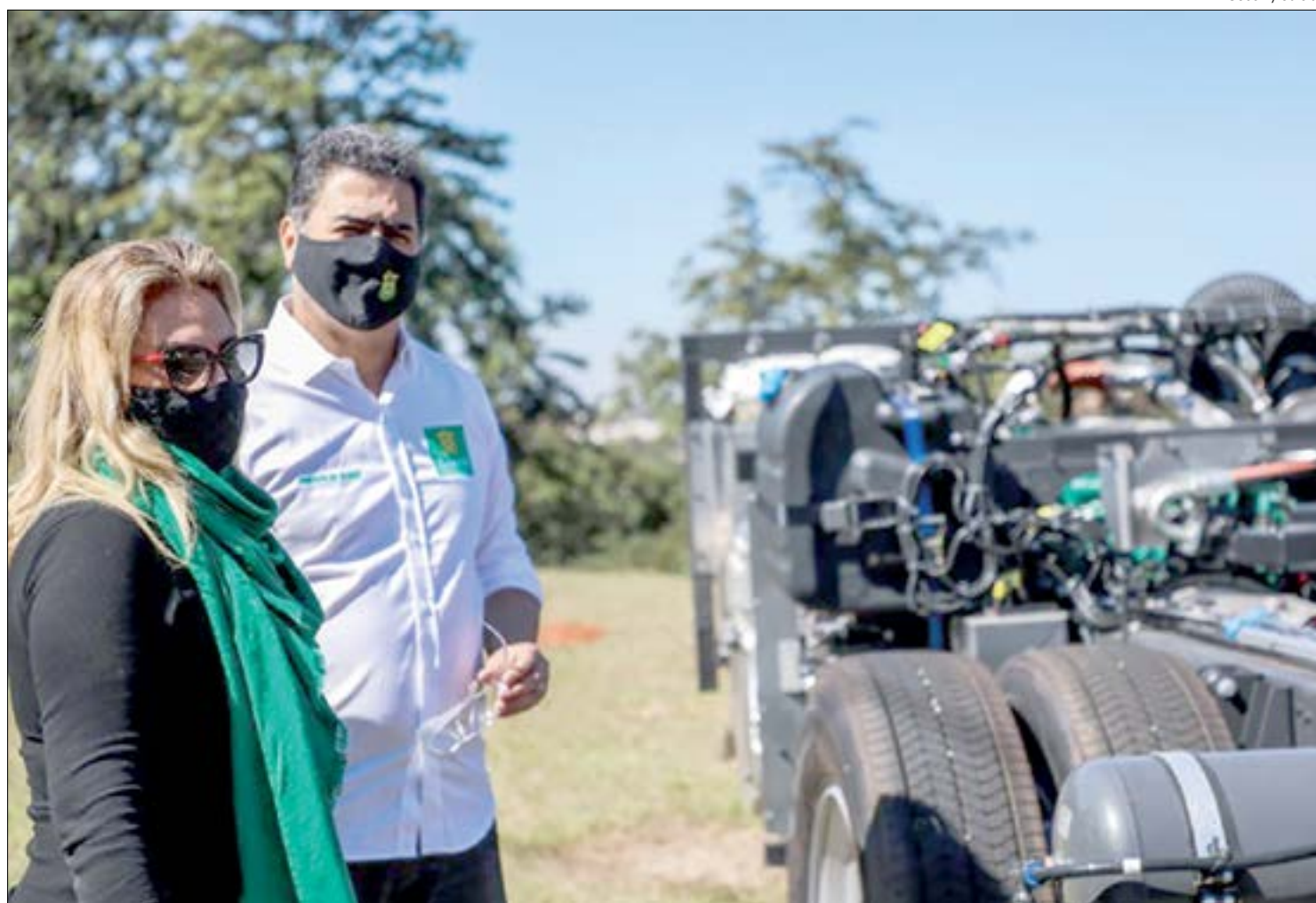
Emanuel e a primeira-dama Márcia Pinheiro vistoriaram os novos coletivos pessoalmente

"Vimos até a fábrica da Caio Induscar, em Botucatu, interior de São Paulo, para verificar a finalização do processo. Em breve a população terá à disposição novos carros, especialmente adaptados para atender cadeirantes, com espaço para cães guias e assentos especiais, para garantir o melhor atendimento