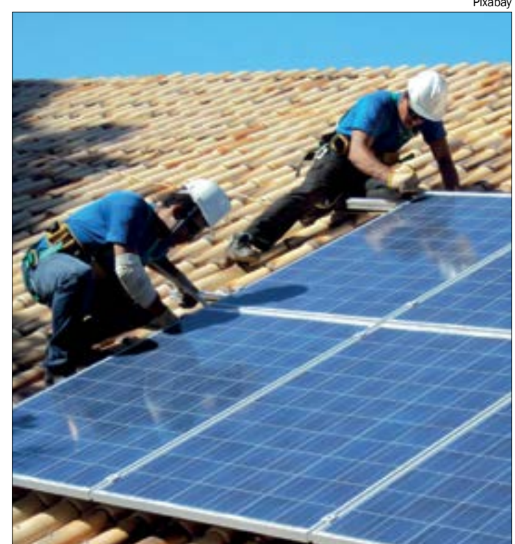
Energisa recorreu contra decisão que proibiu cobrança de ICMS sobre a energia solar

O juiz ainda destacou que o Convênio ICMS nº 16, do Conselho Nacional de Política Fazendária (Confaz), estabelece que os estados estão autorizados a conceder isenção de ICMS sobre as operações previstas na resolução 482/2012 da Aneel. Foi determinada multa diária de R$ 10 mil em caso de descumprimento da ordem judicial por parte do governo do Estado e da Energisa.