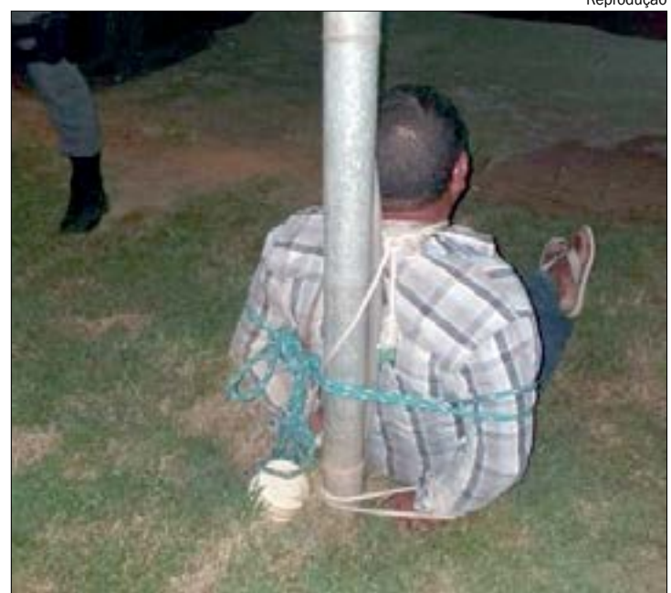
O homem já havia tentado entrar na residência e todos estavam esperando para saber a motivação