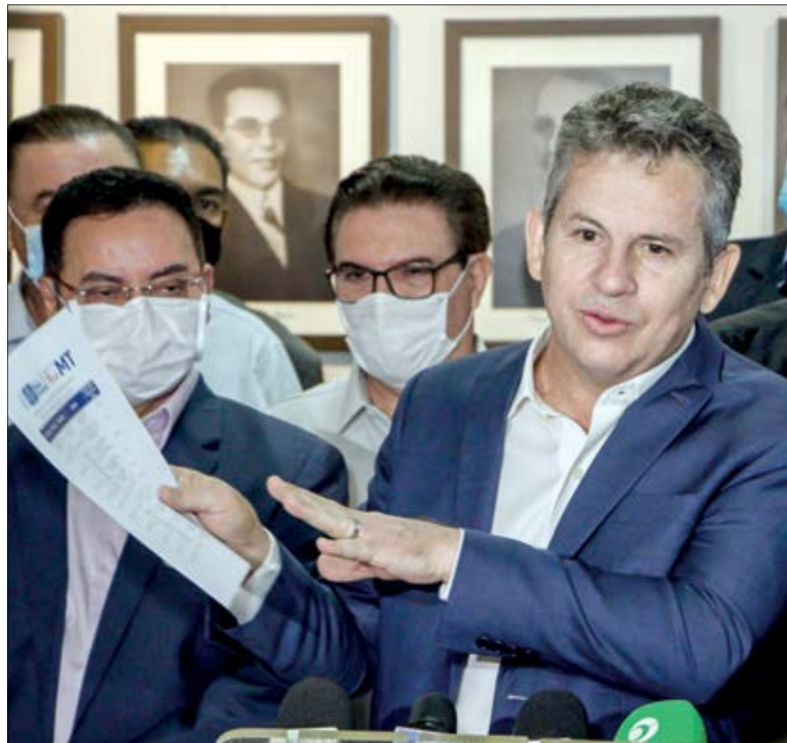
Mauro defende trabalho da CPI da Covid, mas pede que ajam “sem pirotecnia”