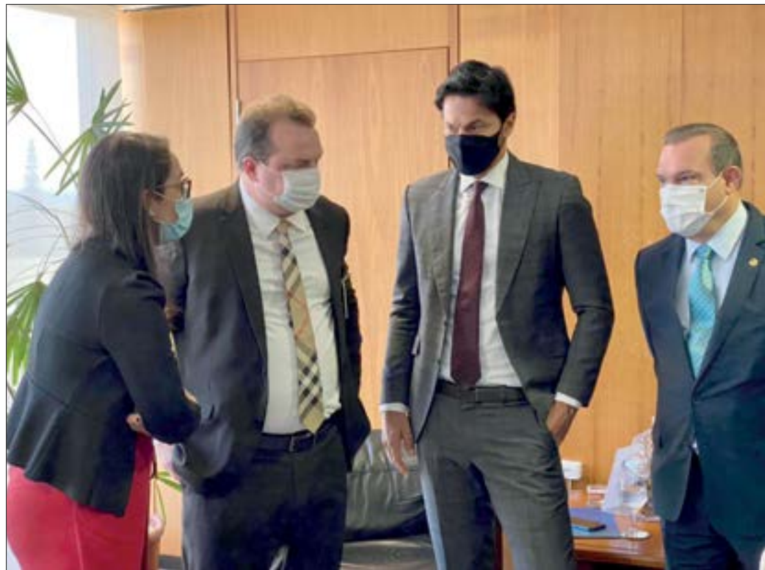
Deputados cobram inclusão de MT na primeira leva de 5G no Brasil

“Estamos juntos nesse projeto, pois é um projeto que traz mais democratização e, principalmente, oportuniza àqueles que estão lá na ponta, mais distantes, o acesso à escola, aprendizado e saúde. Tudo hoje depende de um sinal. O 5G está chegando e essa parceria nós vamos consolidar”, concluiu.