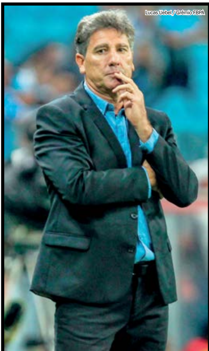
Lucas Uebel/Grêmio FBPA