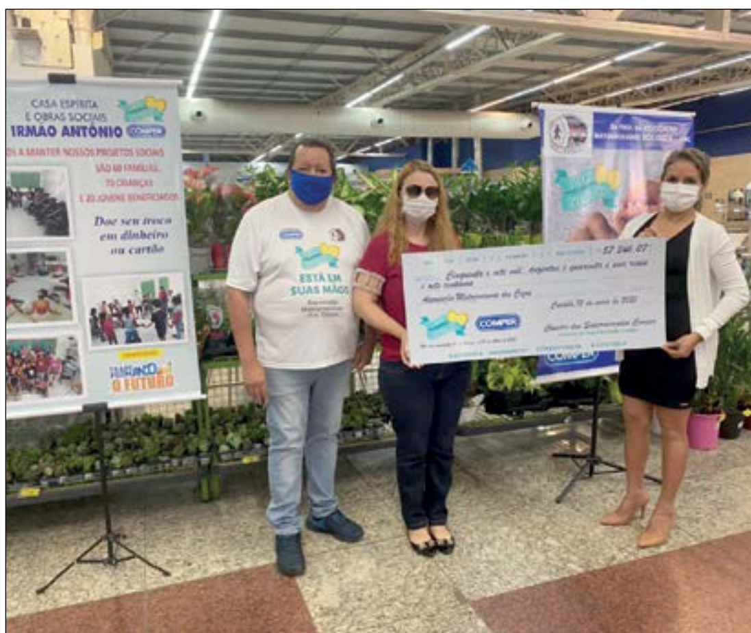
A rede de Supermercados Comper entrega o Troco Solidário para a Associação de Cegos de Mato Grosso. Tá uma campanha social exemplar!