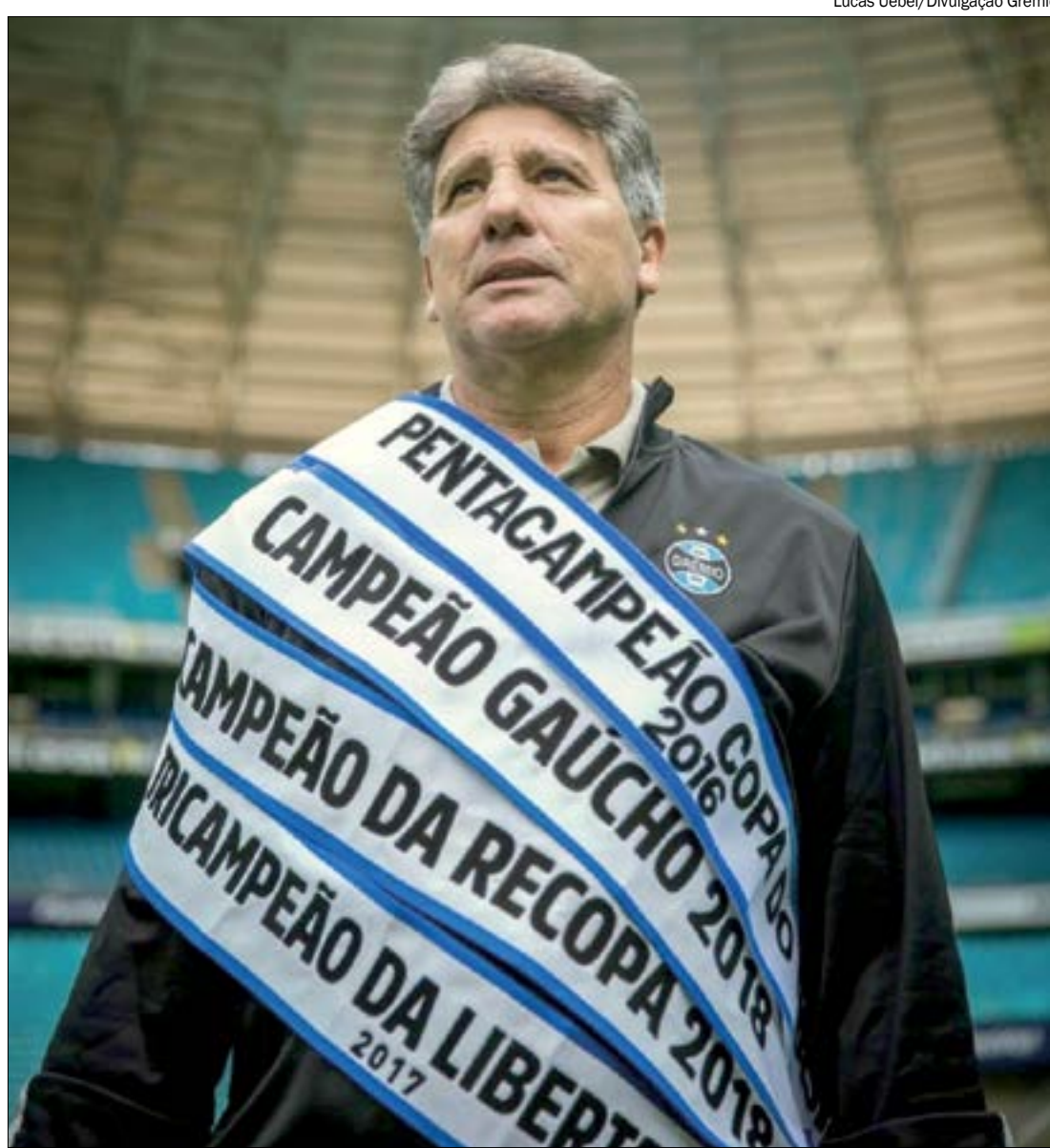
Fama de 'campeão' fez o passe de Renato Gaúcho ficar 'salgado demais' para o Corinthians

Por isso, não está descartada uma 'surpresa' na hora da escolha. Também há outros nomes sobre a mesa. Dorival Júnior e Sylvinho são as opções mais 'pé no chão'. Por hora, a coisa mais certa é a lista dos descartados: Lisca (Atlético-MG), Guto Ferreira (Ceará) e Fábio Carille não têm chances.