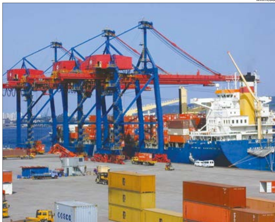
Principal canal de exportações usado por Mato Grosso, Porto de Santos pode ser fechado

dades portuárias vai na contramão do que tem sido praticado em nações cujo o impacto do coronavírus tem sido ainda mais grave do que o ve-