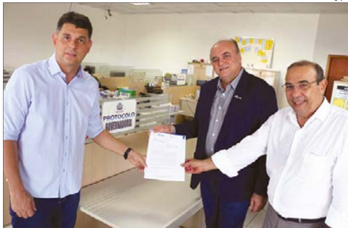
Setor produtivo apresenta propostas para socorrer empresas e garantir empregos

"Teremos um ano dramático. Começamos com expectativa de que a economia brasileira iria crescer acima de 3%, mas tudo mudou. Falar que cresceremos zero já é estar sendo otimista", avalia Vivaldo.