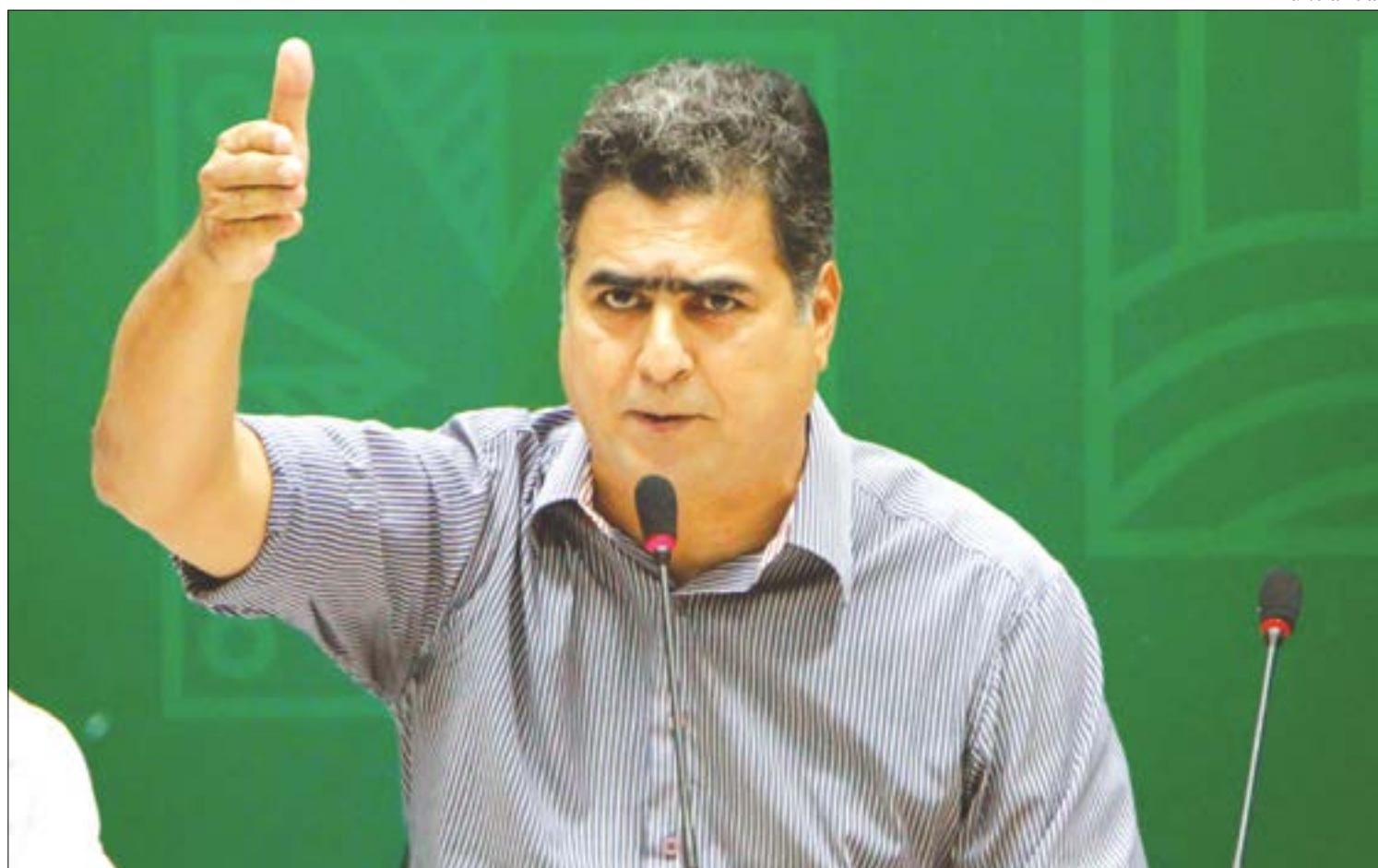
Pinheiro afirmou que vai preparar uma ala especial no antigo PS para tratar pacientes de coronavírus

“Hoje (quinta-feira) chega uma carga desses