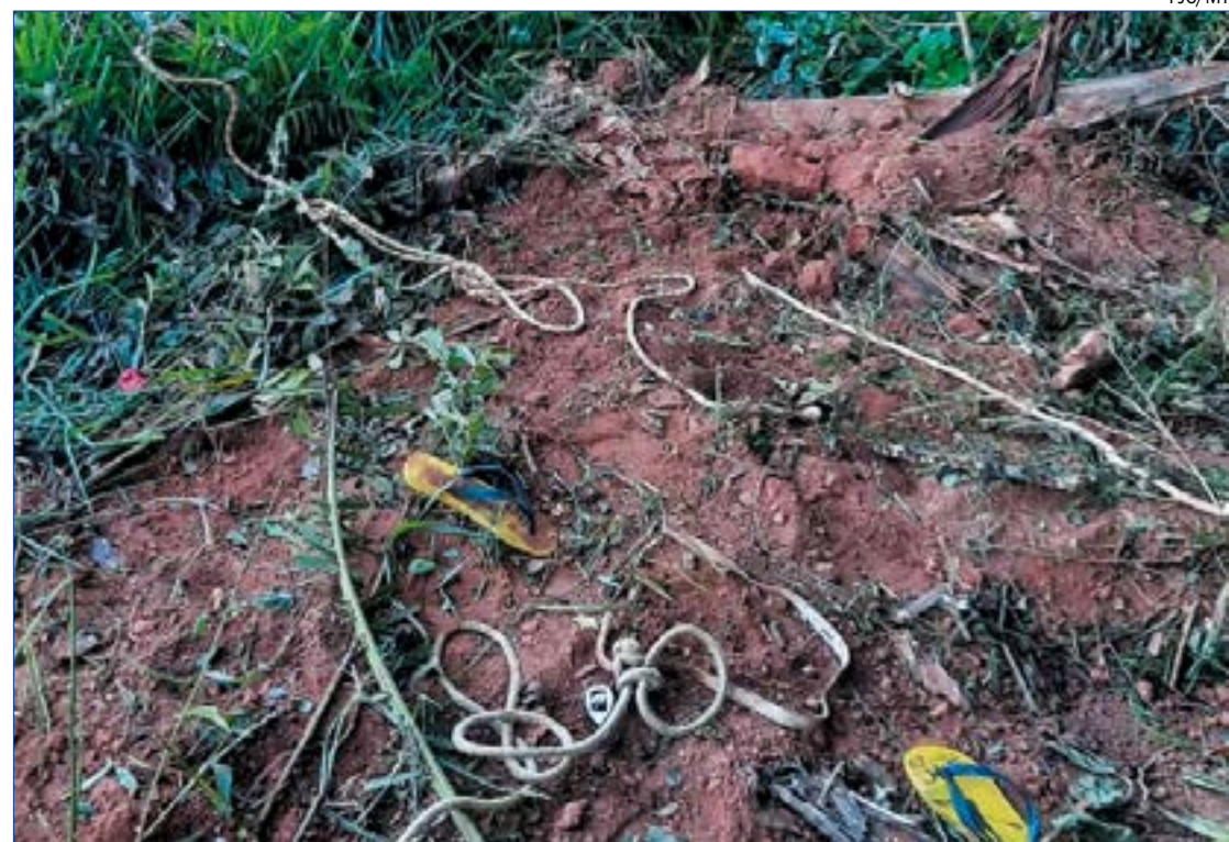
As vítimas só foram localizadas na manhã desta quinta-feira (19) e um dos suspeitos foi reconhecido

Já na manhã desta quinta-feira (19), a PM encontrou as vítimas e conseguiu identificar um dos criminosos que ainda não foi preso. A Polícia Civil investiga o caso.