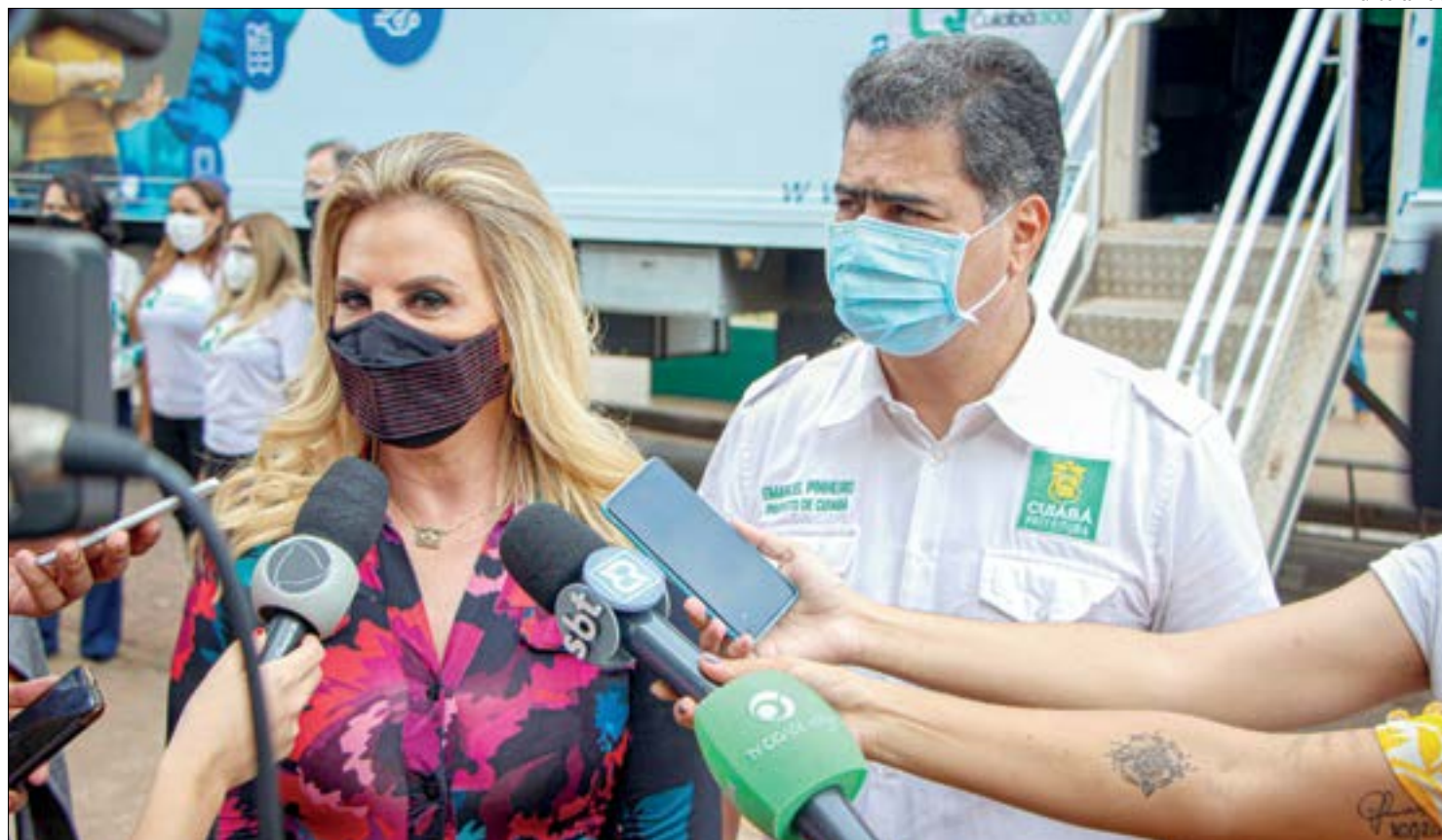
Primeira-dama destaca que ações do Qualifica Cuiabá já estão apresentando resultados positivos na geração de empregos

Construção civil, Tecnologia da Informação, Alimentos, Gestão, Vestuário são alguns dos cursos que serão oferecidos, por meio de uma parceria com o sistema Sesi/Senai. O projeto também prevê uma programação específica para atender o público feminino, jovens que estão