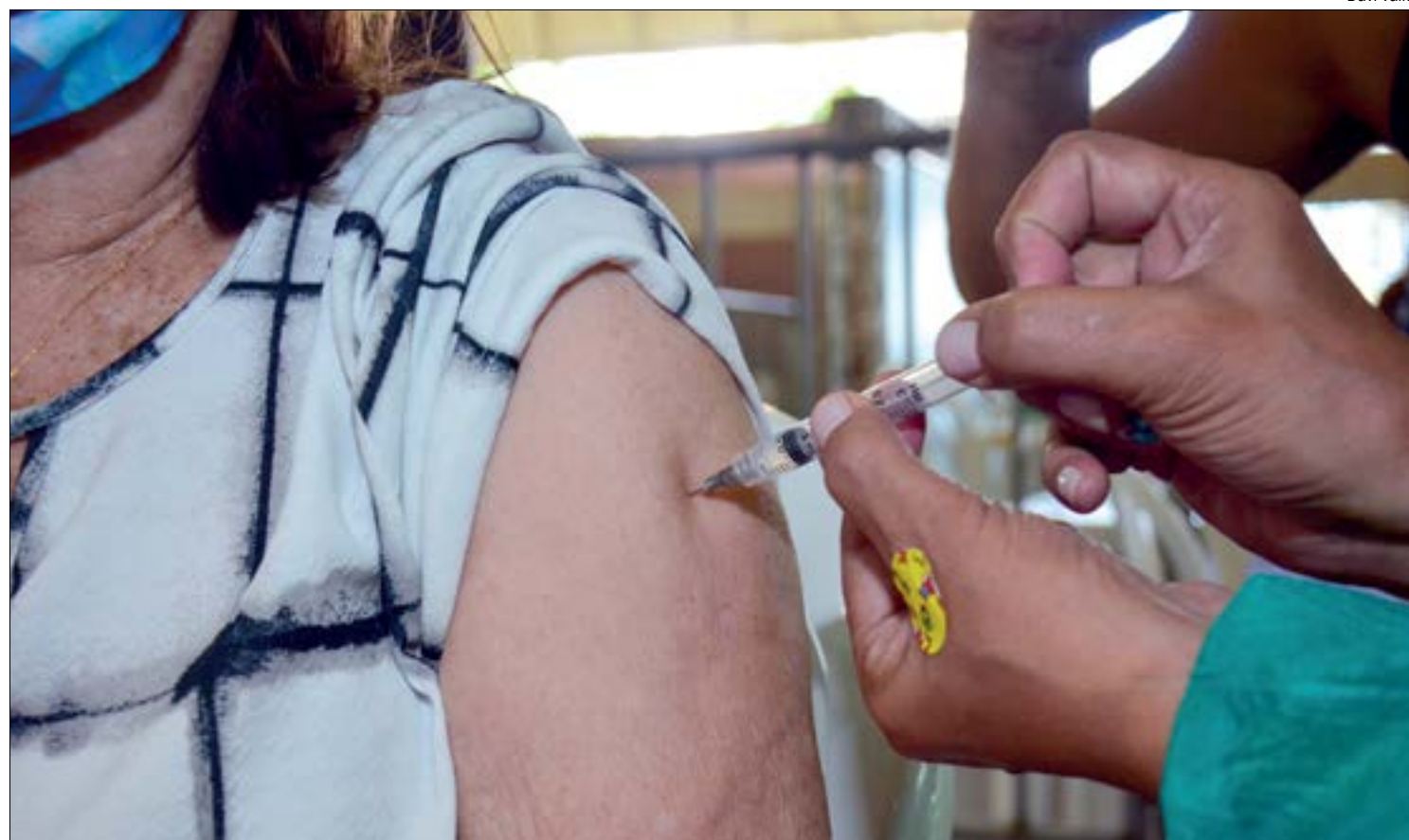
No momento, Cuiabá dispõe de doses para aplicação em pacientes renais em tratamento