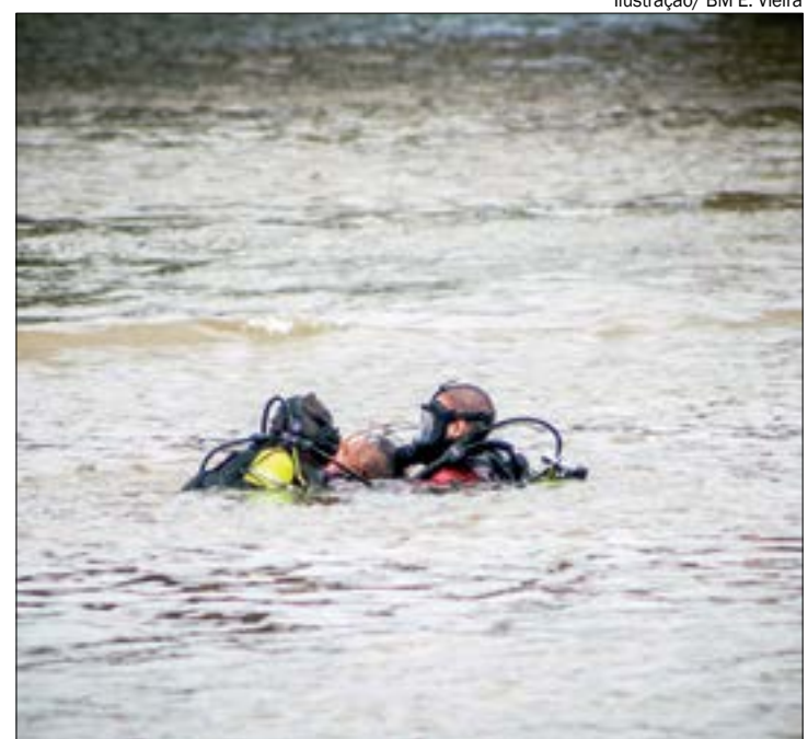
Ilustração/ BM E. Vieira