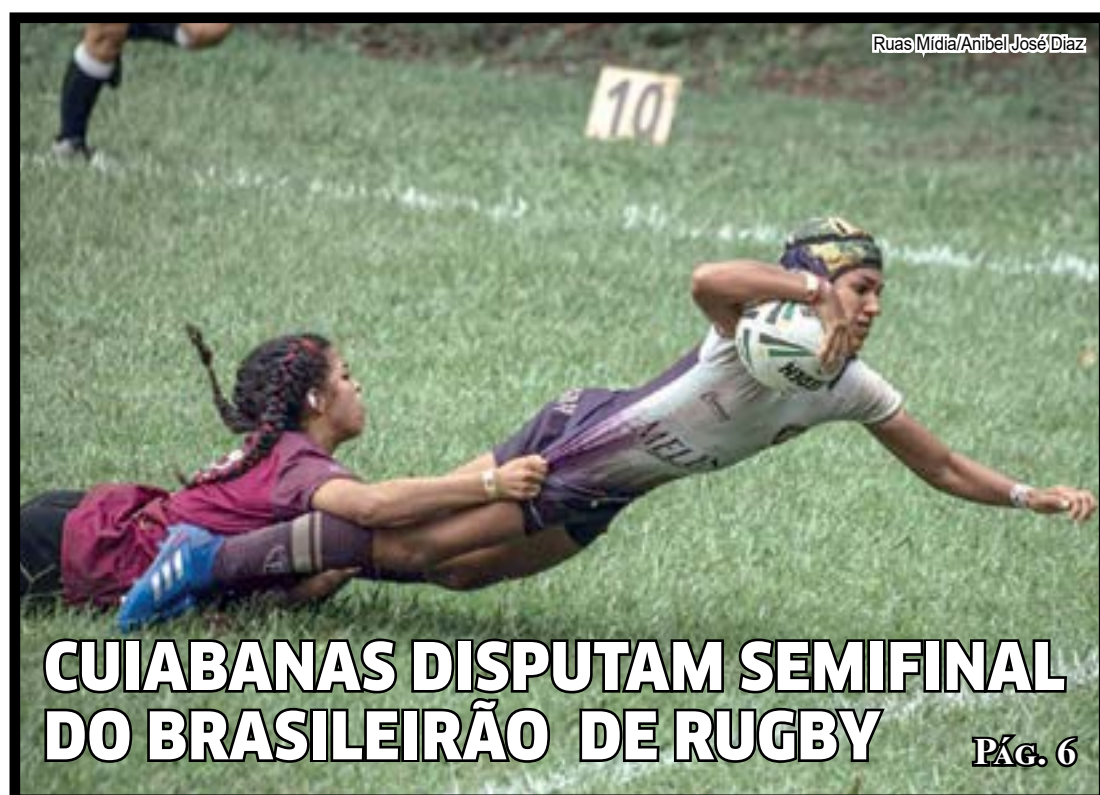
Ruas Mídia/Anibel José/Diaz