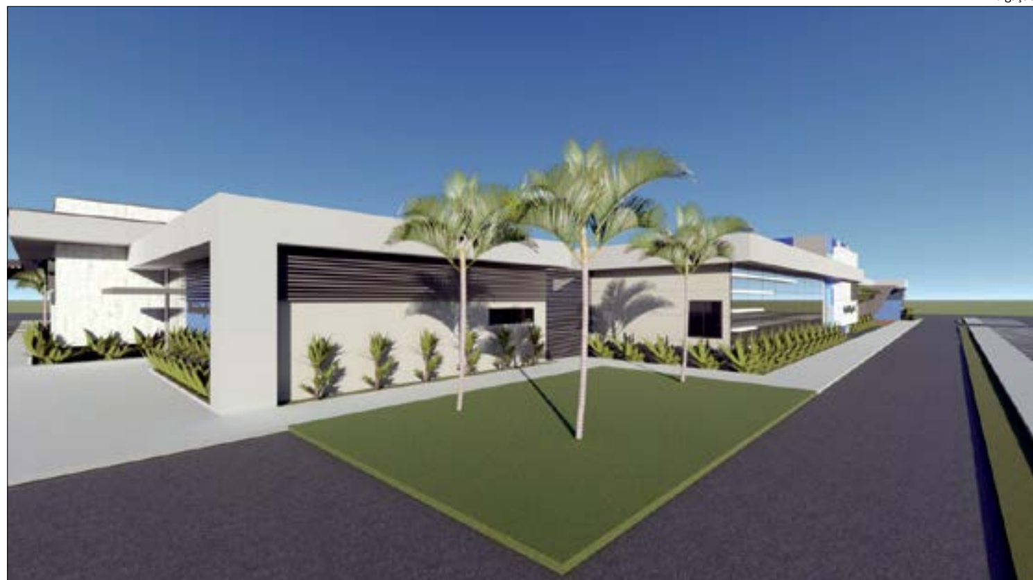
O hospital terá 141 leitos de enfermagem e 40 de UTI, incluindo unidades pediátricas e neonatal