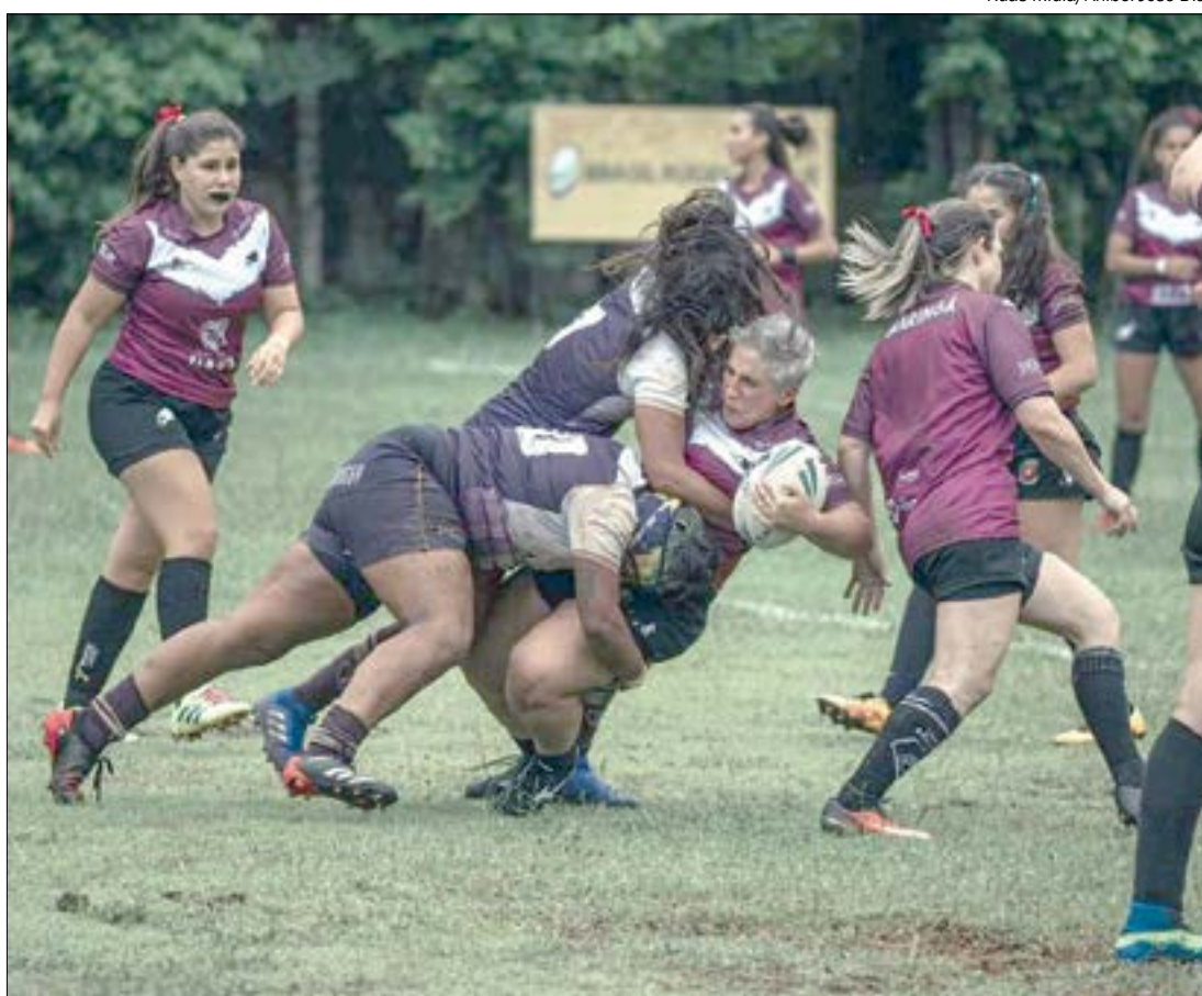
Criado há cinco anos, Melina é considerado uma das melhores equipes do Brasil

SELETIVA - Além das semifinais do Campeonato Brasileiro, as atletas de Cuiabá devem participar do 'camp' da seleção brasileira de Rugby League, uma seletiva para compor a equipe que irá representar o Brasil na Copa do Mundo de Rugby League, que acontece em outubro, na Inglaterra.