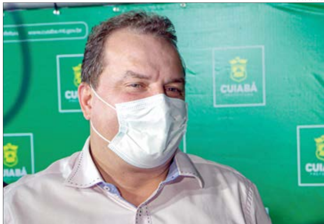
Russi diz que AL deu 'voto de confiança' ao governo e vai esperar decisão do Confaz