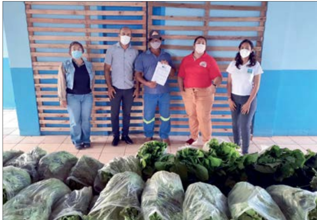
Além de injetar recursos na agricultura familiar, programa prevê distribuição de alimentos para famílias carentes