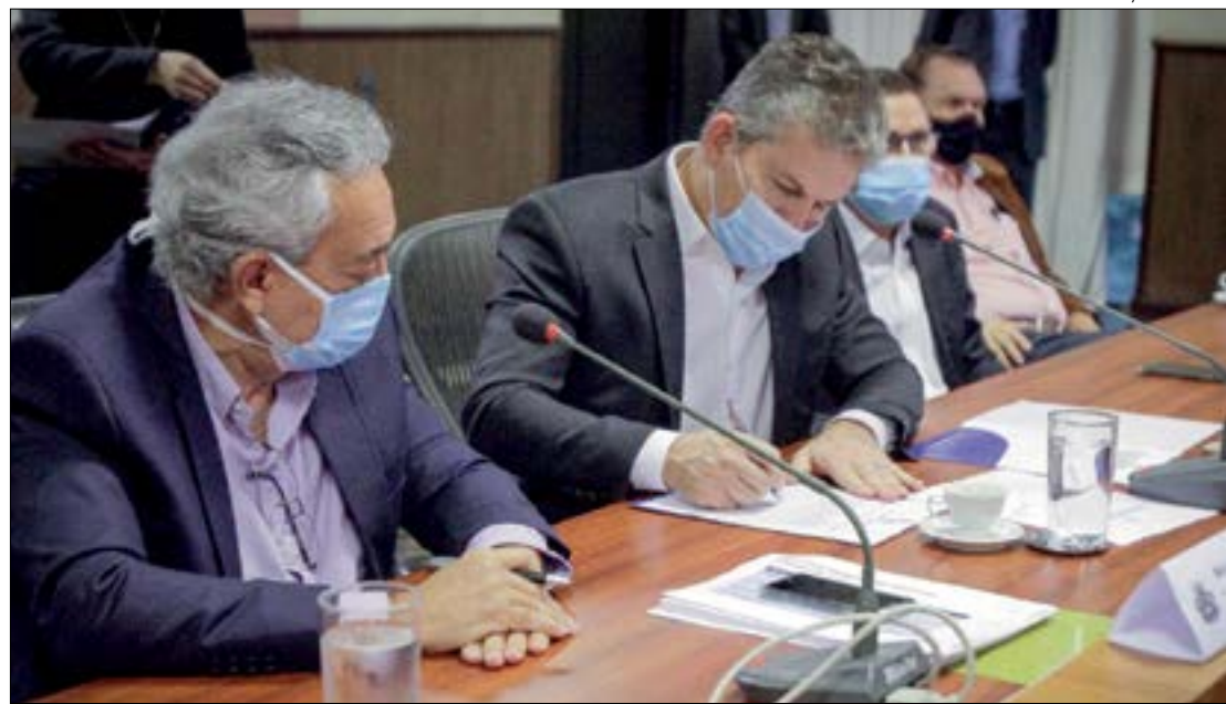
Mauro aposta em concessões para melhorar a logística e liberar recursos do Estado para outros investimentos

“Com menos despesas para manutenção, mais recursos podem ser investidos em novas obras, que melhoram o trânsito, atraem investimentos, empresas, oportunidades, postos de trabalho e renda. Um jogo de ganha-ganha que vai manter Mato Grosso em ascensão econômica e possibilitará distribuir essa riqueza com a população”, concluiu.