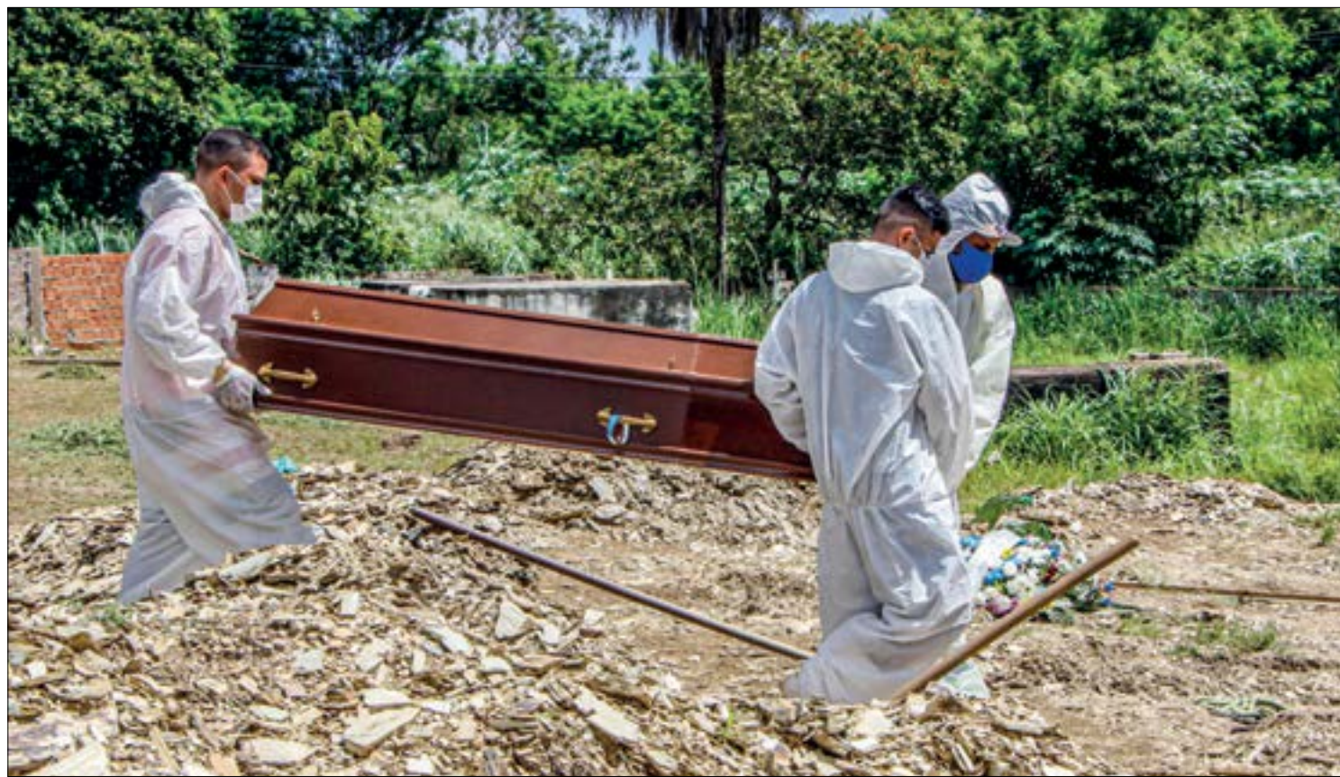
Um ano depois, Mato Grosso registra infelizmente a marca de 10 mil mortos pela covid-19