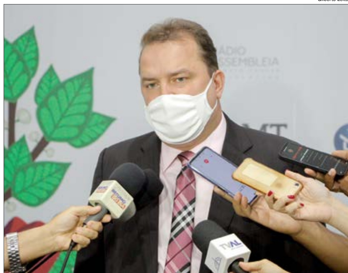
Russi destaca que enfermeiros estão salvando vidas na linha de frente e precisam de salários mais justos

“São esses profissionais que estão na linha de frente e são submetidos a uma grande sobrecarga de trabalho, ainda mais nessa pandemia que estamos passando e assola nosso país, nosso Estado. Esses profissionais precisam de total valorização, total apoio e podem contar com esse Parlamento”, assegurou.