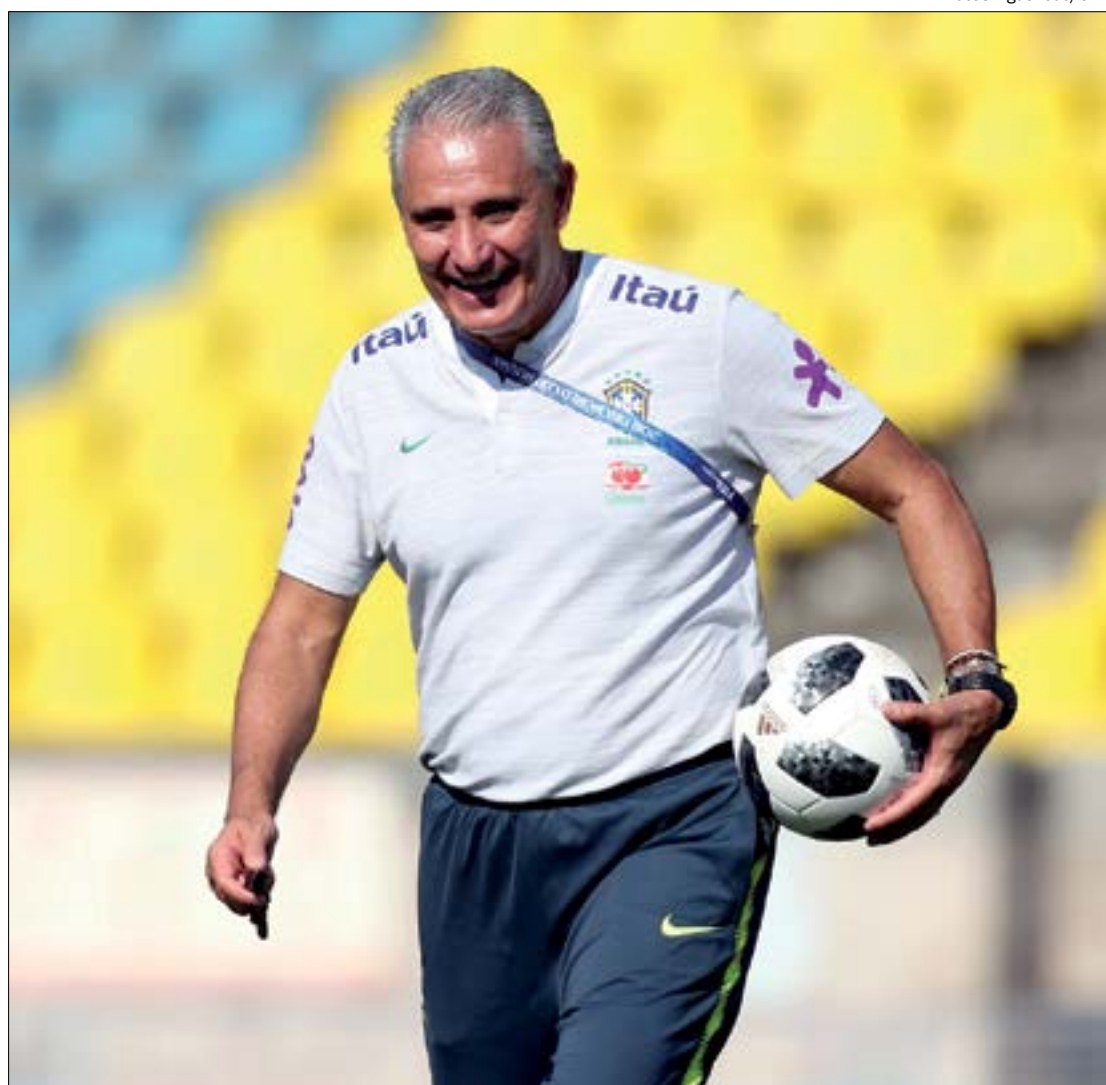
Brasil volta a campo no dia 4 de junho e terão uma agenda apertada até o julho, quando acaba a Copa América