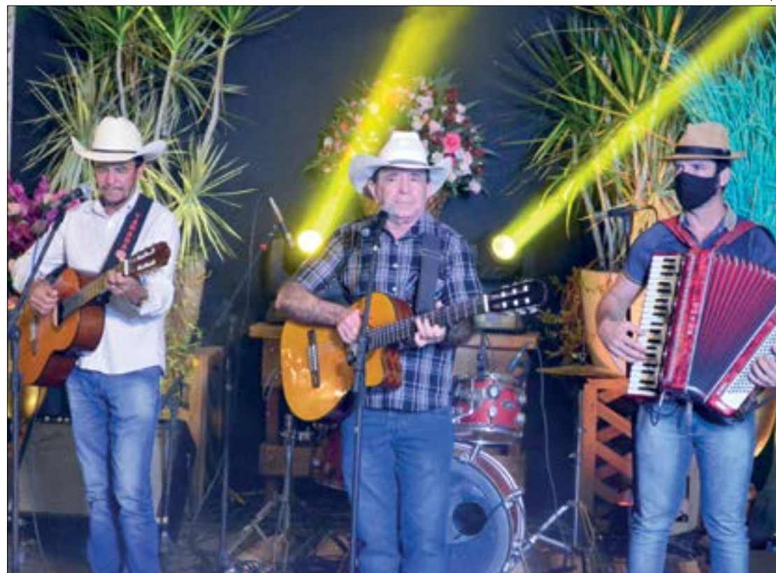
Prefeitura de Sinop

Está autorizada a realização de eventos sociais para até 200 pessoas a partir desta sexta-feira (7) em Sinop. A medida foi anunciada em novo decreto editado pelo prefeito Roberto Dornier ontem. O relaxamento das restrições foi liberado após a cidade reduzir seu risco de contágio na classificação por mais de duas semanas. O número "consideravelmente menor" de internações em UTIs também foi um dos argumentos do gestor em sua decisão