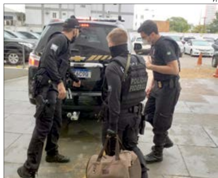
Bando utilizava grandes carretas para fazer o transporte de cocaína de Mato Grosso para São Paulo

O nome da Operação "GRÃO BRANCO" deve-se ao transporte de grãos (soja, milho) do Estado de Mato Grosso para São Paulo para justificar as viagens das carretas que transportavam a cocaína.