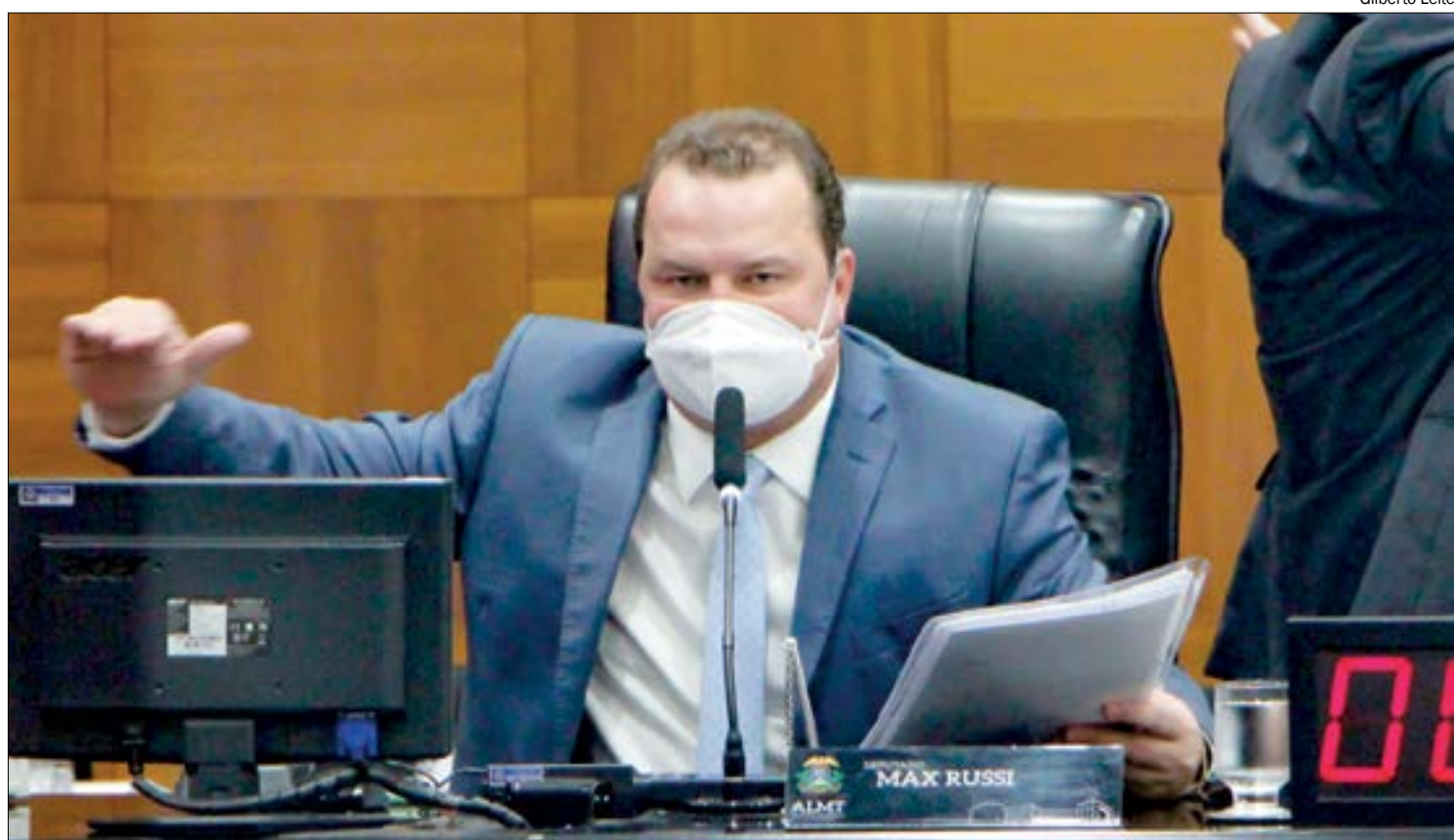
Presidente da Casa explica que decisão atende pedido de deputados descontentes com atuação da Defensoria