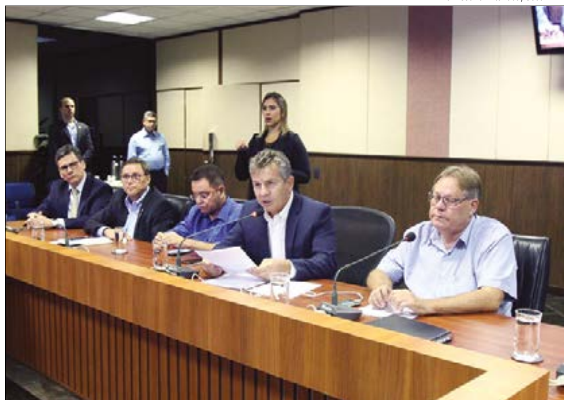
Governador se reuniu com o Gabinete de Situação para anunciar novas medidas contra o coronavírus