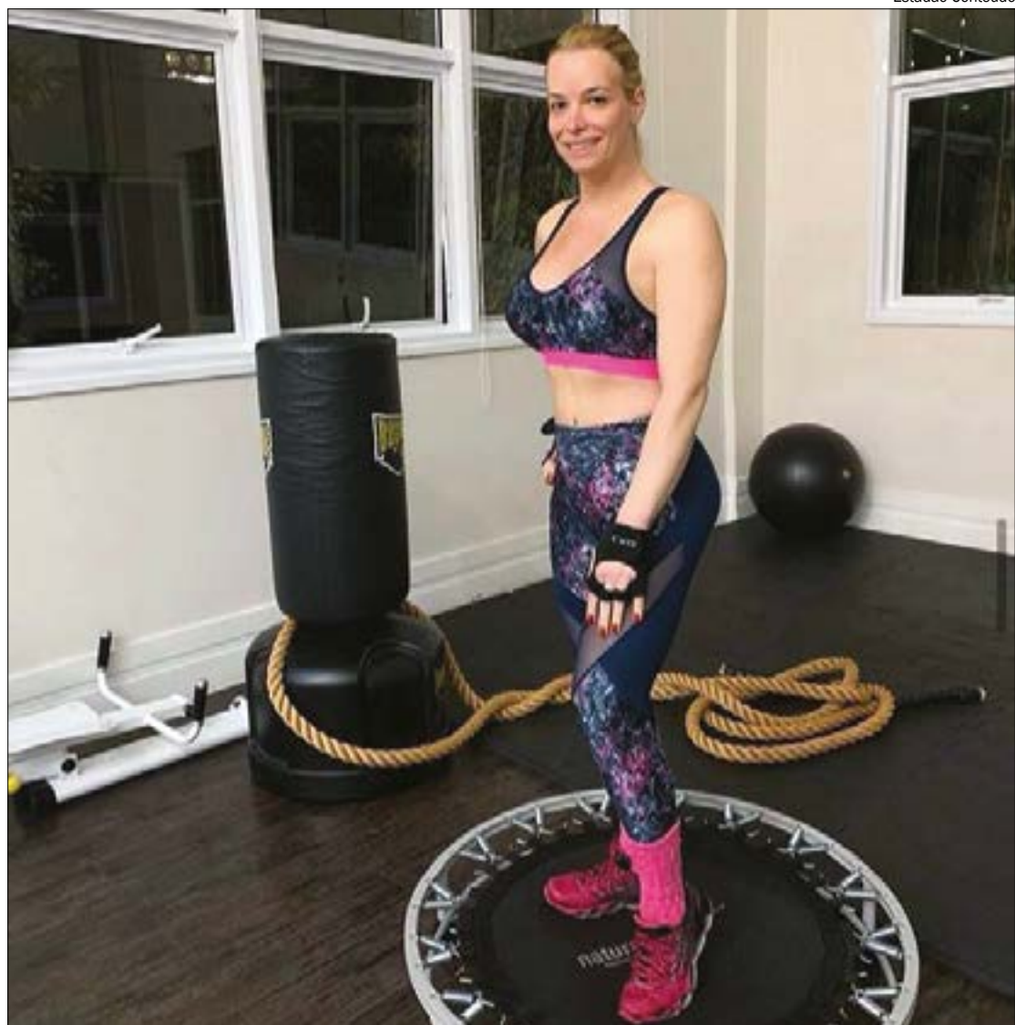
Exercícios simples, feitos em casa, ajudam a ocupar a mente e fortalecer o corpo