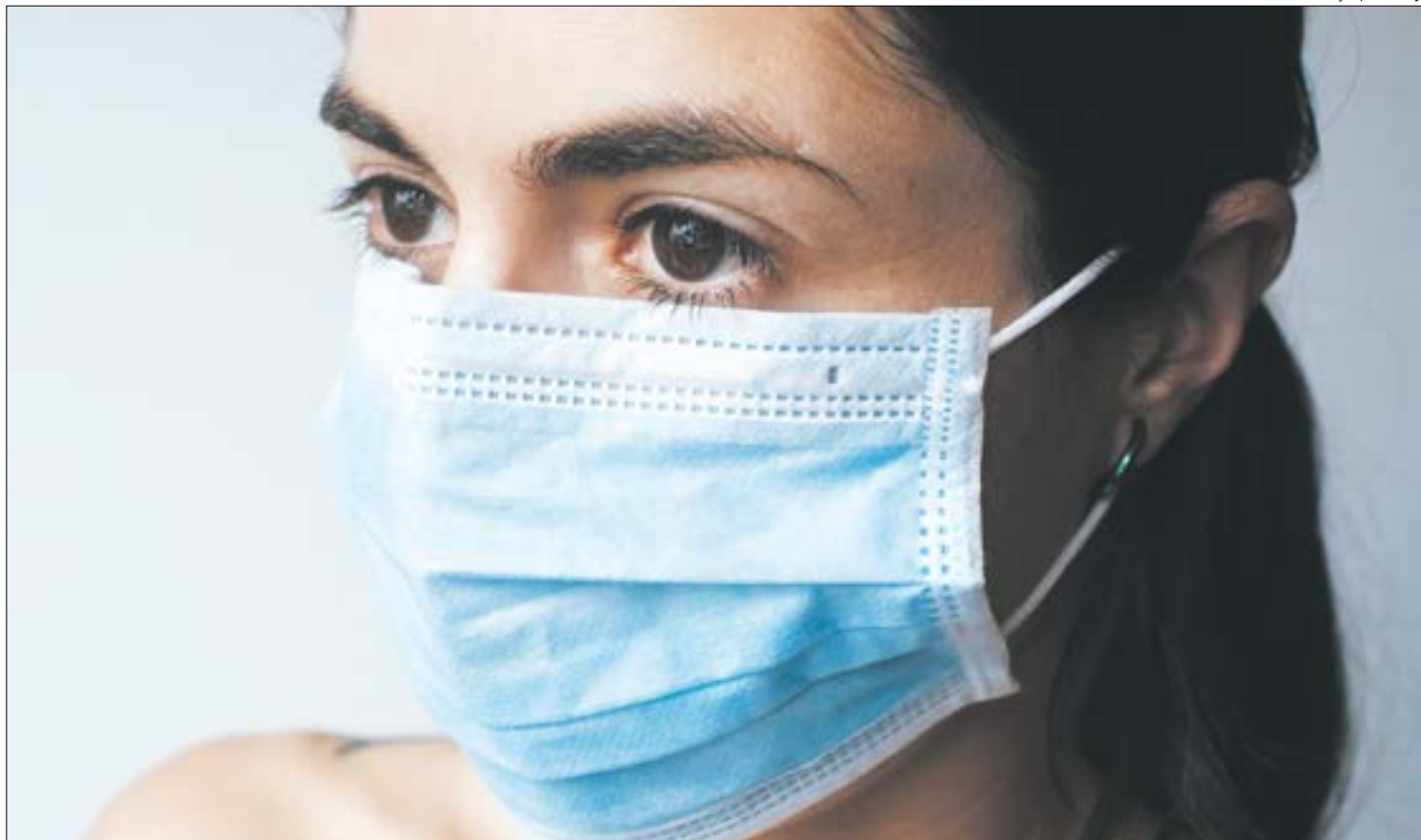
Passageira deve ficar reclusa por 14 dias, depois de viajar no mesmo ônibus que uma mulher que ignorou medidas de segurança obrigatórias ao retornar de viagem a Portugal

A passageira lembra que nesse momento uma equipe de saúde chegou ao local e uma mulher entrou no ônibus toda protegida com máscara e avental. “De forma técnica, ela explicou que uma passageira precisava ser avaliada, pois não havia passado pela inspeção. A mulher então foi até a passageira, que estava sentada na poltrona do corredor ao lado da minha e perguntou se o nome dela era aquele que ela havia dito e se ela teria vindo de Portugal. Ela confirmou tudo e nesse momento foi convidada a se retirar do ônibus e acompanhar a outra mulher”.