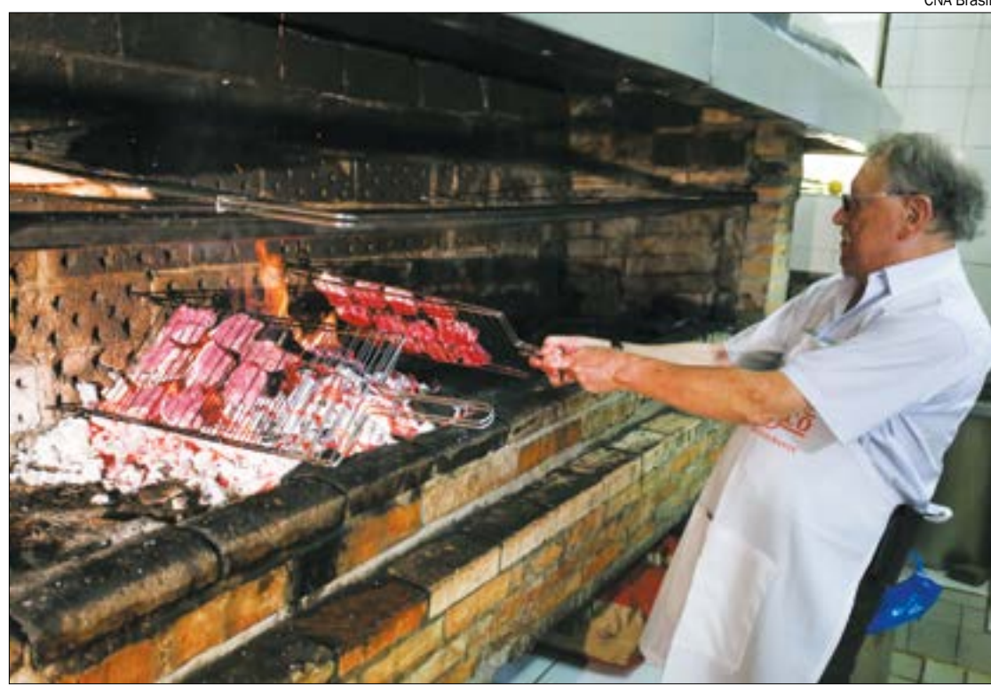
Fechamento de bares, restaurantes e hotéis compromete o mercado da carne

ximo que podemos afirmar é que a produção será maior do que o consumo", conclui Paulo.