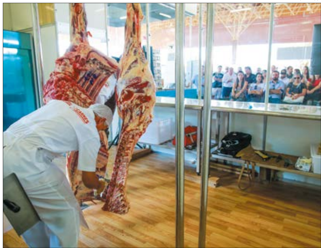
Frigoríficos estão diminuindo abates e escalas para se adaptar ao novo cenário

Em entrevista à Reuters, a porta-voz da Minerva Foods disse que as férias coletivas seriam a melhor saída, "tendo em vista que permitem preservar a economia