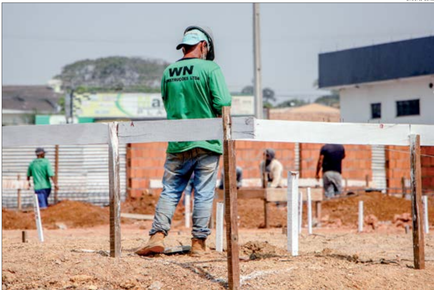
Sinduscon prevê retomada do crescimento no segundo semestre, com avanço da vacinação

Os dados mostram que o setor “andou de lado”, sem conseguir deslanchar após superar o nível de pré-pandemia. A situação piorou no começo de 2021, com um retorno aos níveis registrados em agosto de 2020. A pesquisa foi realizada com 681 empresas entre os dias 1 e 26 deste mês.