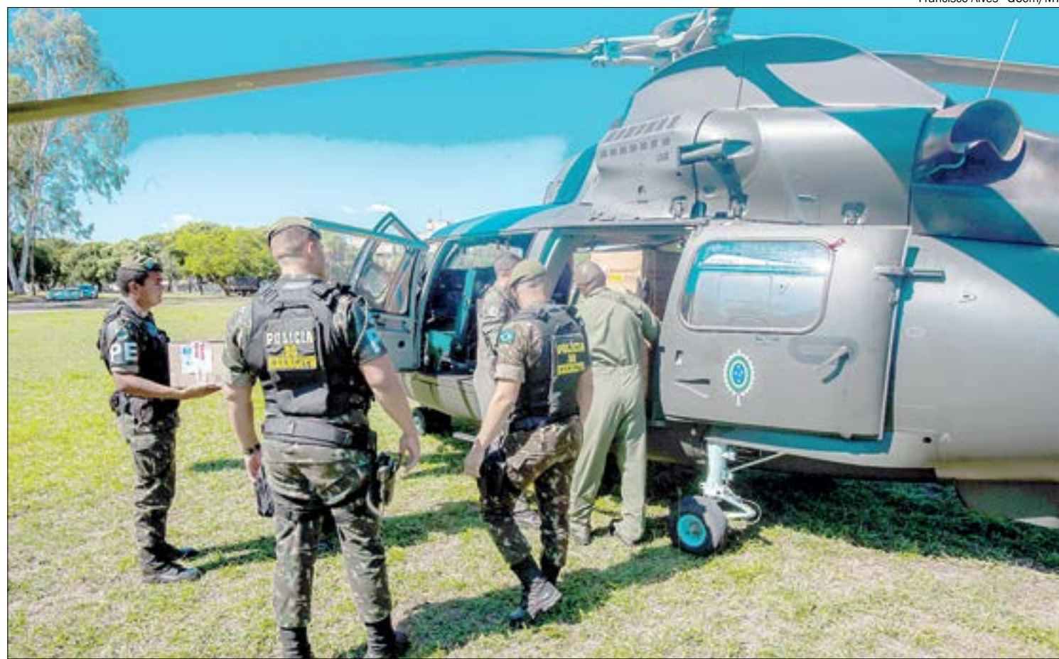
Em 2021, somente o Estado está investindo R$ 73 milhões em ações de prevenção e combate ao desmatamento