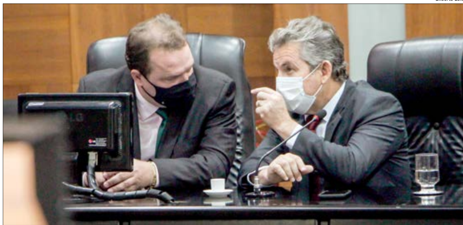
Mauro busca aliados políticos e técnicos para reverter decisão da Anvisa sobre Sputnik V

O próprio Instituto Gamaleya usou sua conta no Twitter para criticar a decisão da Anvisa e acusou a agência de fazer política. "Os atrasos da Anvisa na aprovação do Sputnik V são, infelizmente, de natureza política e não têm nada a ver com acesso à informação ou ciência".