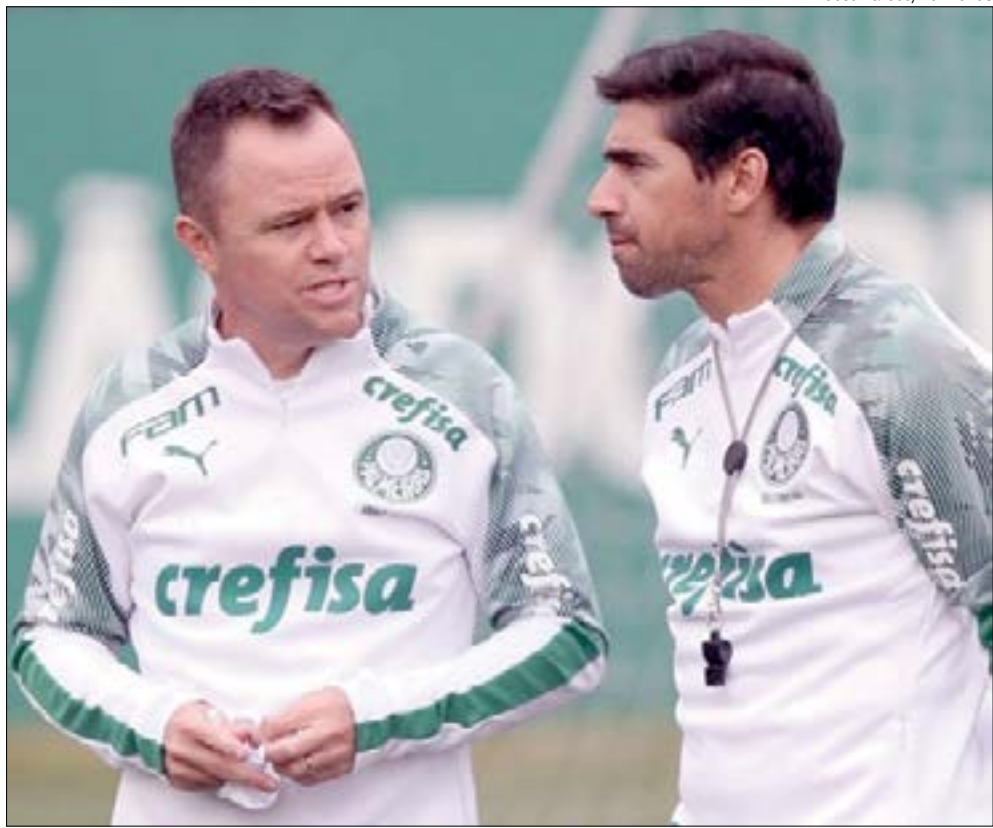
Atual campeão, Palmeiras irá defender seu título contra o CRB na terceira fase

*Times à esquerda decidem os duelos como mandantes