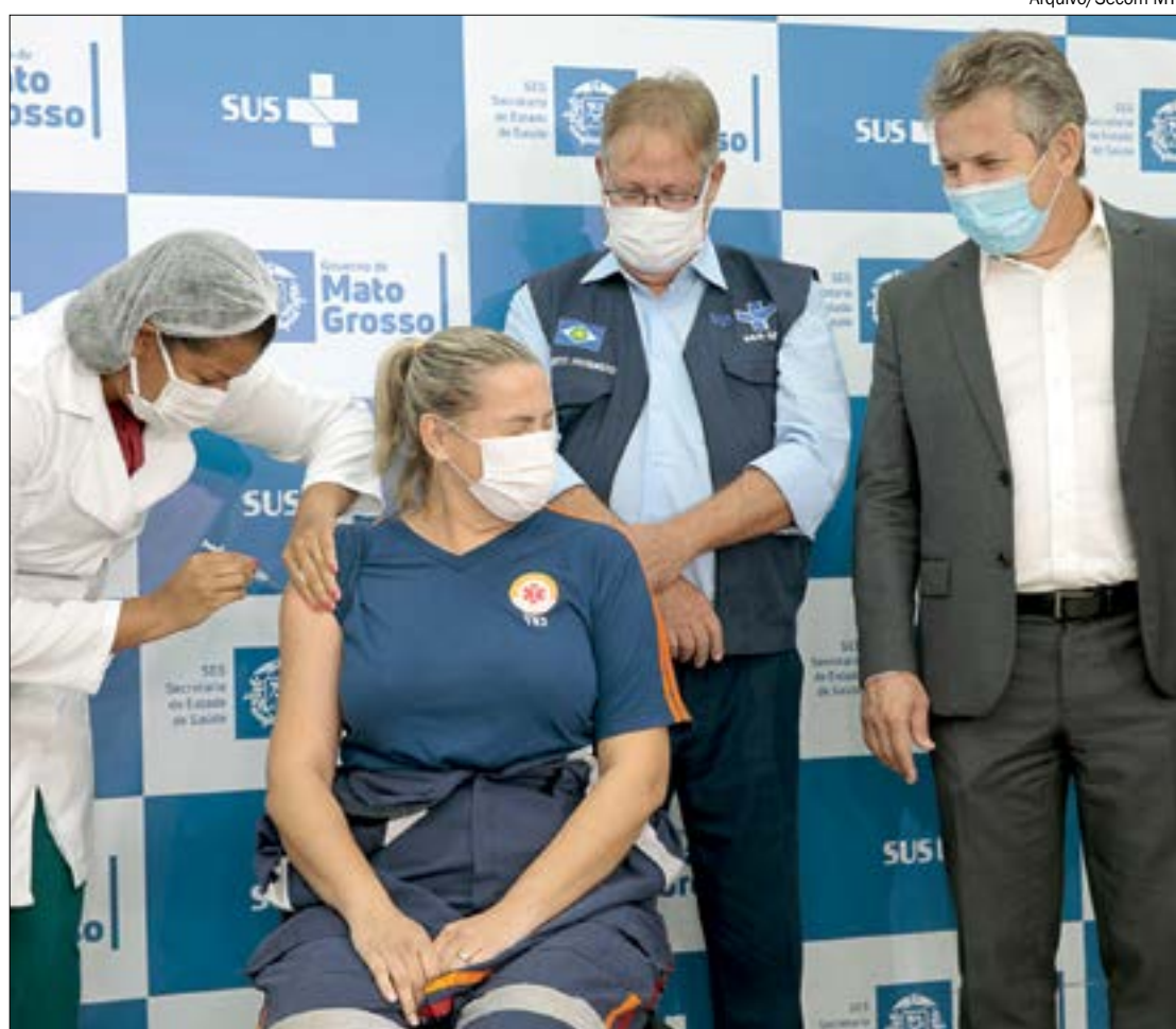
Caso se confirme a compra do Consórcio, Mato Grosso terá doses suficientes para vacinar toda sua população e até sobra

A Procuradoria do Distrito Federal pretende ingressar na Justiça para que a liminar concedida ao Estado do Maranhão seja estendida aos demais membros do consórcio, para que todos possam importar a vacina e dar início à vacinação de sua população.