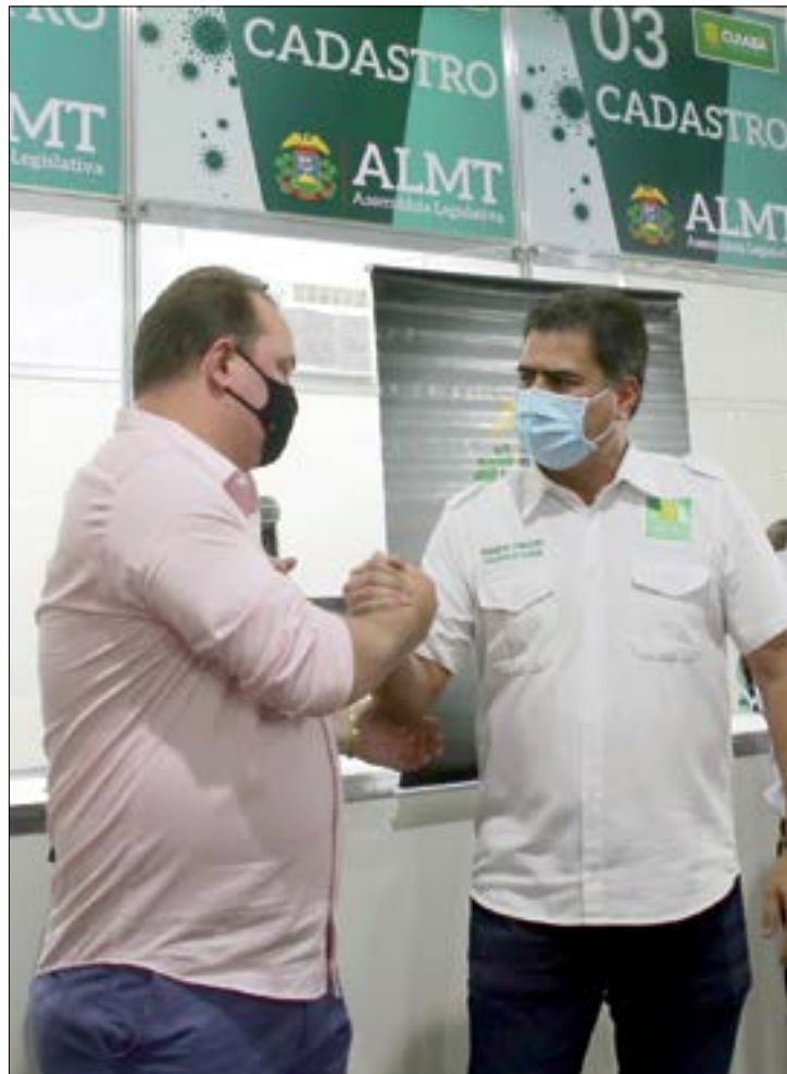
Parceria entre AL e Prefeitura pode incluir o 'Corujão da Vacinação'