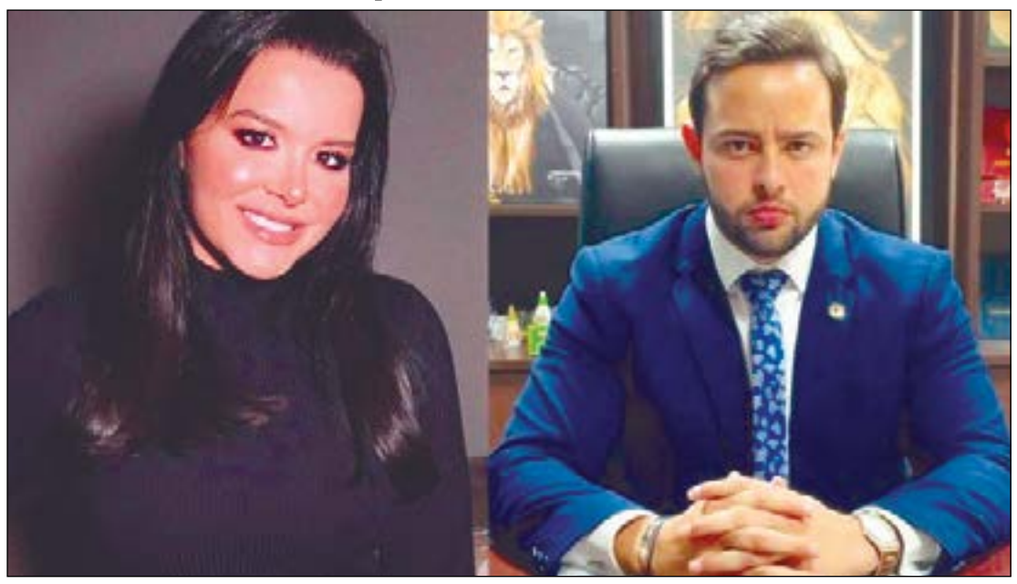
Não se fala em outra coisa no burburinho da society local. O romance entre o deputado estadual Ulysses Moraes e a cantora sertaneja Maraísa. Jovens, bonitos e bem sucedidos, estamos na torcida para que o affair siga em frente. Beijos e me liga!