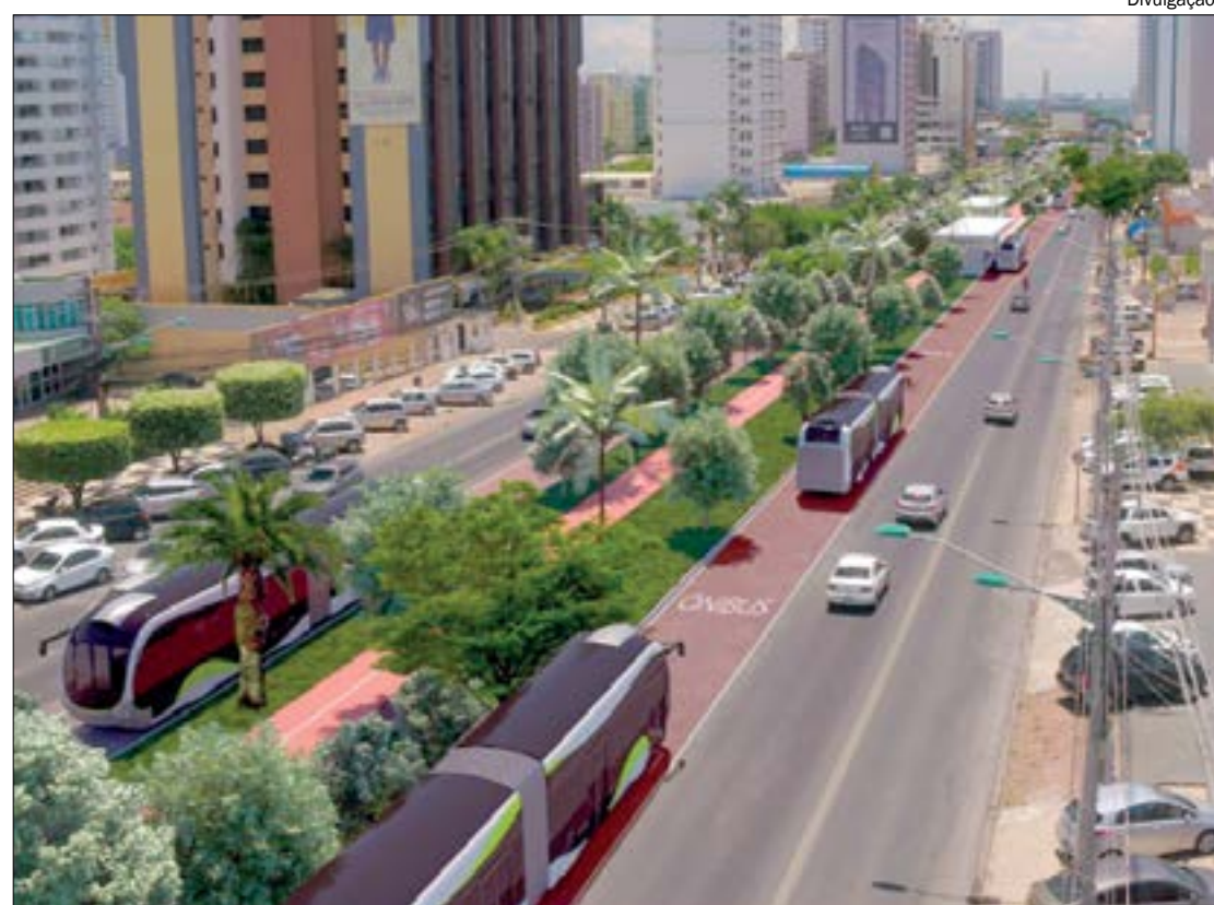
Documentos sobre o BRT já estão disponíveis para acesso no site do governo