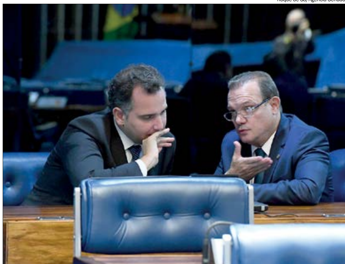
Pacheco pretende dar prioridade a projeto de Wellington que libera produção de vacinas em fábricas veterinárias

O projeto estabelece que todas as fases relacionadas à produção e ao armazenamento das vacinas deverão ocorrer em dependências fisicamente separadas das que, numa mesma estrutura industrial, sejam usadas para a fabricação de produtos de uso veterinário. O controle será feito pela Agência Nacional de Vigilância Sanitária (Anvisa), nos termos da Lei nº 9.782, 1999.