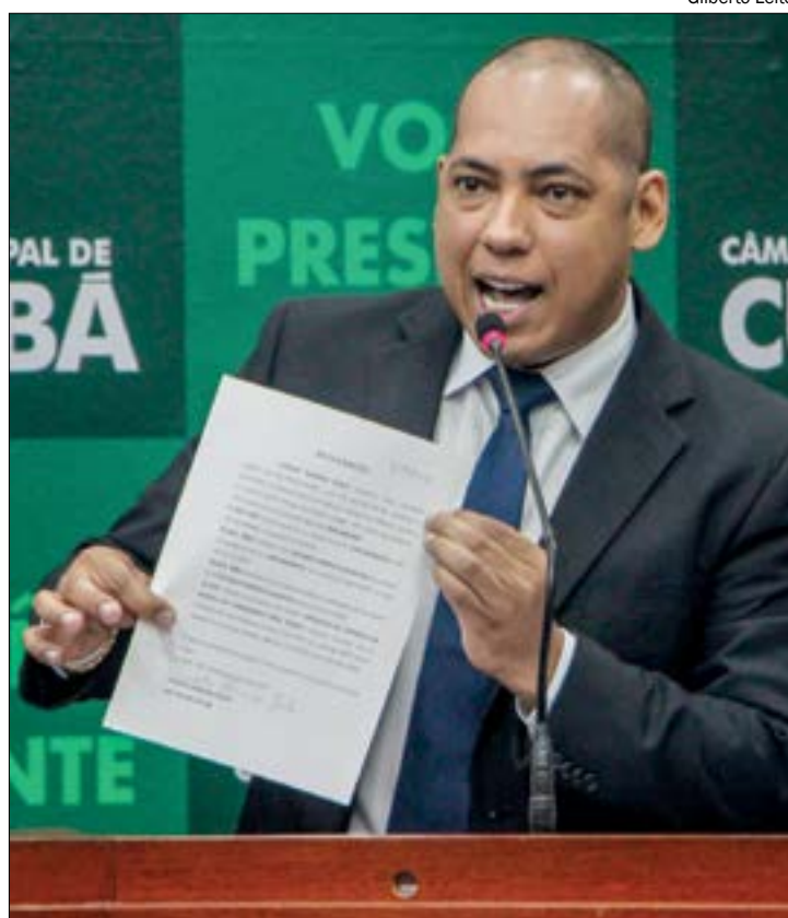
Juca ainda acredita na conclusão do VLT e aposta até em intervenção do MP pelo modal

Juca ainda afirmou que nutre esperanças de