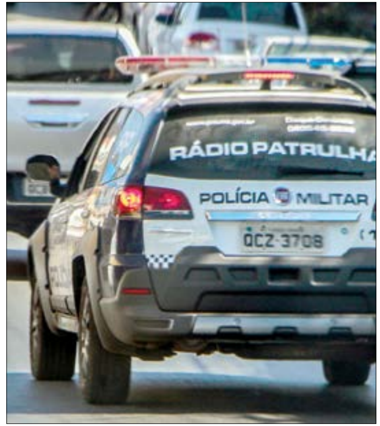
A idosa não soube reconhecer os estupradores, mas afirmou que eles eram haitianos. A polícia investiga