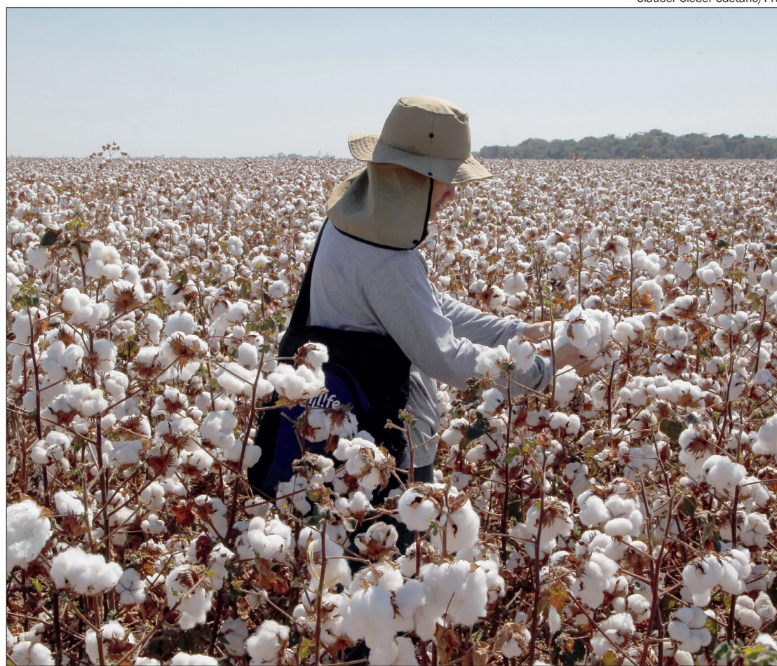
Mesmo com a queda nas áreas de plantio, a participação da 1ª safra de algodão foi maior neste ano

A área total firmada ficou em 942,37 mil hectares, sendo previsto 135,89 mil hectares ao cultivo da 1ª safra, enquanto 806,48 mil hectares para 2ª safra. Um recuo de 16,76% se comparado a safra de 2019/20.