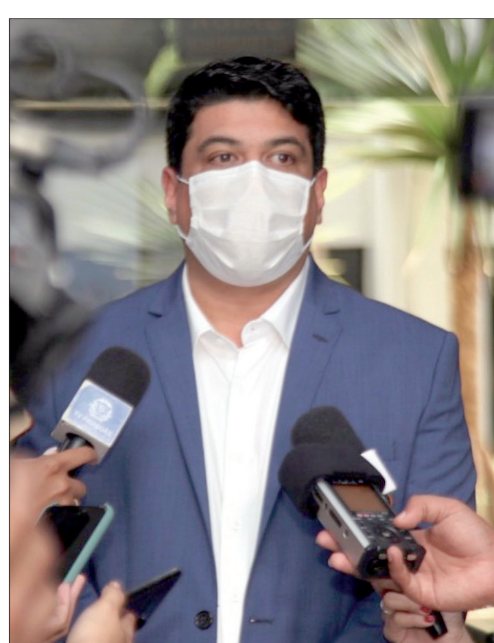
O ilustre prefeito de Várzea Grande, Kalil Baracat

O Pantanal mato-grossense perdeu 40% de toda sua área por causa das queimadas em 2020. Apesar de comuns neste período do ano, as queimadas precisam ser foco de discussões para que uma nova tragédia não aconteça. Tanto que, pensando nisso, a Ordem dos Advogados do Brasil - Seccional Mato Grosso (OAB-MT), por meio de suas Comissões de Acompanhamento das Políticas Públicas do Pantanal e de Defesa dos Direitos dos Animais, promove nesta quinta (15), o evento online gratuito "Unidos pelo Pantanal: Uma Perspectiva do Futuro". Participe!