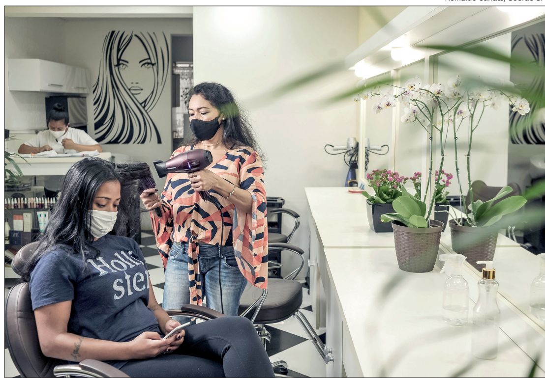
A maior parte das novas empresas (79%) são microempreendedores individuais

*A cesta Abrasmmercado não é a cesta básica, mas, sim, uma cesta composta por 35 produtos mais vendidos nos supermercados: alimentos, incluindo cerveja e refrigerante, higiene, beleza e limpeza doméstica.