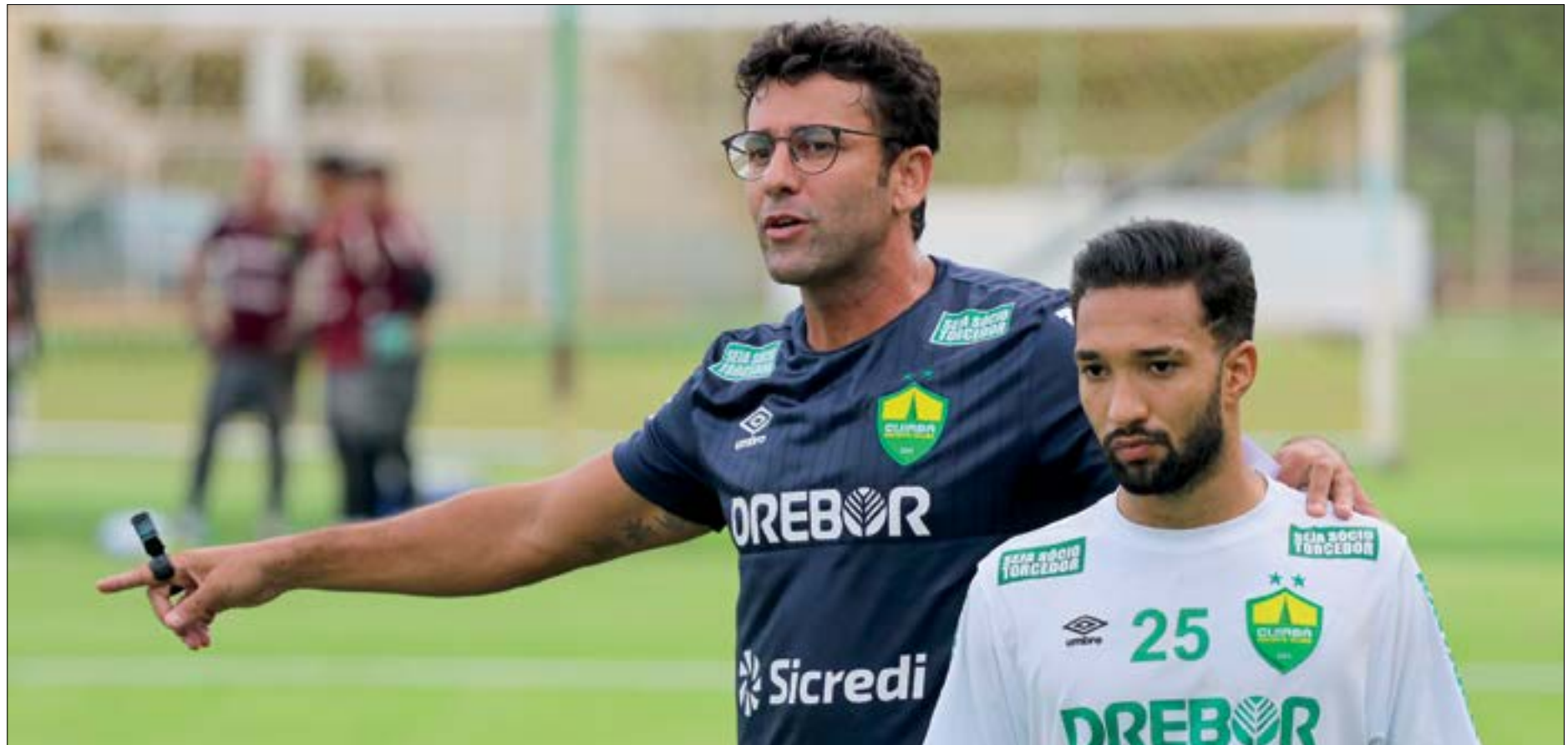
Valentim quer dobrar os treinamentos diários para que o time esteja afinado com suas ideias até a estreia