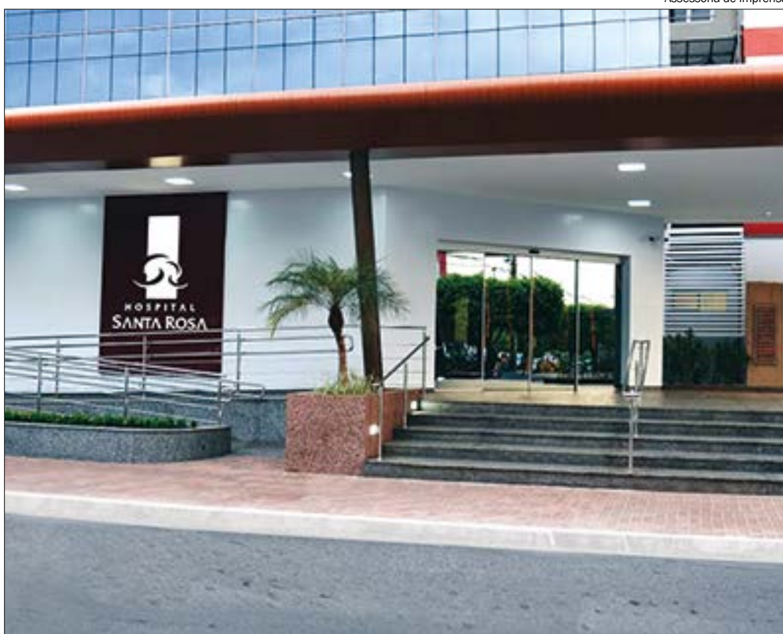
Assessoria de imprensa

Segundo o hospital, o paciente segue em monitoramento isolado e está sendo acompanhado pela equipe médica seguindo os protocolos estabelecidos pelo Ministério da Saúde. O caso foi notificado para a Vigilância