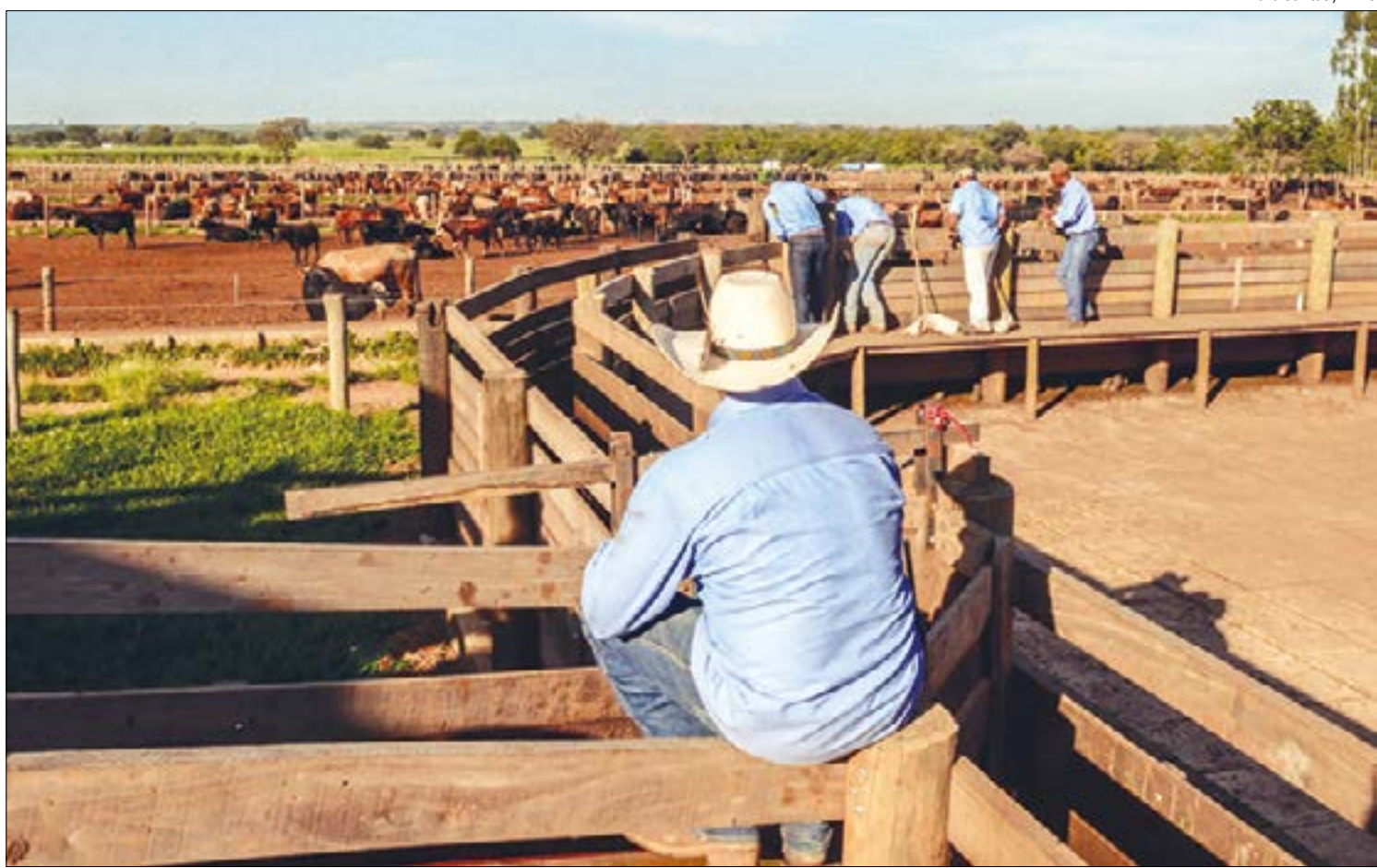
Produção de gado e soja podem ser extintas na região do Araguaia

“O impacto social disso em nossa cidade é que ela acabe. Seria a destruição total da cidade, do povo. Cocalinho hoje tem mais de 400 mil cabeças de gado, produz cerca de 70 sacas de soja por hectare, possui um grande fluxo turístico, usinas de calcário, comércio forte. Se isso