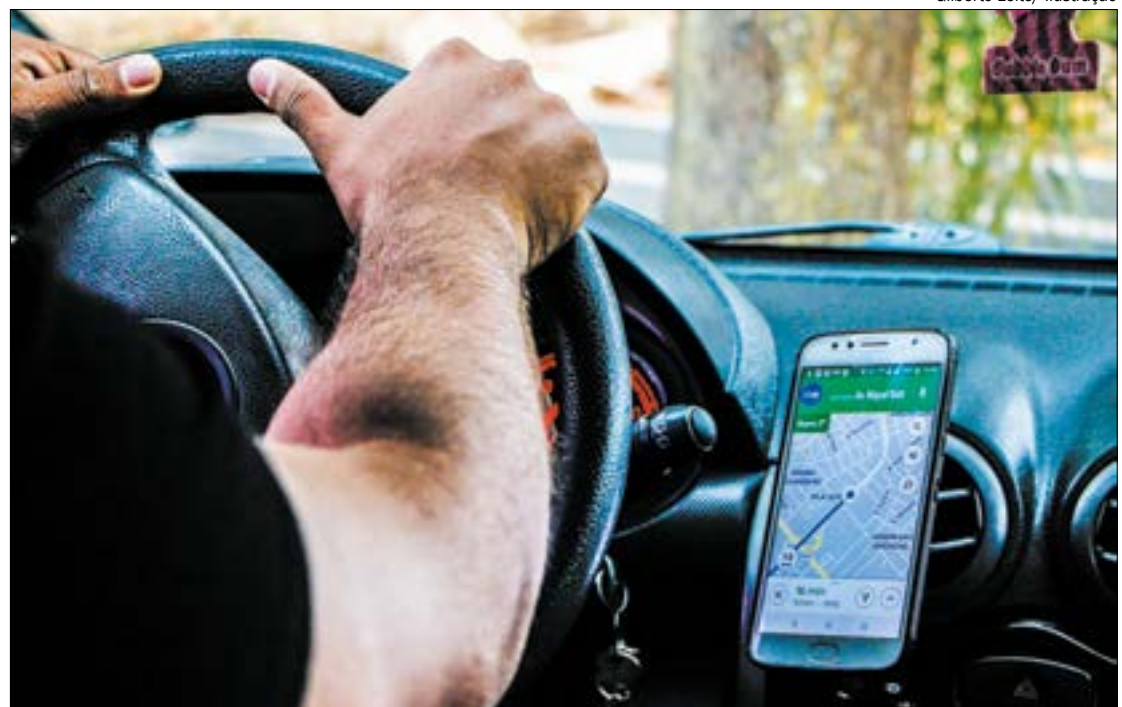
Gilberto Leite/ Ilustração

CRIMES ANTERIORES - Em dezembro de 2017, o suspeito foi denunciado pelo Ministério Público Estadual (MPE), pelos crimes de desobediência a ordem legal da autoridade militar e também por oferecer vantagem indevida