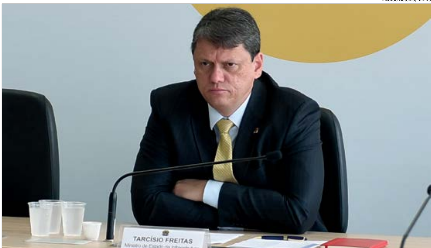
Em dezembro de 2020, Tarcísio Freitas destinou R$ 2,2 bilhões para 'riscos não-gereciáveis'

"Ao invés de derrubar a liminar, é preciso fazer as audiências públicas, levar para debate as questões ambientais e indígenas,