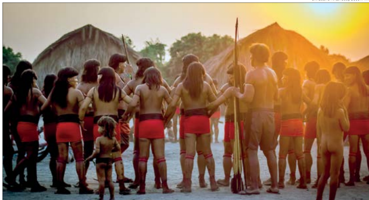
Indígenas buscam diálogo com o governo desde 2017, mas audiências nunca foram realizadas

Os levantamentos citados pelo MPF apontam para impactos nas terras do povo Munduruku nas regiões do médio e Alto Tapajós; sobre as terras dos povos Panará, Kayapó e Kayapó Mekragnotire, no sudoeste do Pará; e seis terras indígenas em Mato Grosso, incluindo áreas de povos isolados e o Parque Indígena do Xingu.