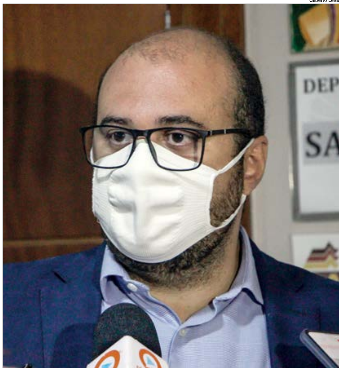
Dr. Leonardo diz ter recebido informações sobre falta de medicamentos e insumos para o combate à covid-19

Ainda conforme o Ministério da Saúde, o governo encaminhou R$ 1,2 bilhão para enfrentamento à covid-19 em Mato Grosso, sendo R$ 427 milhões para a Secretaria Estadual e R$ 815 milhões para as secretarias municipais.