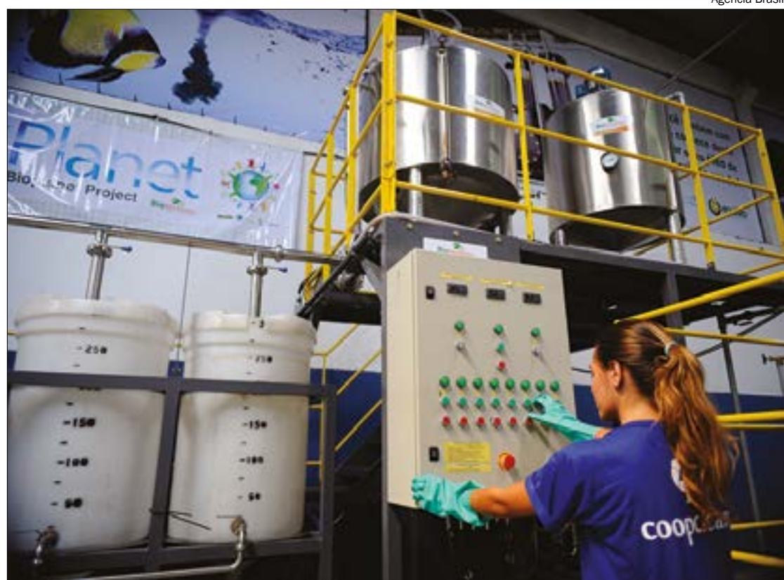
Usinas sustentáveis faturam ‘extra’ com créditos de carbono no RenovaBio