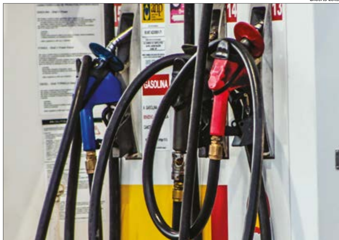
Os novos preços estarão em vigor a partir desta sexta-feira (13) nas vendas às distribuidoras, mas os valores finais aos motoristas dependerão de cada posto