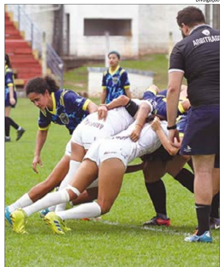
Temporada 2020 do rugby em Mato Grosso será movimentada, com várias competições

Assim como no futebol, o campeonato estadual funciona como uma pré-temporada das competições nacionais, nas quais o Melina, de Cuiabá, tem conquistado destaque. O clube encerrou o ano de 2019 na vice-liderança brasileira, após ter feito uma bela campanha pelo título.