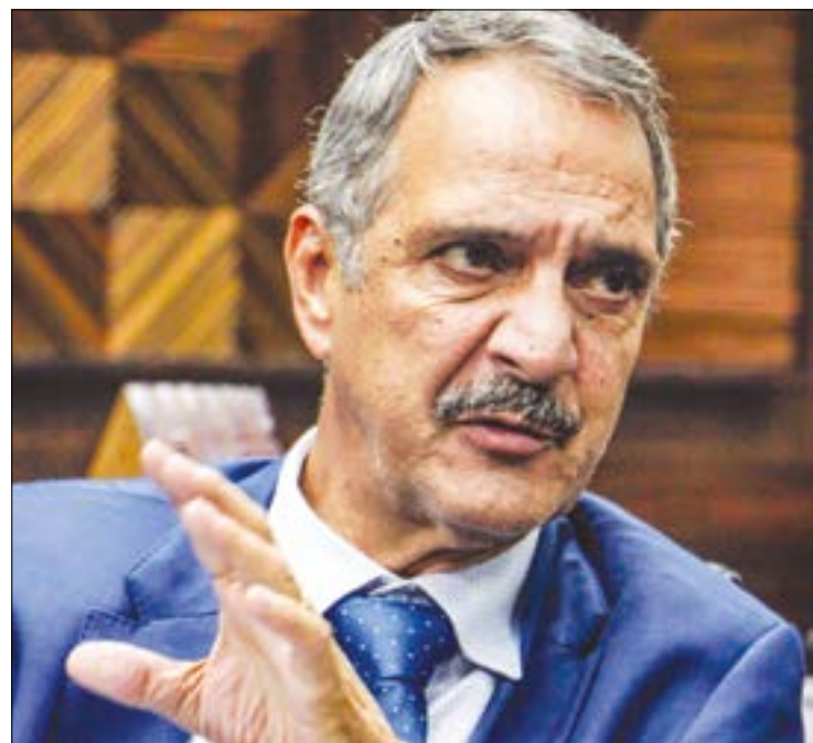
Presidente do TJ quer que juízes e servidores que estiveram em áreas de risco trabalhem em casa