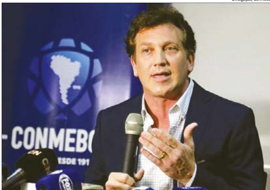
Presidente da Conmebol, Alejandro Dominguez, teme trazer doença junto com jogadores europeus

Pelo planejamento inicial das Eliminatórias,