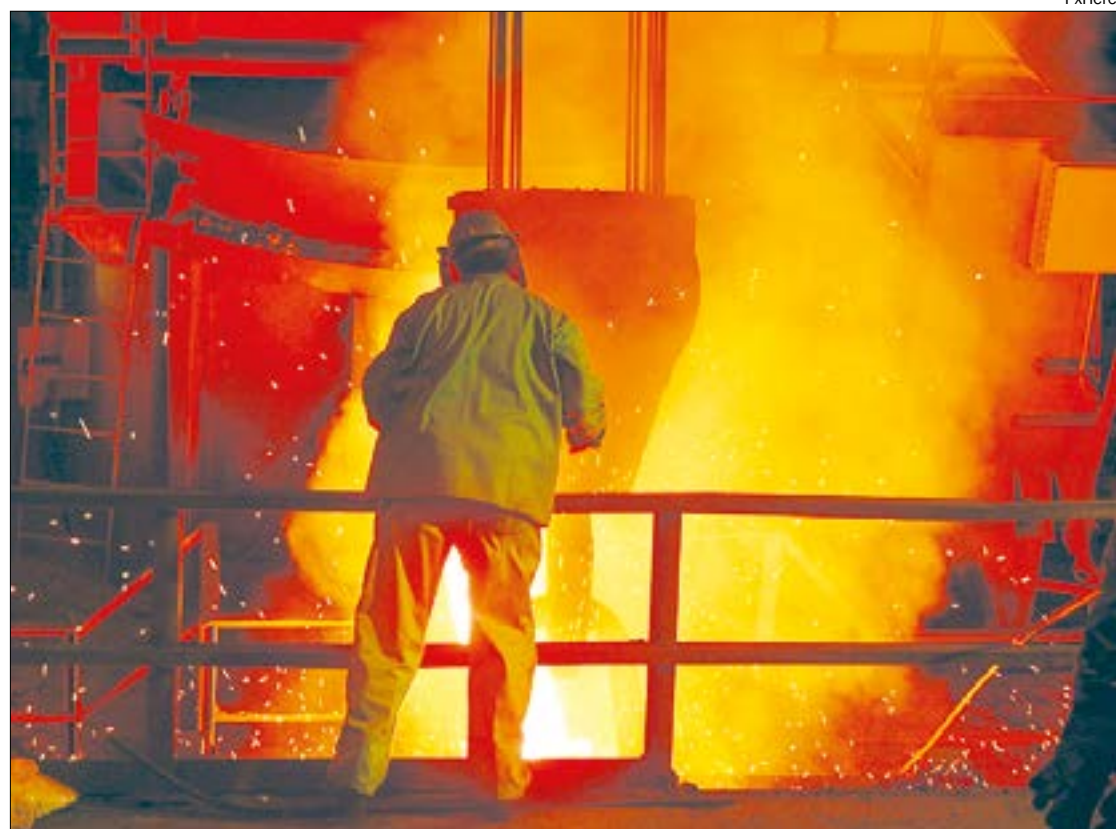
O setor industrial, em janeiro de 2020, voltou a mostrar um quadro de maior ritmo produtivo

Na expansão de 0,9% da atividade industrial na passagem de dezembro de 2019 para janeiro de 2020, houve altas em três das quatro grandes categorias econômicas e 17 dos 26 ramos pesquisados. Entre as atividades, as influências positivas mais importantes foram de máquinas e equipamentos (11,5%), veículos automotores, reboques e carrocerias (4,0%), metalurgia (6,1%), produtos alimentícios (1,6%) e coque, produtos derivados do petróleo e biocombustíveis (2,3%).