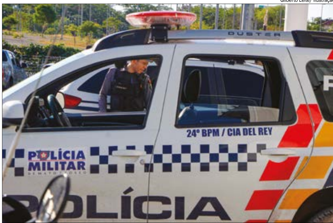
Gilberto Leite/ Ilustração

A vítima informou que os criminosos em seguida o levaram para um mata-gal, onde foi novamente agredido. Os agressores falaram que eram membros de uma facção e que o irmão do adolescente teria furtado droga e que por isso ele estaria levando o "salve".