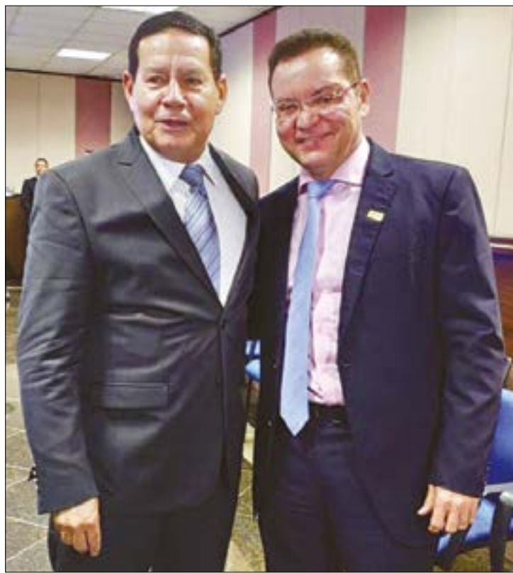
O presidente da Assembleia Legislativa, deputado estadual Eduardo Botelho, e o vice-presidente da República, Hamilton Mourão, em sua passagem por Cuiabá

O Evento Contos do Mato chega à sua 3ª edição e promete movimentar a capital entre 24 e 29 de março. Com o nome Arena Literária 300 Anos, o projeto foi pensado por um grupo de artistas e escritores de Cuiabá, acolhendo em sua programação as atividades relacionadas à difusão do livro e da leitura. A participação do público será totalmente gratuita e a programação conta com rodas de conversa, palestra, Oficina de Escrita Criativa, batalha de poesias, show musical, noite de autógrafos com escritores convidados, sessões de contação de histórias, piquenique literário, teatro lambe-lambe e o Cantinho do Livro e da Leitura. Além das atividades que acontecem no prédio do Palácio da Instrução, algumas mesas acontecerão de forma descentralizada, indo até escolas de Cuiabá.