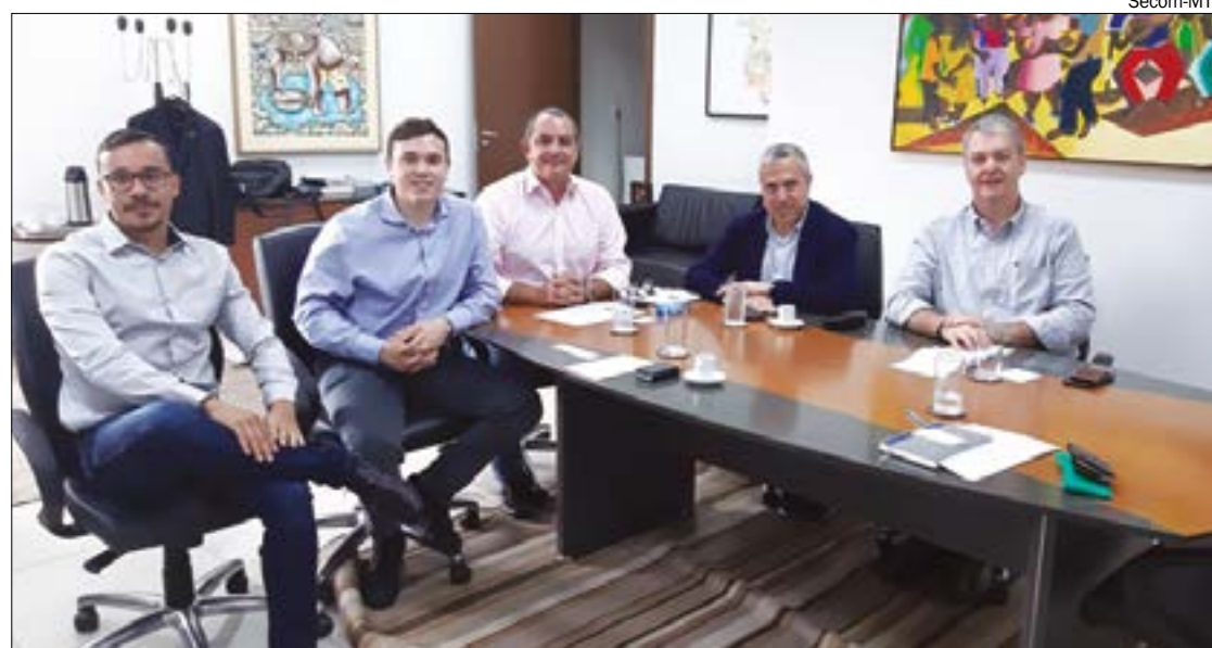
Empresários da Catalunha buscam opções de investimentos em Mato Grosso

Neste sorteio participaram 229.772 mil pessoas que pediram o CPF na nota, nas compras realizadas entre os dias 1 e 29 de fevereiro. Ao todo, foram gerados 1.816.664 bilhetes eletrônicos. O concurso foi realizado a partir do resultado da Loteria Federal de quarta (11).