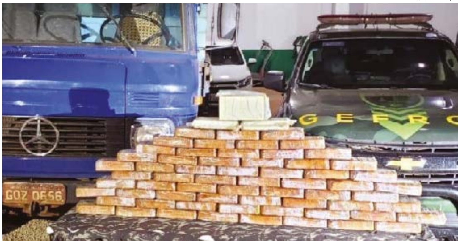
Gefron e Defron/ MT

Em Vila Bela da Santíssima Trindade, foi realizada a revista em um veículo Mercedes-Benz dirigido por um suspeito. Na busca, foram encontrados 63 tabletes de substância análoga a pasta-base de cocaína e três tabletes de substância análoga