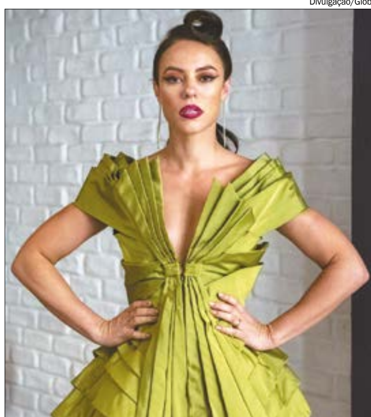
Paolla Oliveira vai ajudar anônimas a se vestirem igual às celebridades

Paolla e a produção do programa visitarão as casas das celebridades para explorar seus armários e pegar o look emprestado. Na sequência, a participante desconhecida passará por uma transformação e receberá conselhos por vídeo da celebridade que a inspirou.