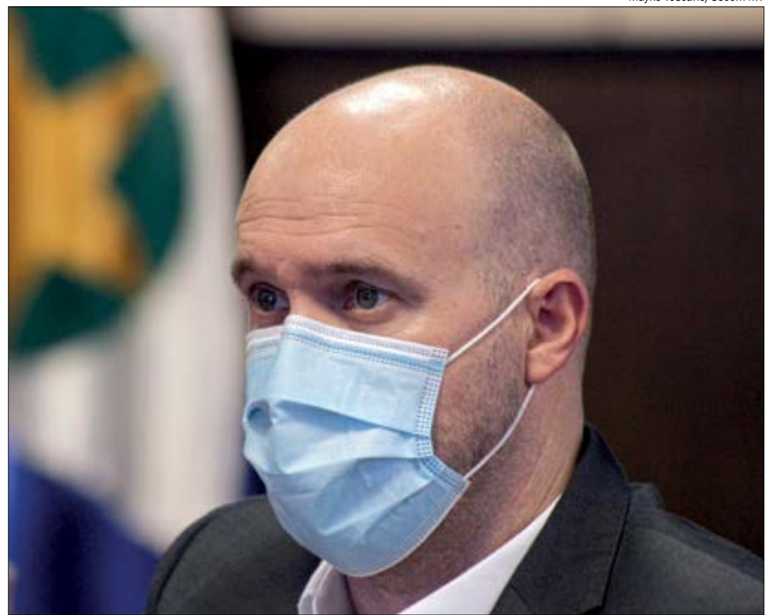
Secretário de Esportes diz que jogos poderão continuar em MT, desde que atendam o toque de recolher

São Paulo está com a taxa de ocupação dos leitos de UTIs em 83%. Em Mato Grosso, a taxa de ocupação está em 96% para UTIs adulto e em 61% para enfermarias.