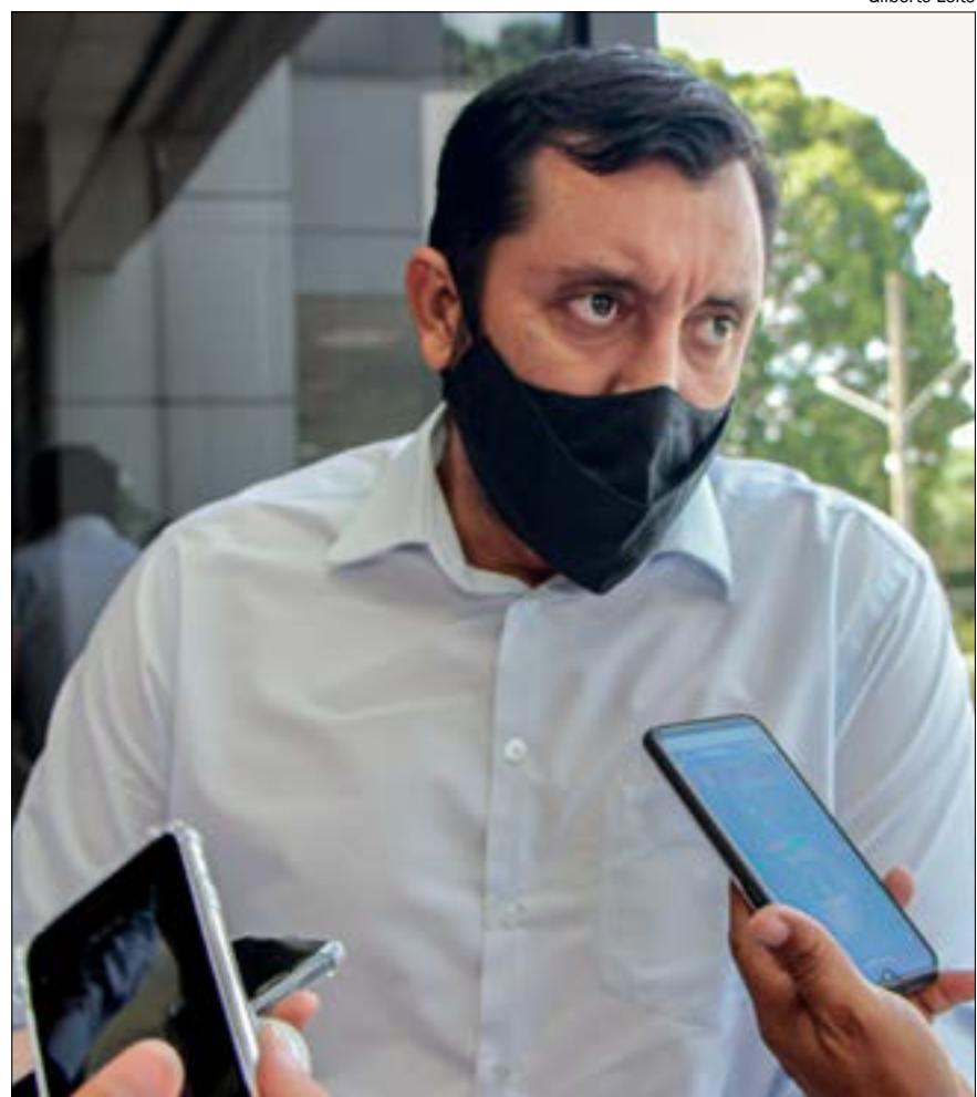
Kardec quer mobilizar os deputados para retomar e concluir a CPI da Energisa