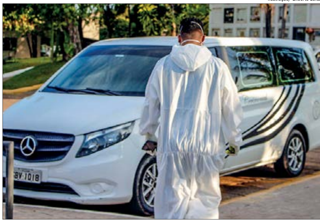
Covid-19 devasta família matando pai, mãe e filho em apenas cinco dias após complicações

- Lavar as mãos frequentemente com água e sabão por pelo menos 20 segundos. Se não houver água e sabão, usar um de-