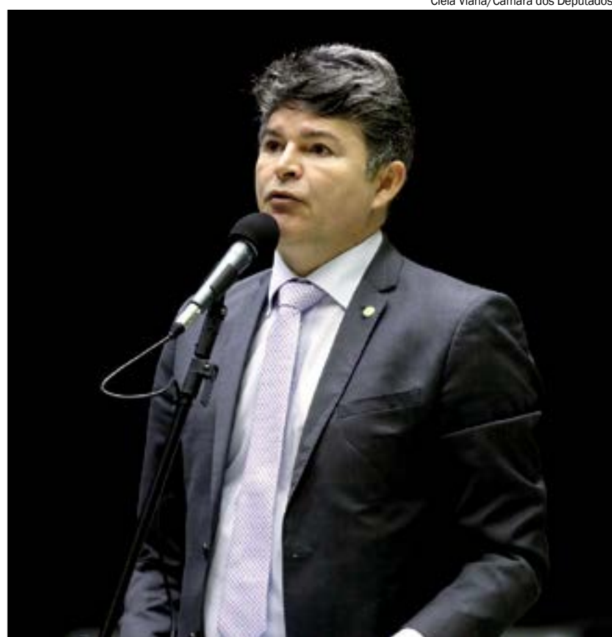
Medeiros quer mudar a Constituição para criar 'contenções' para o Supremo

Na avaliação de Moraes, o vídeo de Silveira atenta contra o Estado Democrático de Direito.