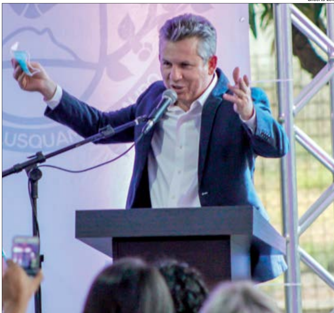
Mauro quer garantia de que Pazuello não irá confiscar vacinas compradas por Mato Grosso

"Estou tentando hoje contato com o ministro para dizer que conseguimos, estamos em tratativas aí razoavelmente avançadas para Mato Grosso comprar 1,5 milhão de vacinas. Eu tenho dito isso a vocês, nós esta-