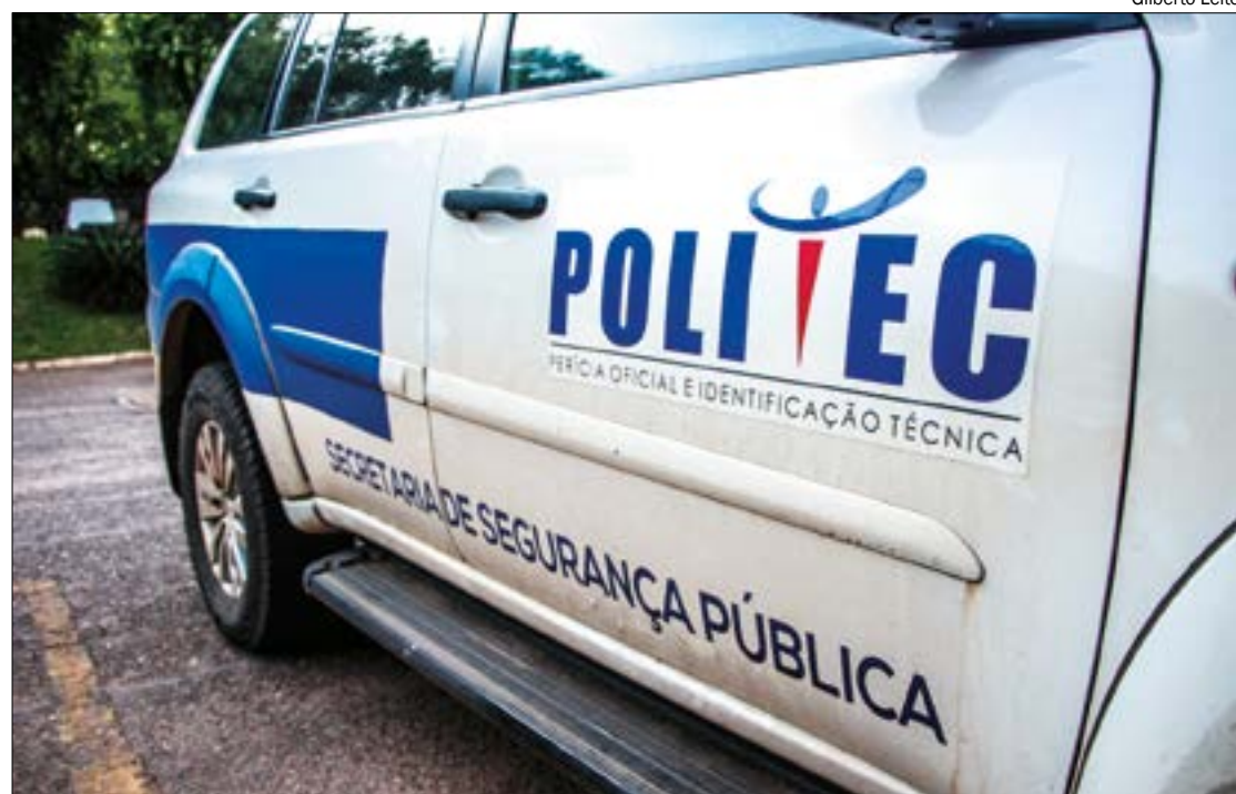
A mulher foi morta por assaltantes que invadiram sua residência em Nova Canaã do Norte