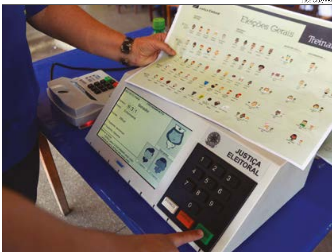
TSE reafirmou confiar “absolutamente na segurança do sistema eletrônico de votação” e que qualquer suspeita de fraude será apurada com rigor

Naturalmente, existindo qualquer elemento de prova que sugira algo irregular, o TSE agirá com presteza e transparência para investigar o fato. Mas cabe reiterar: o sistema brasileiro de votação e apuração é reconhecido