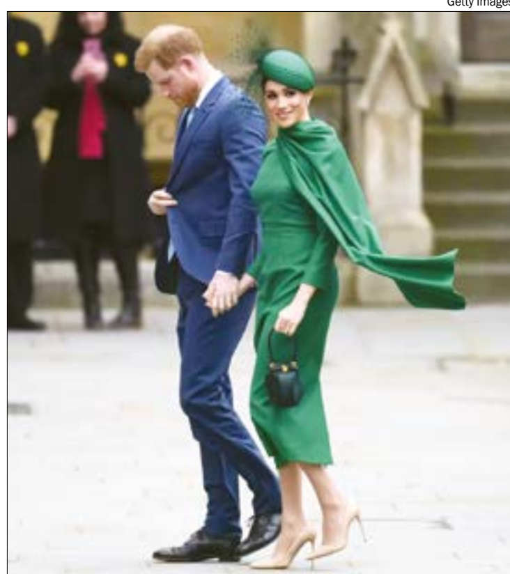
Harry e Meghan participaram de seu último evento real nesta segunda

O príncipe, que serviu duas vezes como soldado no Afeganistão, também teve que abandonar seus deveres oficiais no exército.