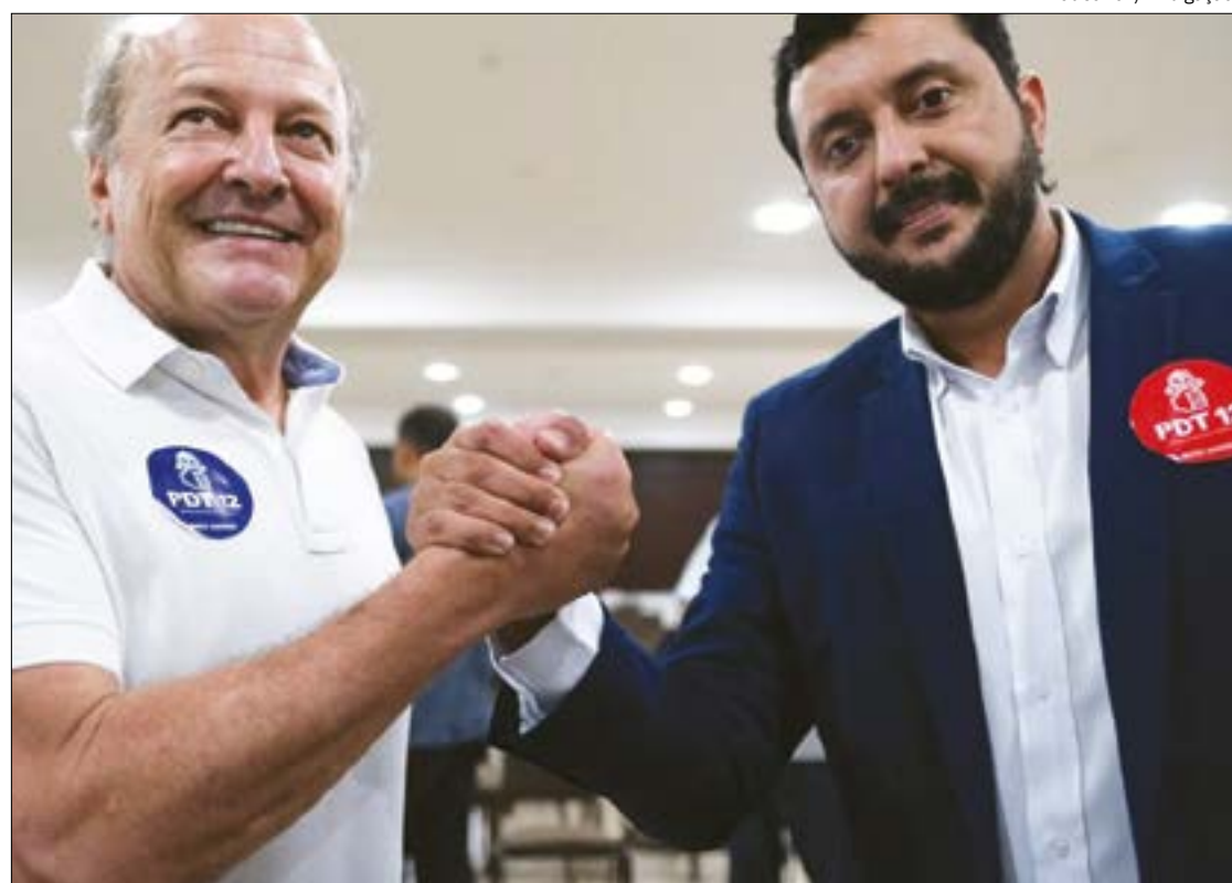
Pivetta é o candidato do PDT para ocupar a vaga deixada por Selma Arruda

“Estamos conversando. Todo caminho é para