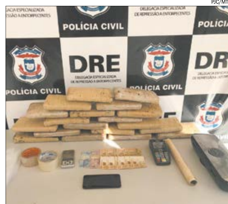
Dois homens foram presos pelos crimes de tráfico de drogas e associação para o tráfico

Então os investigadores passaram a vigiar o endereço, onde na tarde de segunda-feira (9) foi avistado o momento que dois indivíduos saíram do imóvel em atitude suspeita, carregando uma sacola grande em direção a um veículo Sandero de cor branca.