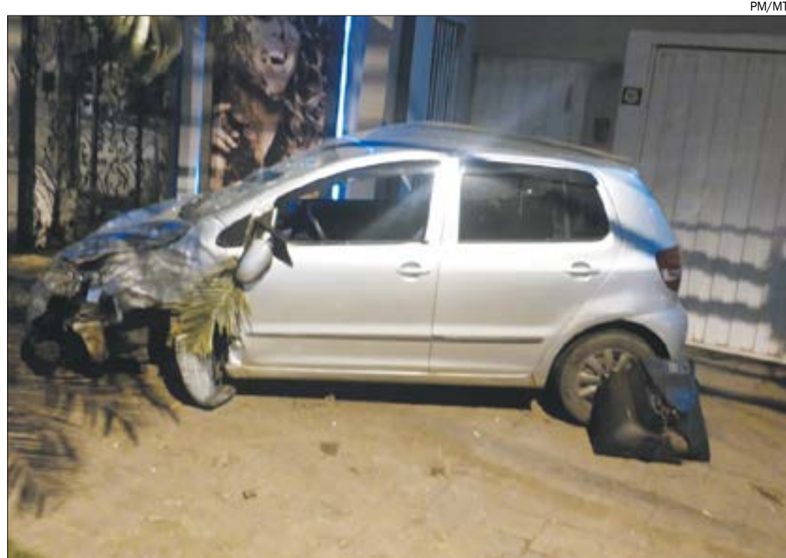
Vítima relatou à polícia que o ex-namorado a arrastou para dentro do carro e jogou o veículo contra um poste na tentativa de matá-la