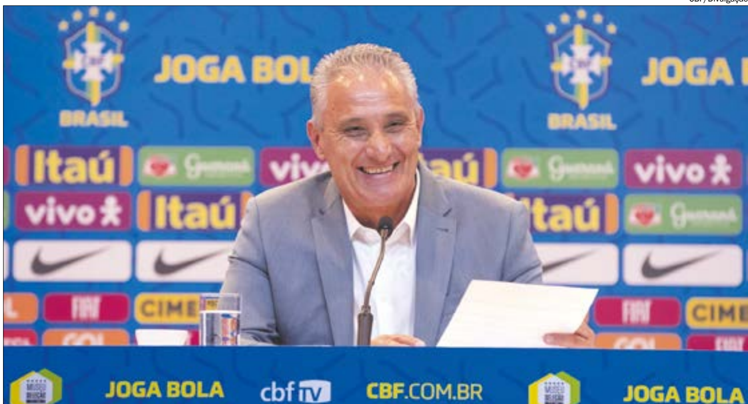
Tite quer ter apoio do torcedor na estreia do Brasil nas Eliminatórias da Copa

O valor dos passaportes para o jogo contra a Bolívia varia de R$ 40 (meia-entrada para o setor superior) a R$ 400 (inteira para o camarote com serviço). Depois da primeira partida, a seleção brasileira enfrenta o Peru, no estádio Nacional de Lima, no dia 31 de março.