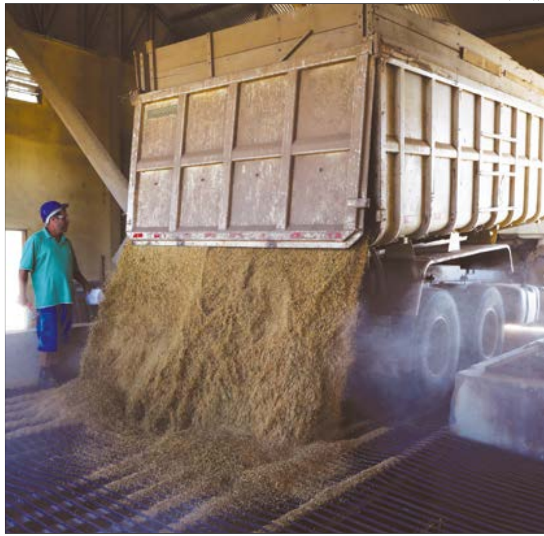
Exportações para a China devem diminuir devido ao arrefecimento da economia asiática