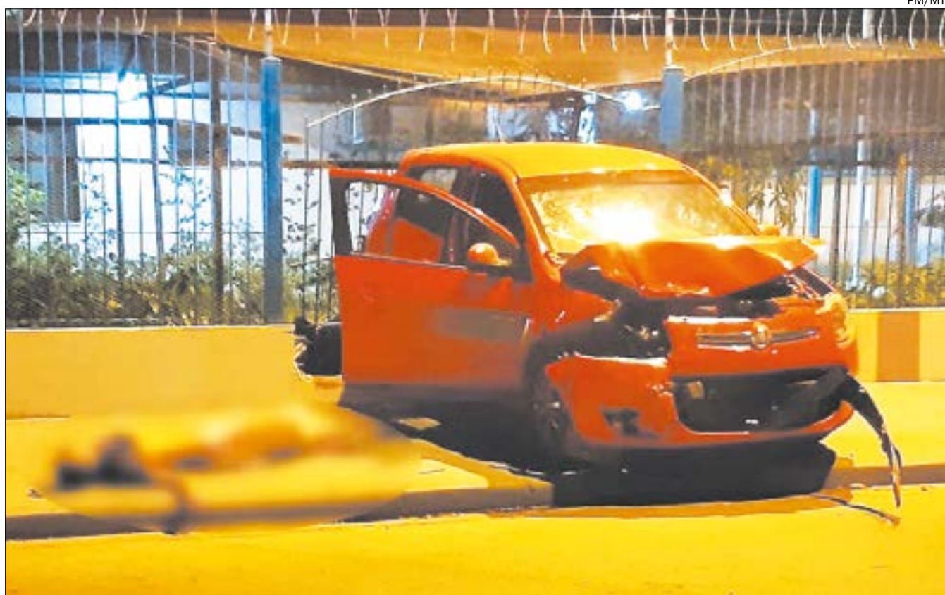
Dupla tentou assaltar uma mulher que voltava para casa com os filhos; um dos bandidos foi morto pela polícia durante a fuga

O Samu confirmou a morte de um dos suspeitos. Na mochila dele foi encontrado um bloqueador de sinal (utilizado para roubos de carros) e ferramentas para a desmontagem do veículo. As armas e outros materiais encontrados, e que não eram das vítimas, foram levados pelos policiais como prova do crime.