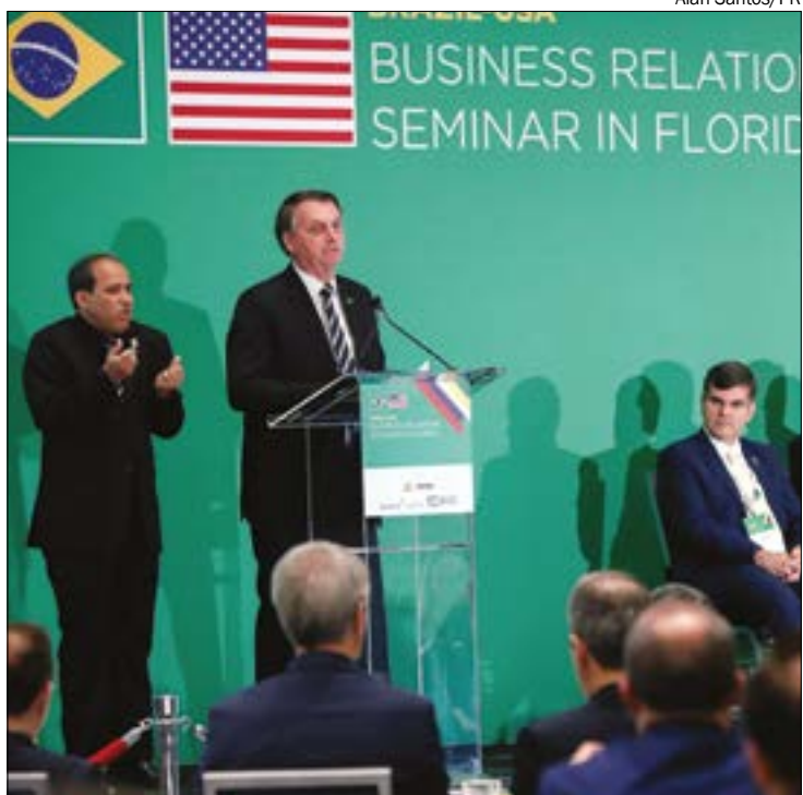
Presidente Jair Bolsonaro negou que haja crise e culpou a imprensa pelas informações “fantasiosas” sobre o coronavírus

A segunda-feira foi caótica para os mercados financeiros, com a disseminação do coronavírus e a violenta queda nos pre-