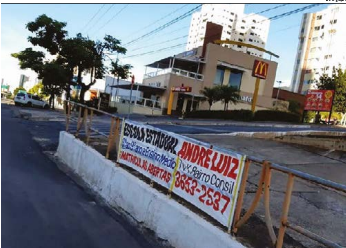
A Escola André Luiz, na capital, divulga as vagas através de faixas espalhadas pela Avenida Historiador Rubens de Mendonça (CPA)

Conforme o gestor, a unidade escolar é uma das melhores do estado, pois é a segunda colocada no ranking do Enem. Além disso, cerca de 70% dos alunos que concluem o ensino médio conseguem vagas em instituições públicas de ensino superior ou particulares.