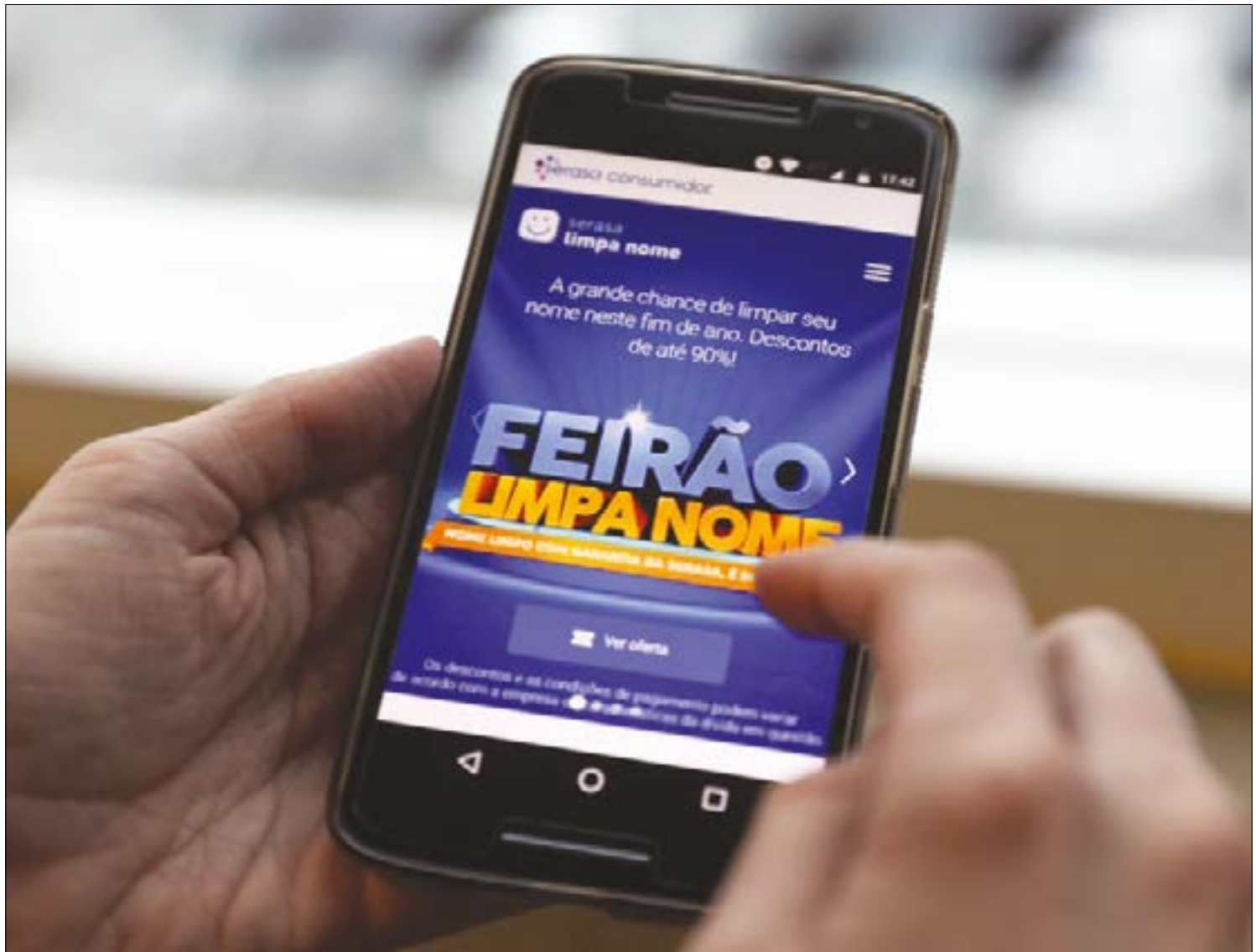
Os devedores podem pedir a renegociação no site ou no aplicativo Serasa Consumidor, disponível para os dispositivos dos sistemas iOS, da Apple, e Android, do Google

NOVIDADE - O feirão deste ano tem uma novidade: pela primeira vez, será permitida a renegociação de débitos para microempresários e microempresários. Ao rastrear o Cadastro de Pessoas Físicas (CPF), o sistema verifica se há débitos num Cadastro Nacional da Pessoa Jurídica no mesmo nome.