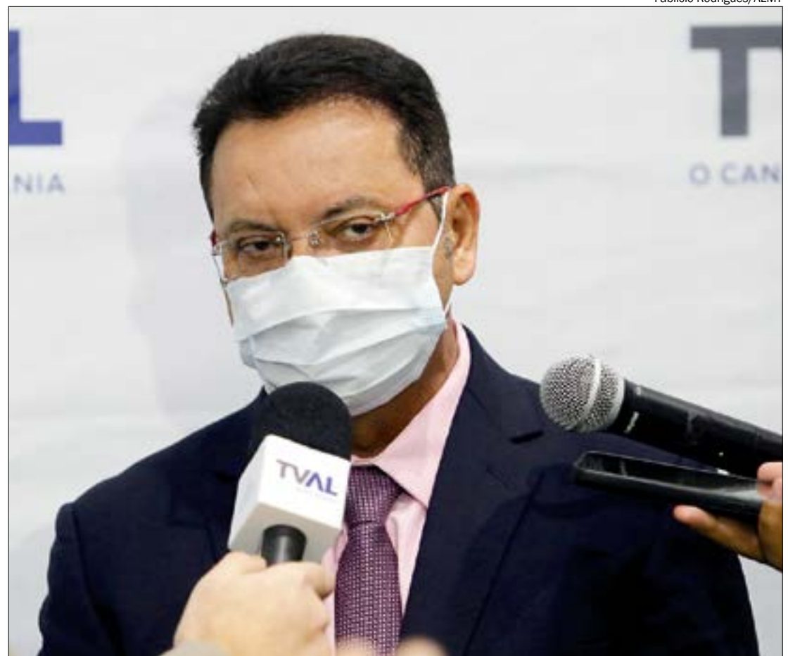
Eduardo Botelho disse que proposta do governo é sem sentido e dificilmente será aceita

O ministro da Economia, Paulo Guedes, revelou ainda que o governo pretende desonerar o PIS/Cofins como medida alternativa para impulsionar a queda dos preços dos