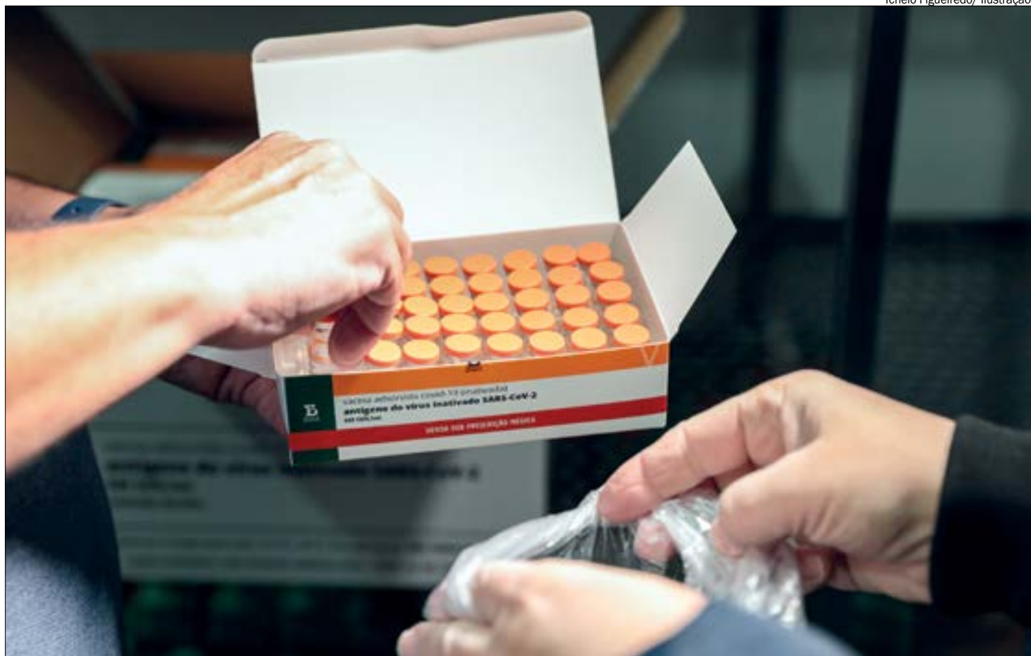
Tchélo Figueiredo/ Ilustração

"A população indígena a ser vacinada em Mato Grosso é de 28.758 pessoas, conforme estimativa do próprio Ministério da Saúde. Por essa razão, 57,5 mil doses são destinadas exclusivamente a