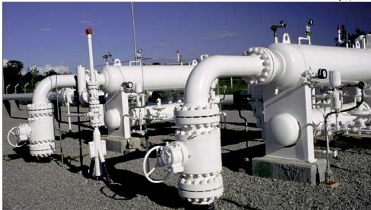
Abastecimento de gás para indústrias de Mato Grosso volta ao normal a partir da próxima segunda (8)