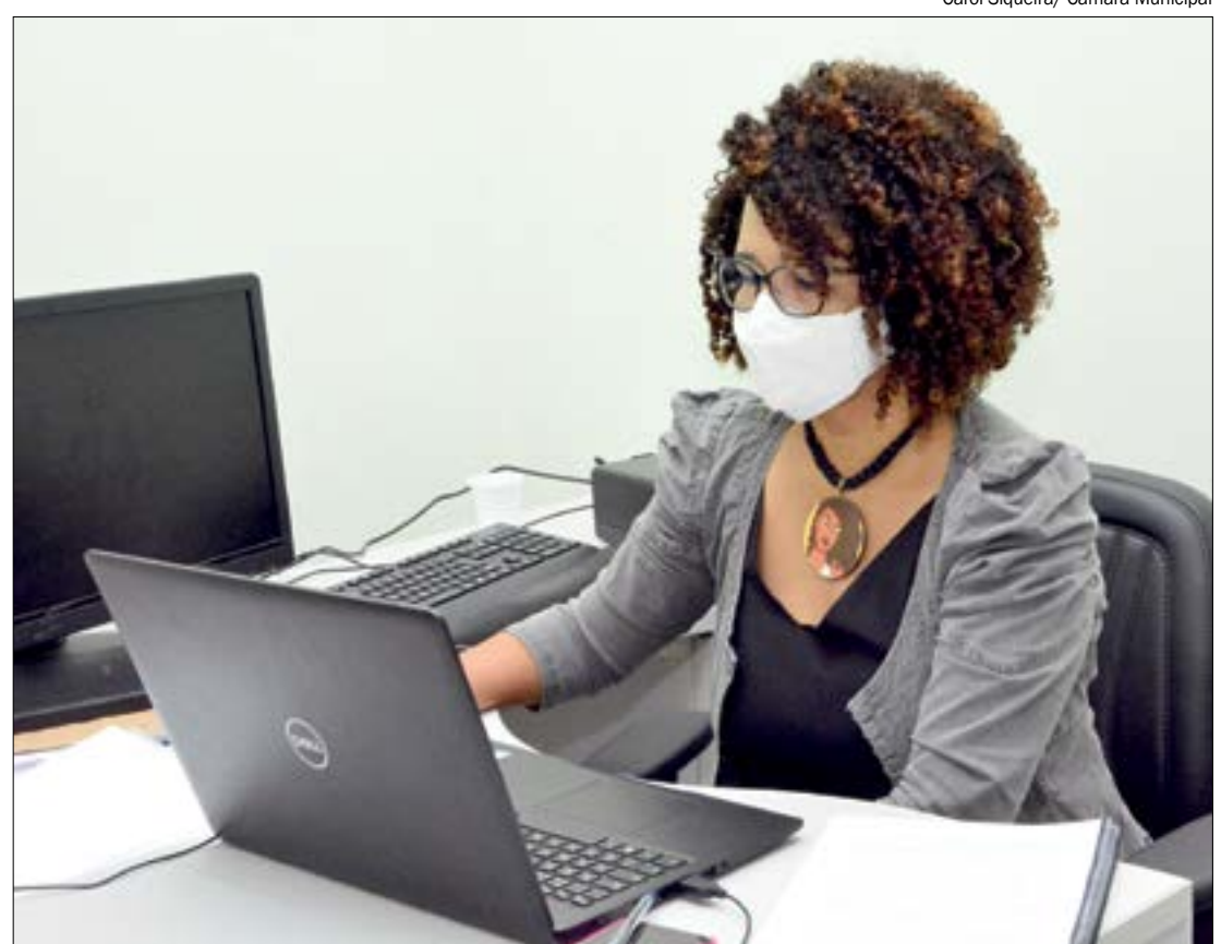
Carol Siqueira / Câmara Municipal

“Eu sou de uma perspectiva que não faz política com base e interesses fisiologistas e o PT não tem como prática a política fisiologista e defendemos o PT com independência do Poder Executivo, que faça uma oposição qualificada, consequente e não espetacular. Uma oposição à esquerda defendendo projetos que defendem a população”, reforçou a vereadora.