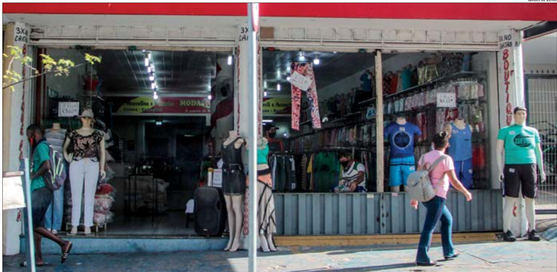
Com a possibilidade de não estenderem o auxílio emergencial, empresários acreditam que o ano será mais amargo em 2021