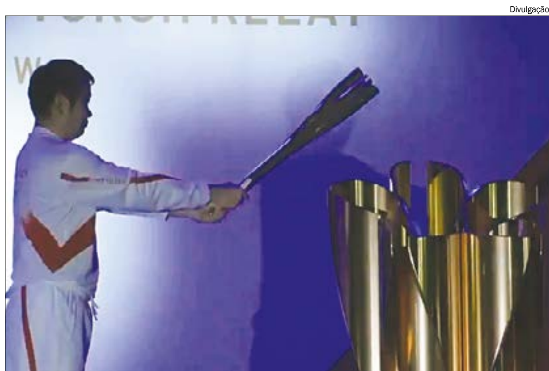
Comitê Olímpico decidiu mudar cerimônia de acendimento da tocha por medo do coronavírus