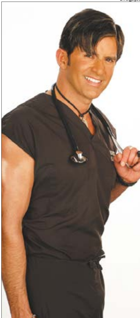
O conceituado médico reconhecido internacionalmente Dr. Rey, que estará em Cuiabá neste domingo, durante a inauguração da Estética Hollywood no Shopping Estação Cuiabá