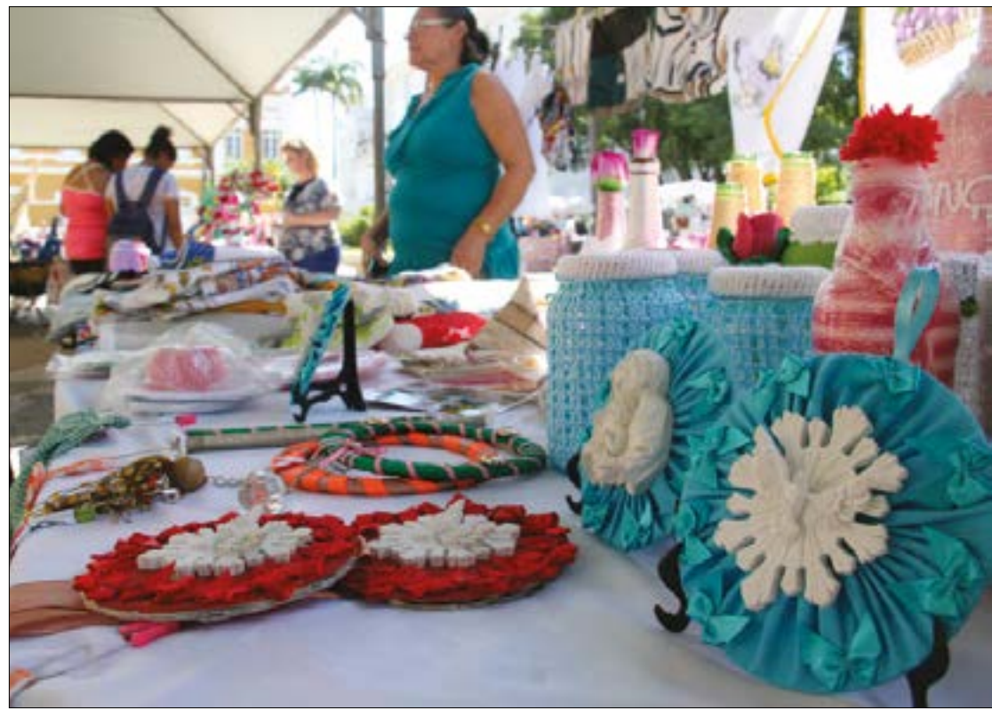
As feiras de artesanato terão duração máxima de 12 horas e serão realizadas nos espaços públicos de Cuiabá, em dias e horários predeterminados pela secretaria

O artesão autorizado assume total responsabilidade pela qualidade, procedência, validade e demais exigências do Código de Defesa do Consumidor em relação aos produtos comercializados. (Com informações da Assessoria de Imprensa)