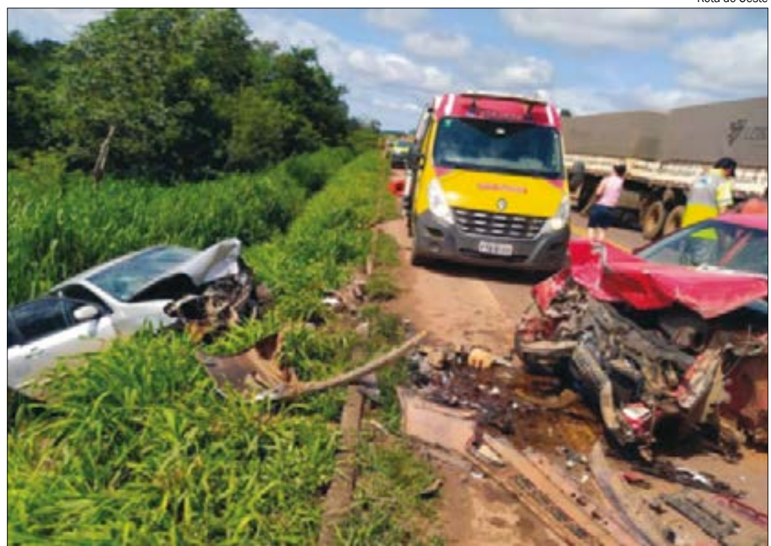
Criança de um ano e seis meses foi a única vítima do acidente envolvendo três veículos na BR-163