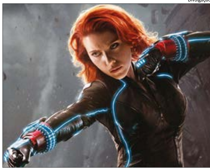
Novo filme vai mostrar um lado da 'Viúva Negra' que os fãs nunca viram

Brilhante como Natasha Romanoff - a Viúva Negra - em toda a série 'Vingadores, da Marvel, Scarlett Johansson precisava apenas de um tempinho para ganhar o filme de sua própria personagem. Agora, ela é a grande estrela de 'Viúva Negra' ('Black Widow'), nova produção da Marvel que está na reta final e ganhou um novo trailer nesta segunda-feira (9). Prepare-se para conhecer a personagem antes dos Vingadores, “um lado da heroína que você nunca viu antes”, segundo a Marvel.