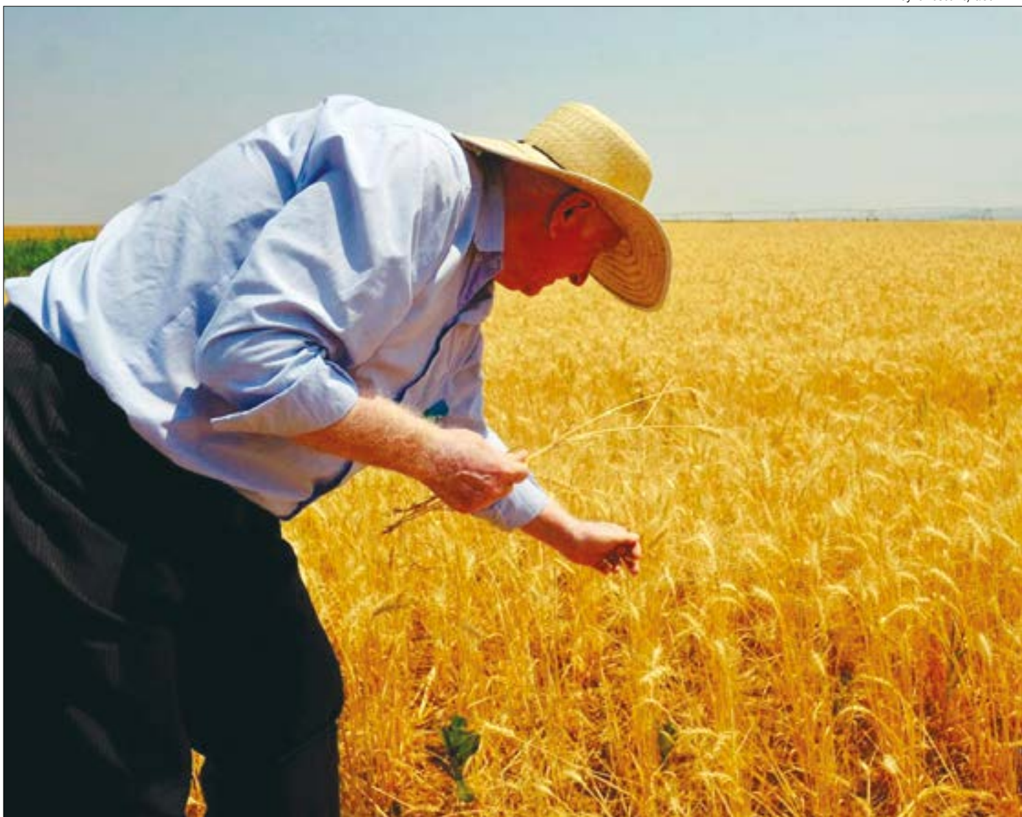
Alta do dólar e falta de trigo no mercado pode até dobrar o preço do pãozinho

O trigo consumido no Brasil é produzido em estados da região Sul do país, como Paraná e Rio Grande do Sul, e na Argentina. O consumo de trigo em Mato Grosso atinge uma média de 15 mil toneladas (t) ao mês.