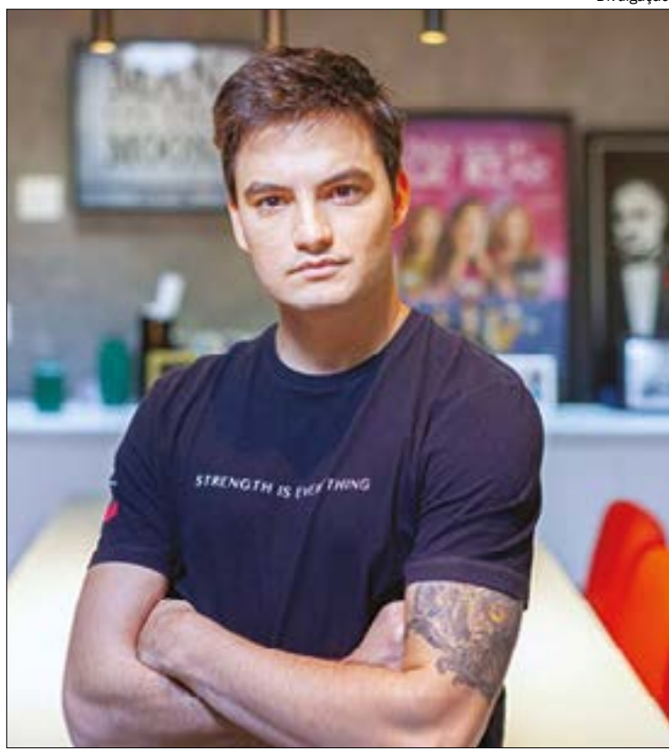
Felipe Neto vai conceder licença maternidade e paternidade ilimitada aos funcionários

Será investido mais de R$ 1 milhão no primeiro ano da empresa apenas com benefícios aos colaboradores. A expectativa é triplicar esse número em 2021, com o crescimento da receita e a abertura de novos negócios.