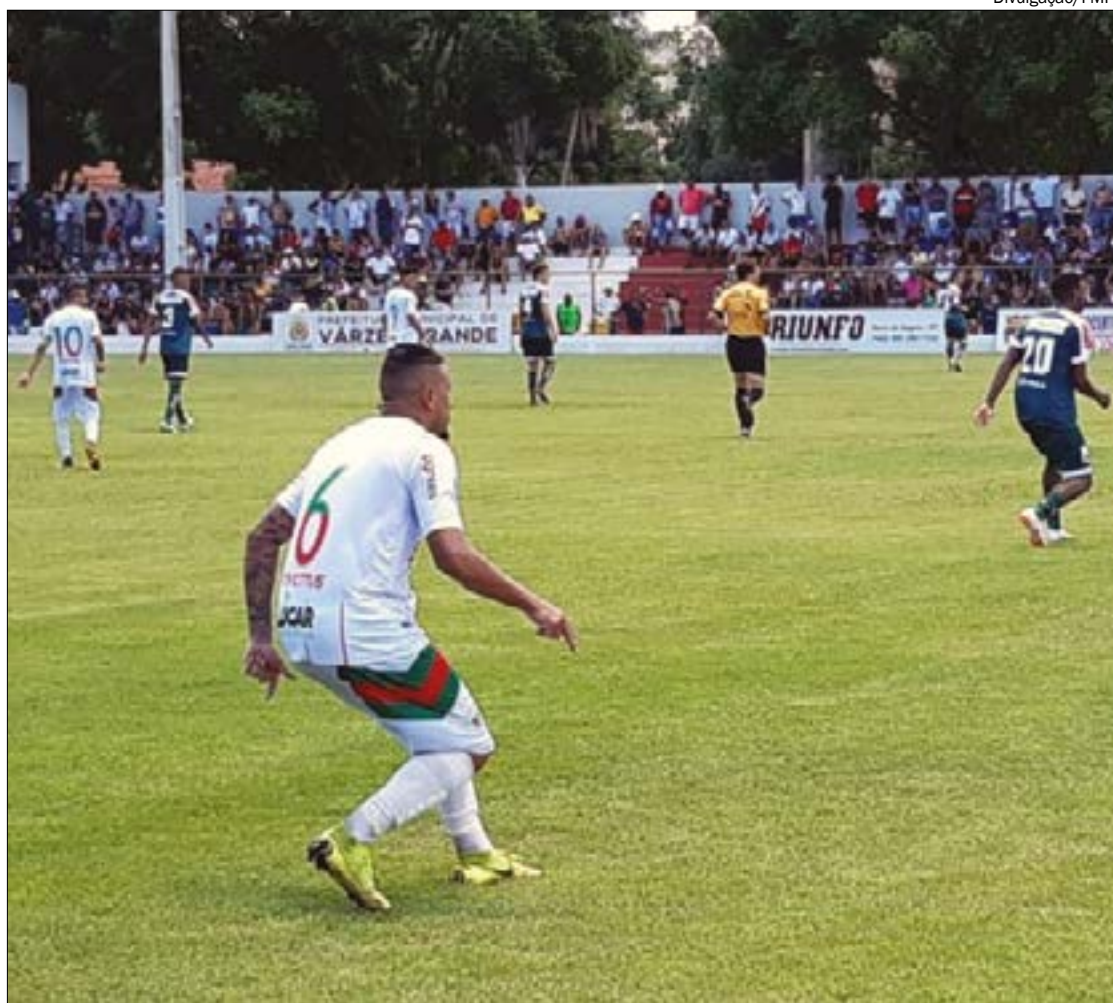
Operário marcou quatro no Luverdense e prolongou o drama do Verdão