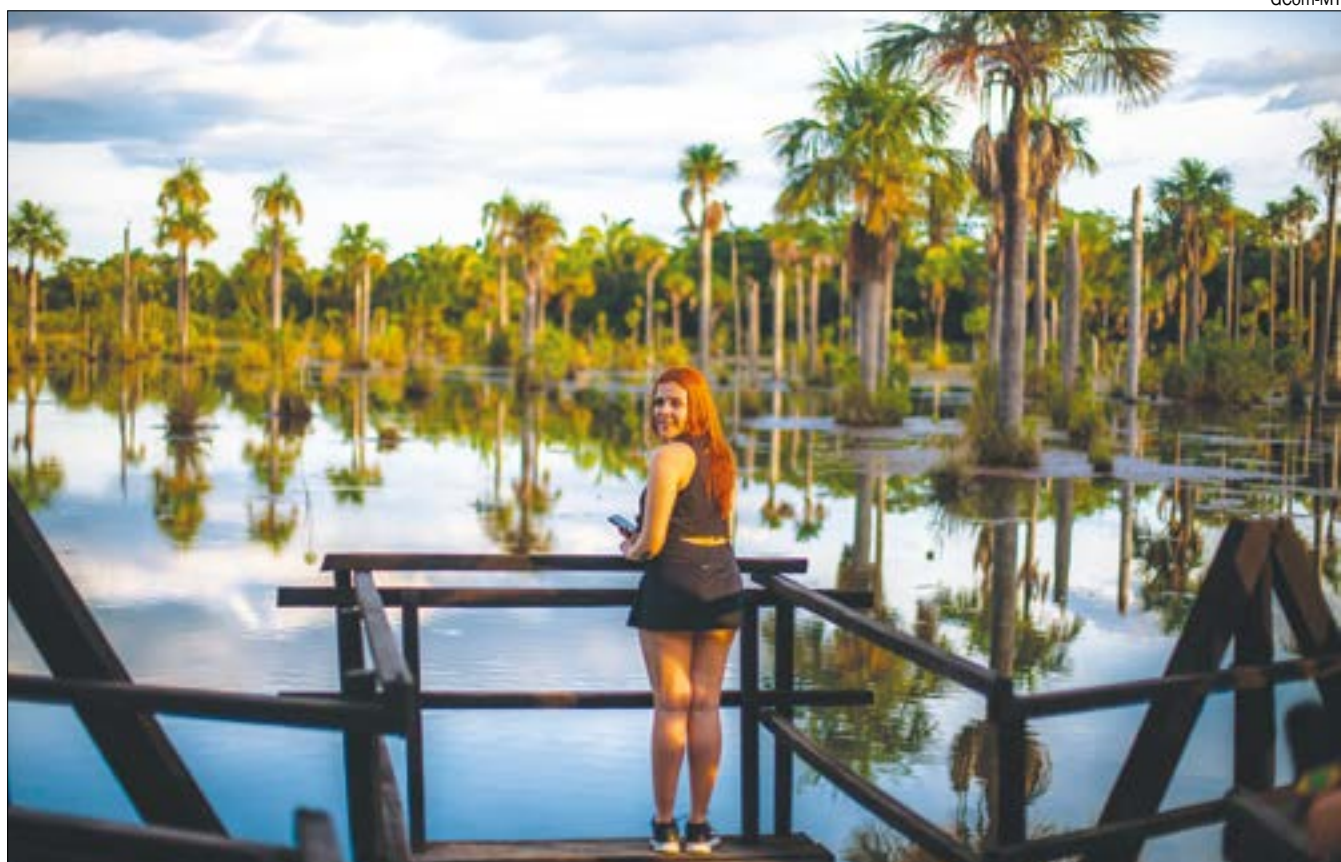
Setor do turismo tem melhor resultado em dois anos

diminuição das contratações foi Transporte de Passageiros, em decorrência das demissões dos modais ferroviário e rodoviário”, explica Antonio Everton, economista da CNC.