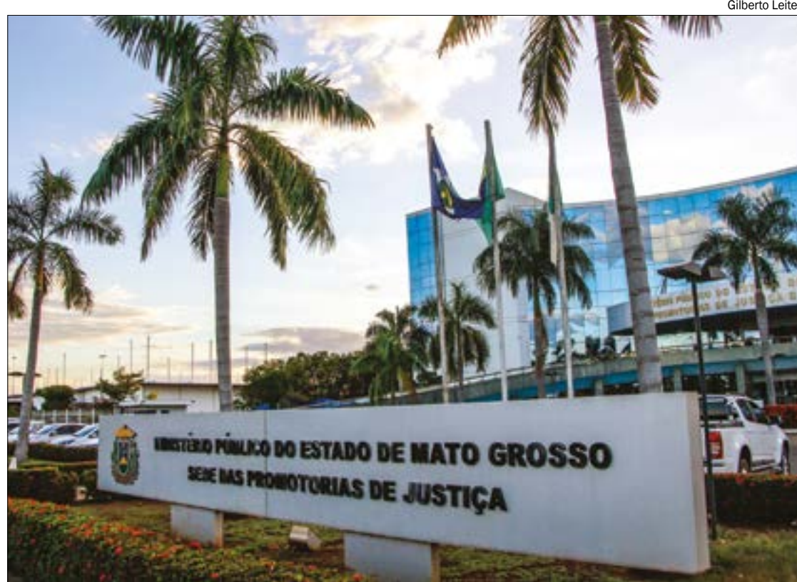
As inscrições são gratuitas e devem ser feitas pessoalmente ou por procurador, até sexta-feira (13)