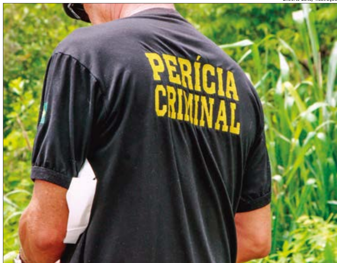
Gilberto Leite/ Ilustração

O corpo de Salvina teve o traslado para Cuiabá nesta segunda-feira (9), onde serão realizados os procedimentos fúnebres.