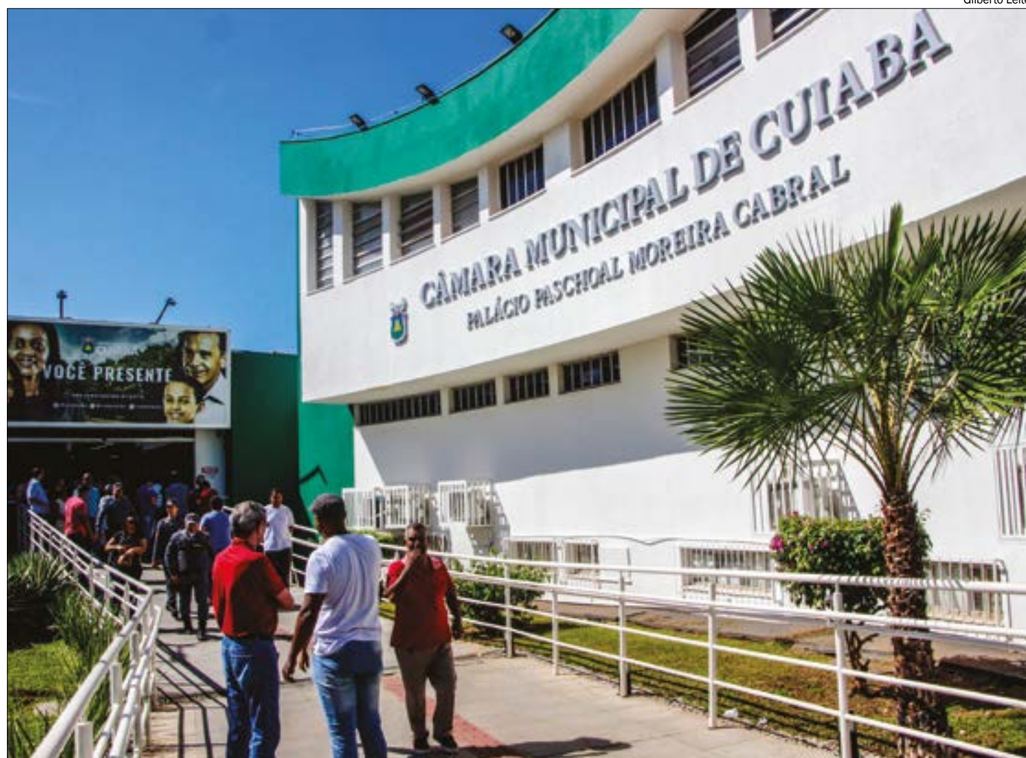
Câmara prepara notificação a suplente de Abílio, que deve assumir em 10 dias

Em uma das frases de efeito proferidas enquanto o sangue ainda estava quente, Abílio afirmou que sua “meta” principal não é permanecer no cargo, uma vez que optou por não ingressar com uma medida jurídica antes mesmo de a votação ocorrer, mas sim realizar um “limpa” na Casa de Leis. O vídeo desse momento se tornou viral nas redes sociais, sendo compartilhado até mesmo por pessoas de outros estados.