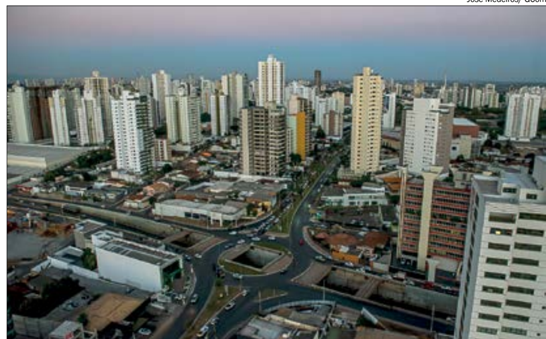
O turismo representou cerca de 15% do total de postos de trabalho gerados em todo o Brasil em 2020

O setor é composto por operadores turísticos e agências de viagem, aluguel e montagem de estruturas para eventos, bares e restaurantes, hospedagem, publicidade e propaganda, segurança privada e serviços gerais e de limpeza.