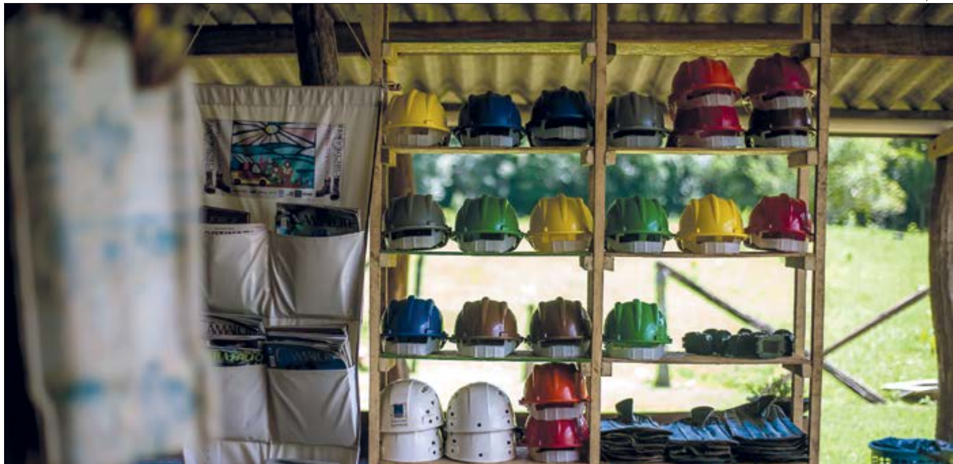
Setor acredita que mesmo sem feriado prolongado em Mato Grosso viajantes busquem por lazer próximo para relaxar

"A tendência já era apontada em 2020 quando começou a pandemia. Ao evitar viagens longas, a opção foi viagens terrestres com carro próprio. O perfil desse público é de