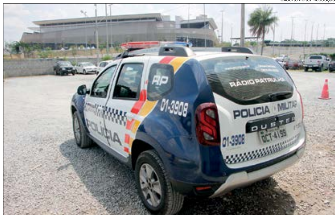
O nono criminoso foi preso pela Polícia Militar que o localizou escondido em uma fazenda

Após a prisão, o pedófilo foi encaminhado à delegacia para formalização do mandado e em seguida foi para a Penitenciária Major Eldo de Sá Corrêa (Mata Grande), onde permanece preso e à disposição da Justiça.