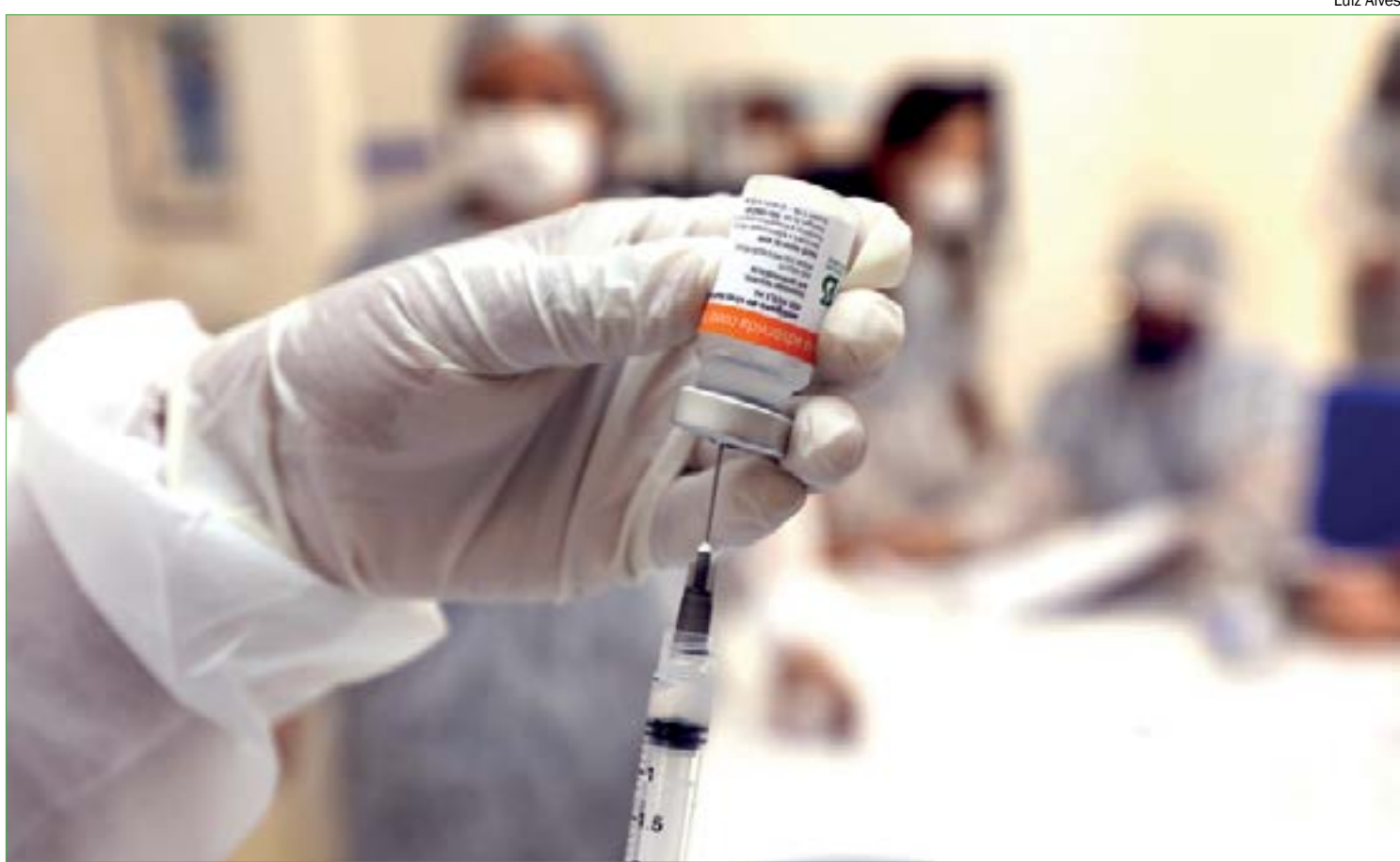
Segunda onda de infecções exigirá a adoção de medidas mais enérgicas para conter o avanço do vírus

O governo não tem contabilizado dados de quantos profissionais de saúde deixaram de se vacinar. Dados da Prefeitura de Cuiabá apontam que, dos 23 mil trabalhadores que deveriam ser imunizados na primeira etapa, apenas 4.691 haviam sido vacinados até a última quarta-feira (27). Nenhum dos órgãos sabe o motivo para a baixa procura.