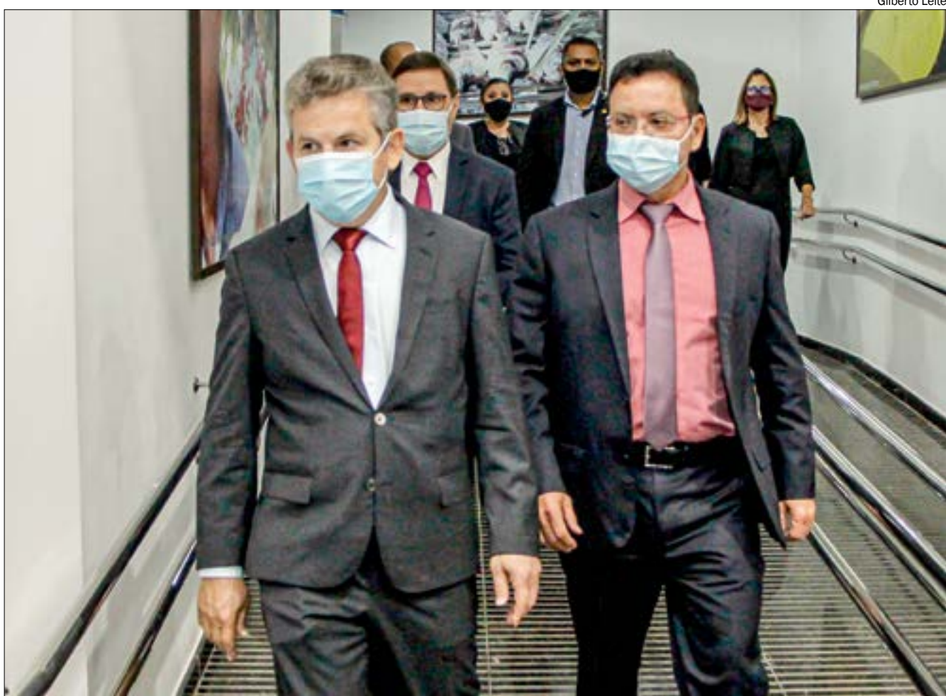
Sessão solene com governador Mauro Mendes na ALMT adia discussões de pautas-bomba para a semana que vem

Ele falou também que o bom relacionamento e parceria com o governo do Estado irão continuar neste biênio, mas que dará voz à oposição e fomentar o debate na Casa de Leis estadual.