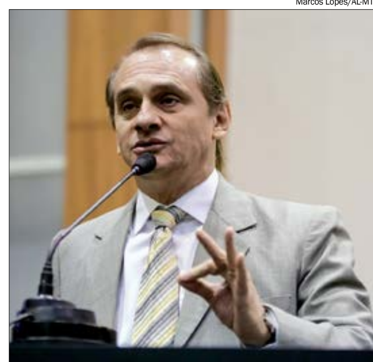
Deputado aponta alíquota progressiva como uma das soluções para dar fim ao déficit da Previdência estadual