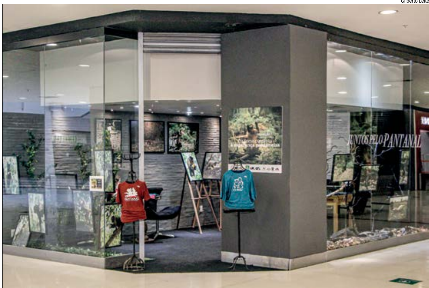
Exposição mostra animais sobreviventes aos incêndios do Pantanal em 2020

* Estagiária sob a supervisão do jornalista Tarley Carvalho