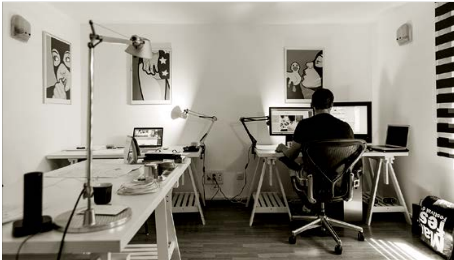
Falta de socialização e comunicação é apontada como um dos principais desafios do home office

“Apesar do sucesso do trabalho remoto, ficou claro que, aplicado isoladamente, este modelo ain-