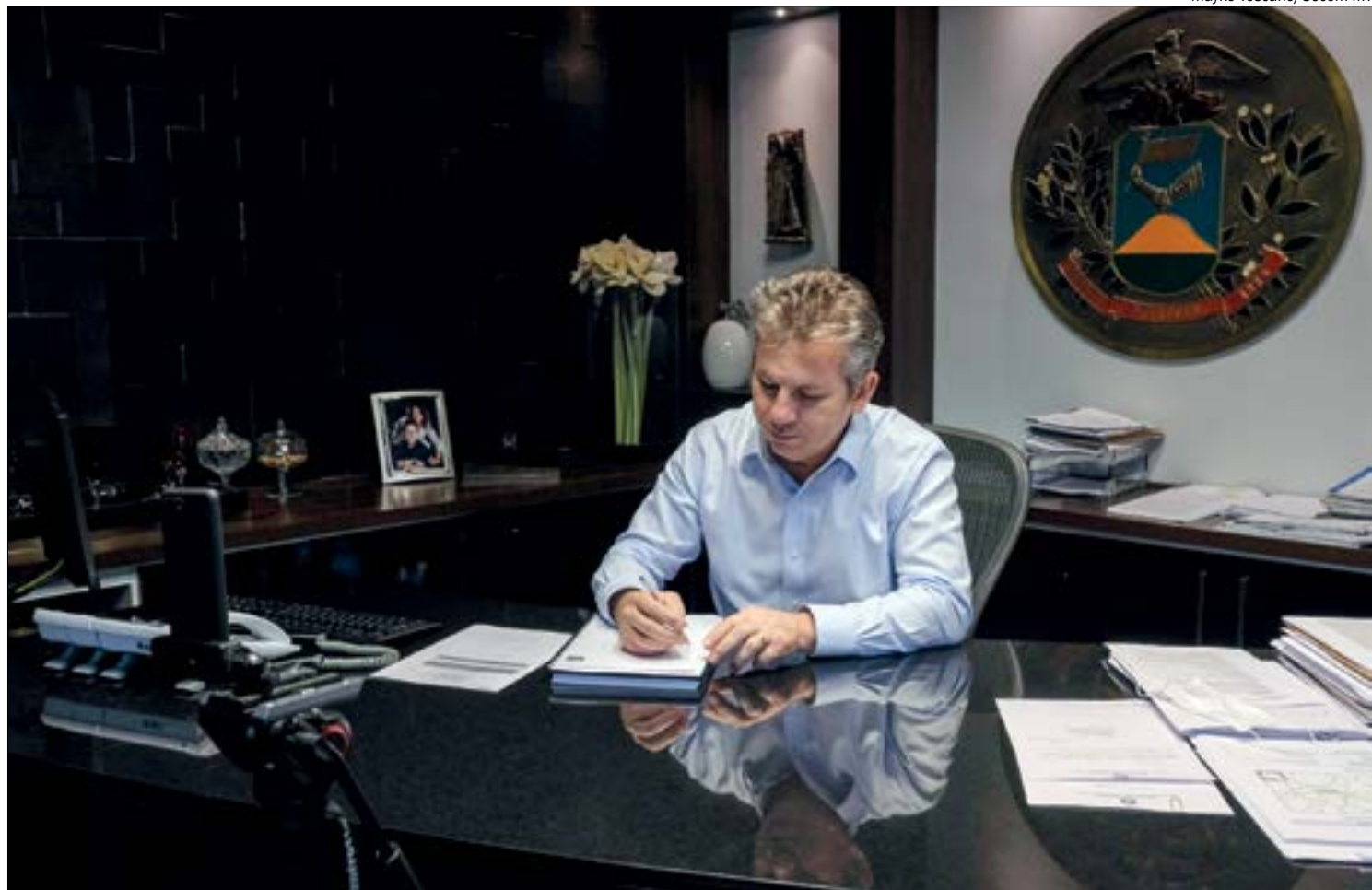
Governador Mauro Mendes sancionou a LOA 2021, mas barrou emendas para Universidade e Segurança Pública

Outra alteração que foi vetada é a transferência de R$ 5 milhões da Comunicação para a Secretaria de Meio Ambiente, proposta pelo