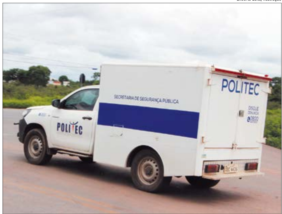
Jaime Cardoso Pinto foi assassinado com um tiro em sua chácara na zona rural de Paranatinga