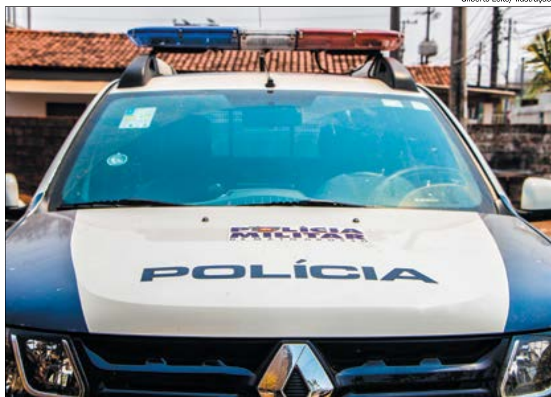
Gilberto Leite/ Ilustração

Segundo a empresa, o veículo deveria ter sido devolvido no dia 18 de outubro do ano passado. Contudo, chegada a data, a devolução não foi feita e nem houve prazo de locação prorrogado pelo locador.