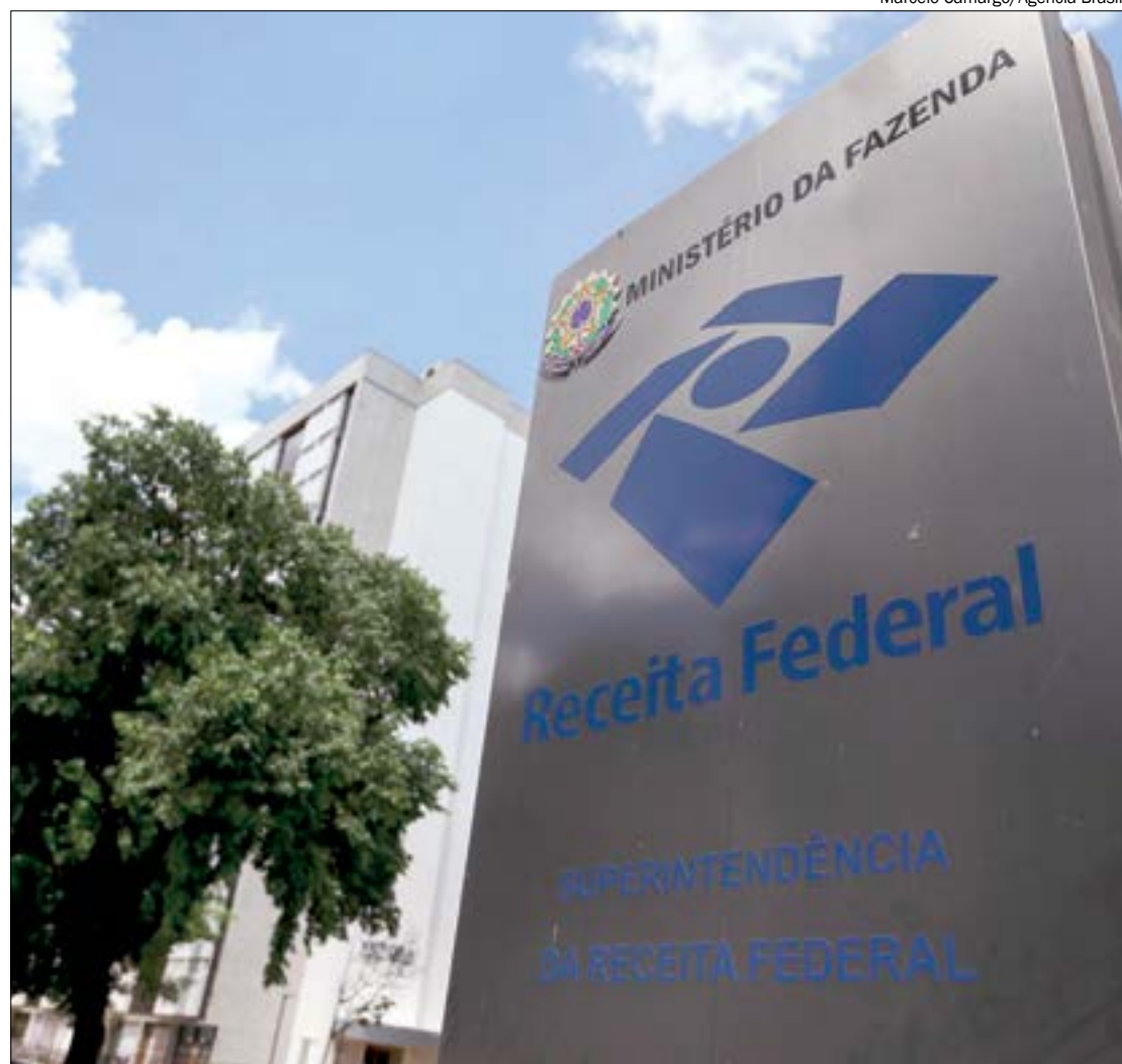
O recolhimento, feito por esse documento único, deve ser pago até o dia 20 do mês