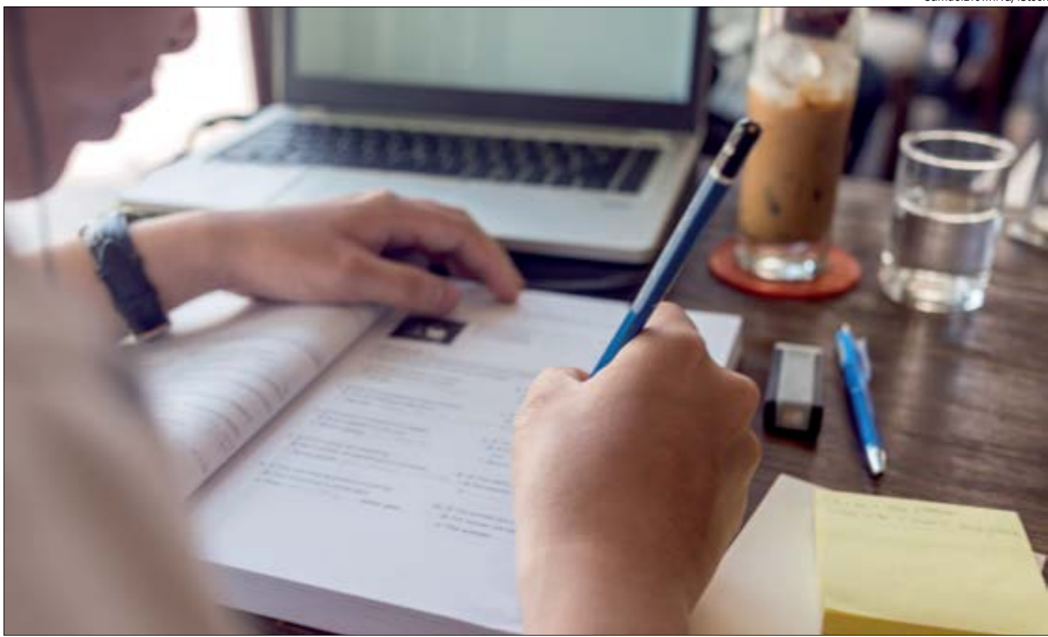
O aumento do medo do desemprego e a redução da renda impulsionaram os cursos de qualificação online

“O cenário de retração econômica foi o responsável pela aceleração deste fenômeno, atraindo em curtíssimo prazo um grande volume de alunos para o modelo EAD. Estima-se que até 2023 a modalidade EAD se equivalha a 64% do mercado de novas matrículas, com volume aproximado 2,56 milhões, enquanto que o