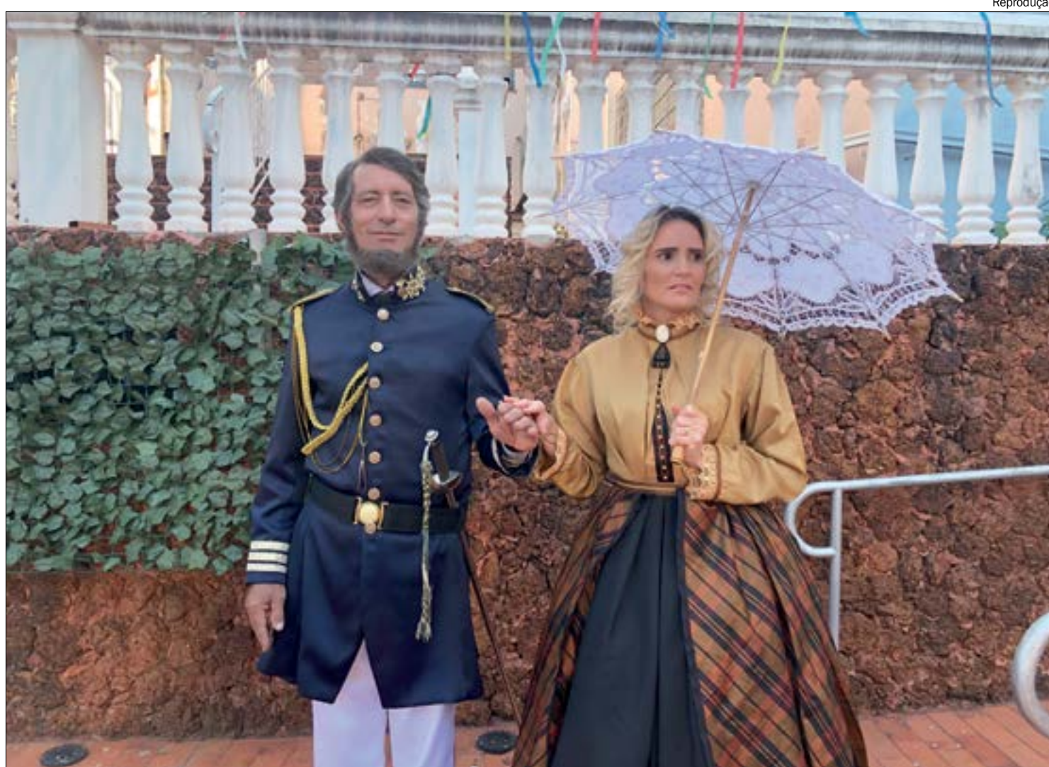
Trabalho integra cinema e animação em uma produção documental em memória aos 140 anos da morte de Augusto Leverger