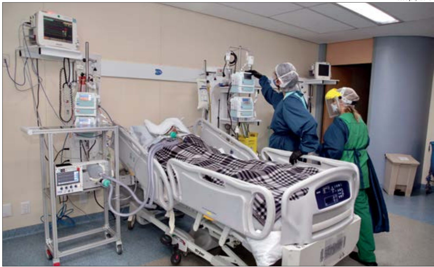
Dos 20 hospitais públicos com leitos de UTI reservados para atender pacientes com covid, 12 estão operando na 'faixa vermelha'

Entre os dias 10 e 16 deste mês de janeiro foram registrados 8.236 novos casos de covid-19, maior número de novos casos desde a semana 36,