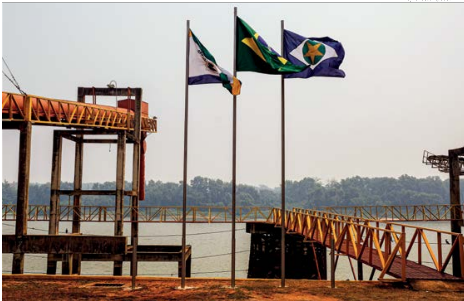
Decisão judicial suspendeu a licença de operação do porto de Cáceres põe em risco abertura da ZPE

"A própria decisão é um pouco confusa. Ela mistura empreendimentos que estão sendo construídos [Porto do Barranco Vermelho e Terminal Portuário Paratudal], que ainda tramita as licenças, e coloca