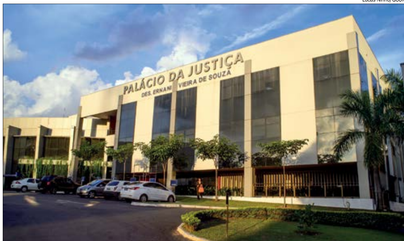
Com a negativa da Justiça, a adolescente permanecerá internada no Centro de Ressocialização Menina Moça

O pai responde por omissão de cautela na guarda de arma de fogo, já que teria obrigação de guardar as armas em local seguro. Já o adolescente responde por ato infracional análogo ao porte ilegal de arma de fogo, porque transitou armado sem autorização.