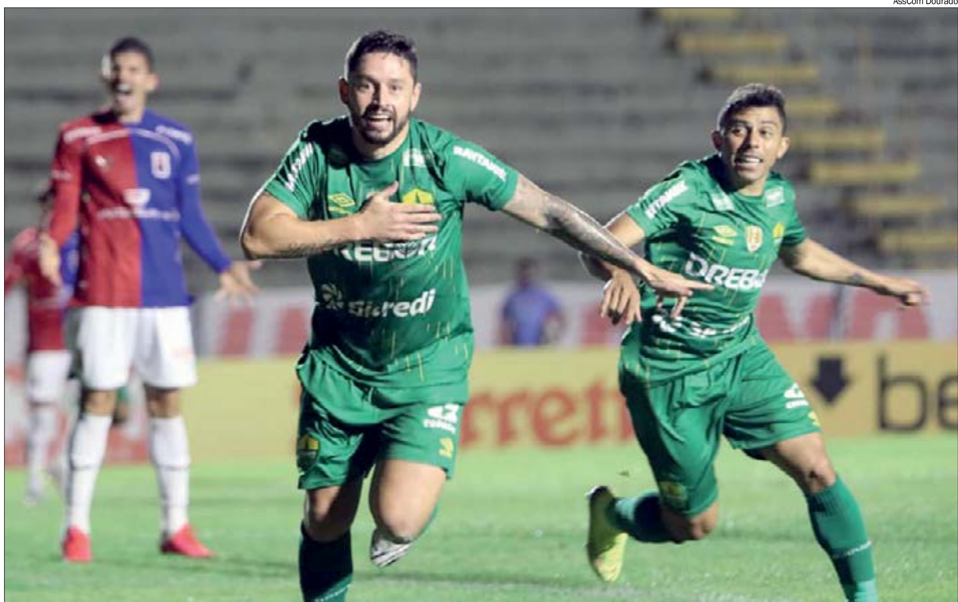
Com apenas 20 anos de existência, Cuiabá é o 'caçula' da Série A do Brasileiro

A temporada de 2020 começou muito bem para