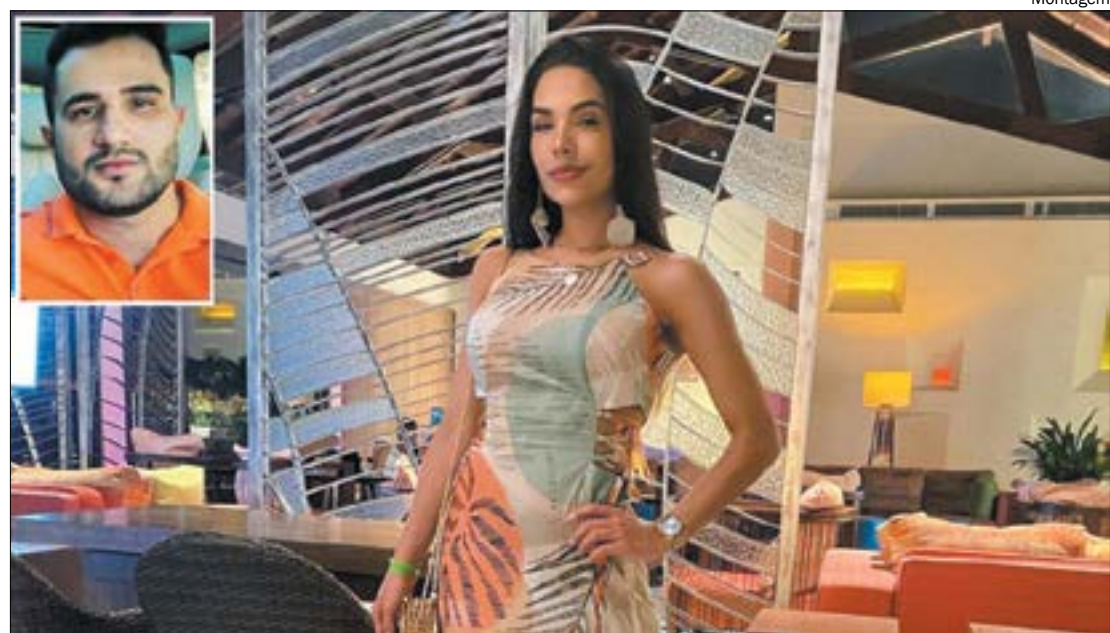
Empresário acusado de agredir a influencer, disse em sua defesa que tem colaborado com a Justiça para elucidar o caso