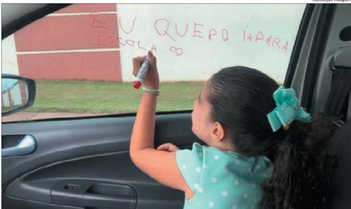
A 3ª carreta será realizada neste domingo (24), com concentração na frente do Parque Tia Nair em Cuiabá

Os participantes do movimento também questionam as razões pelas quais bares, restaurantes, shoppings centers e eventos para até 100 pessoas foram autorizados, mas o retorno das escolas não.