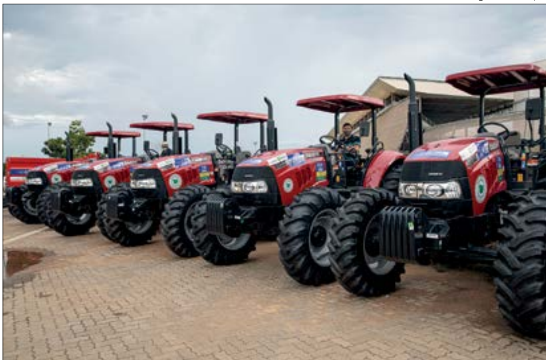
Foram entregues 42 patrulhas mecanizadas, 200 resfriadores de leite, 100 caixas de mel e 7,6 mil doses de sêmen bovino

As 100 caixas de abelhas, montadas com madeira apreendida em fiscalizações realizadas pela Secretaria de Estado de Meio Ambiente (Sema), foram construídas pelas mãos de reeducandos da Fundação Nova Chance. Todas elas custaram aos cofres estaduais R$ 12,5 mil, em gastos voltados para a montagem, e serão destinadas para indígenas e agricultores familiares de Confresa.