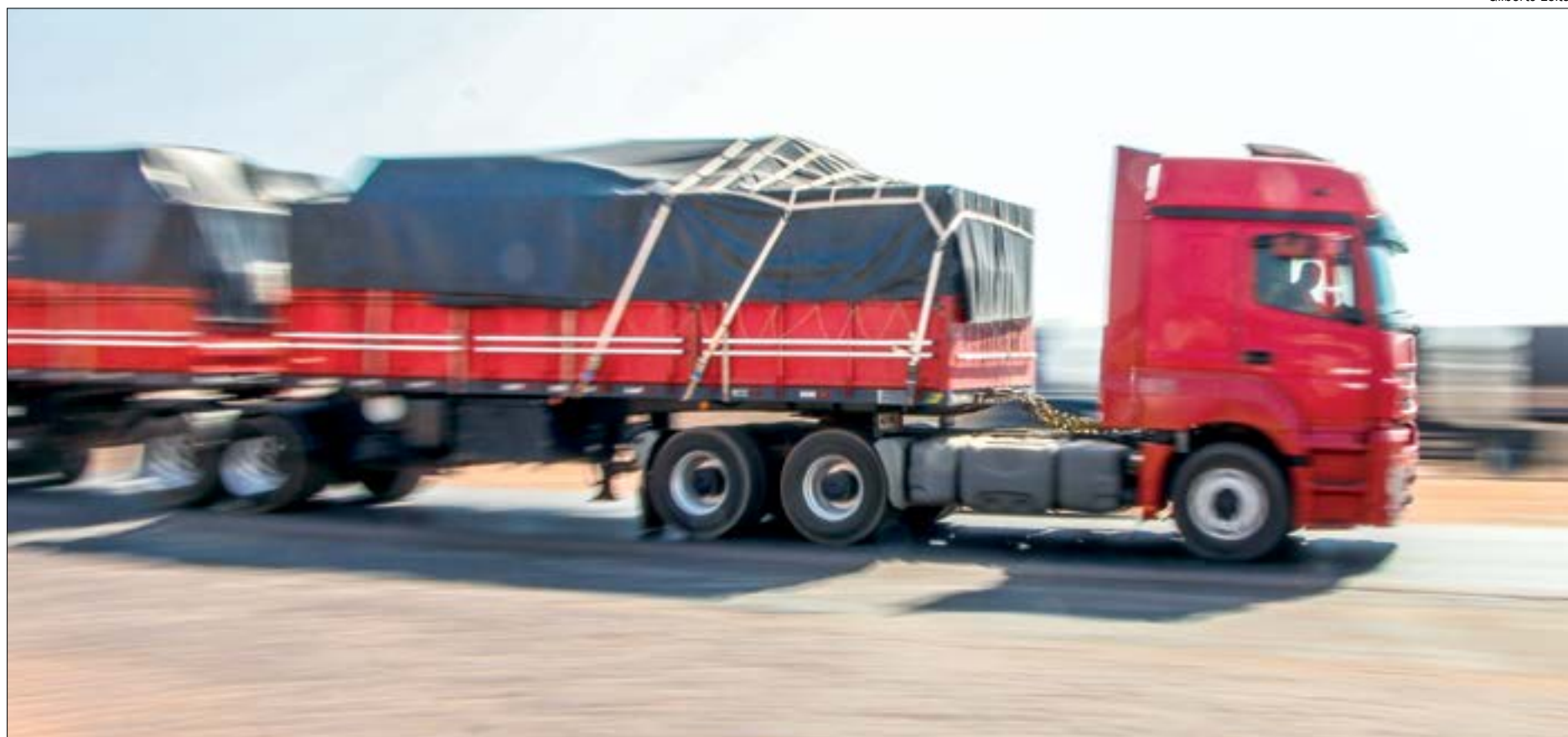
Medida que isenta taxa de importação de pneus pode não beneficiar caminhoneiros

A nova paralisação dos caminhoneiros está prevista para ter início no dia 1º de fevereiro, sem previsão de término. O Conselho Nacional do Transporte Rodoviário de Cargas (CNTRC), que está à frente da mobilização, já reiterou a intenção da greve caso a pauta da classe não seja debatida. Uma das queixas é com relação ao reajuste da tabela do frete em 2,51% pelo governo federal. A decisão, publicada no Diário Oficial, é um cumprimento da política de reajustes criada no governo Michel Temer, em 2018,