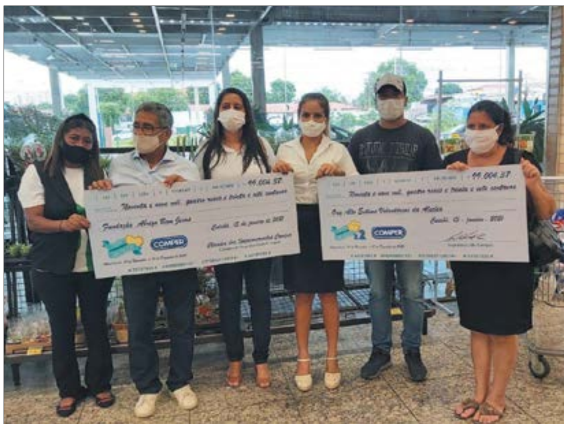
O Abrigo Bom Jesus e a Associação Auto-Estima receberam cerca de R$ 200 mil em doação do projeto Troco Solidário e Troco em Dobro, do Comper