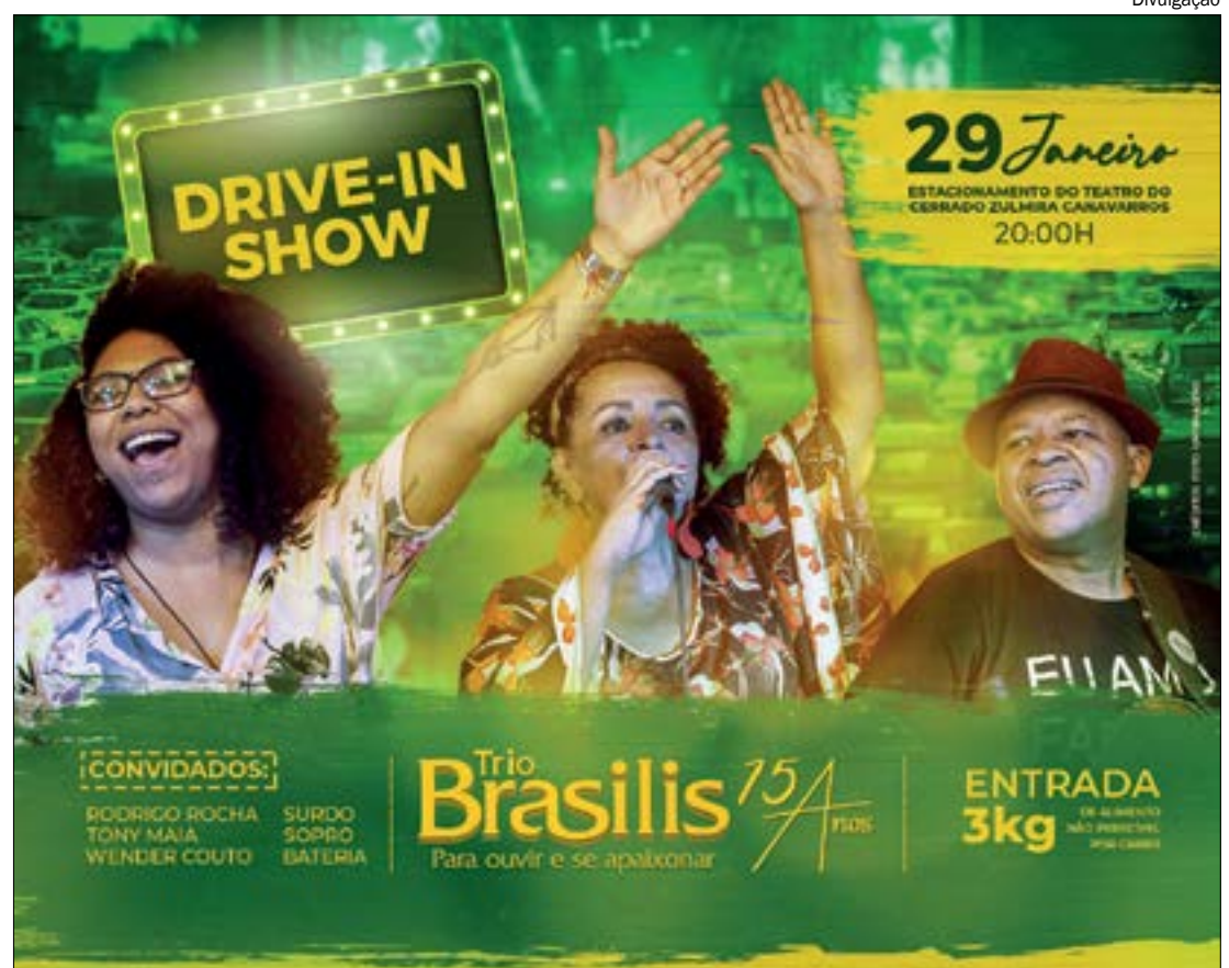
O show drive-in será no estacionamento do Teatro do Cerrado Zulmira Canavarros

Para 2020, o Trio havia programado três shows para celebrar a carreira. O primeiro foi