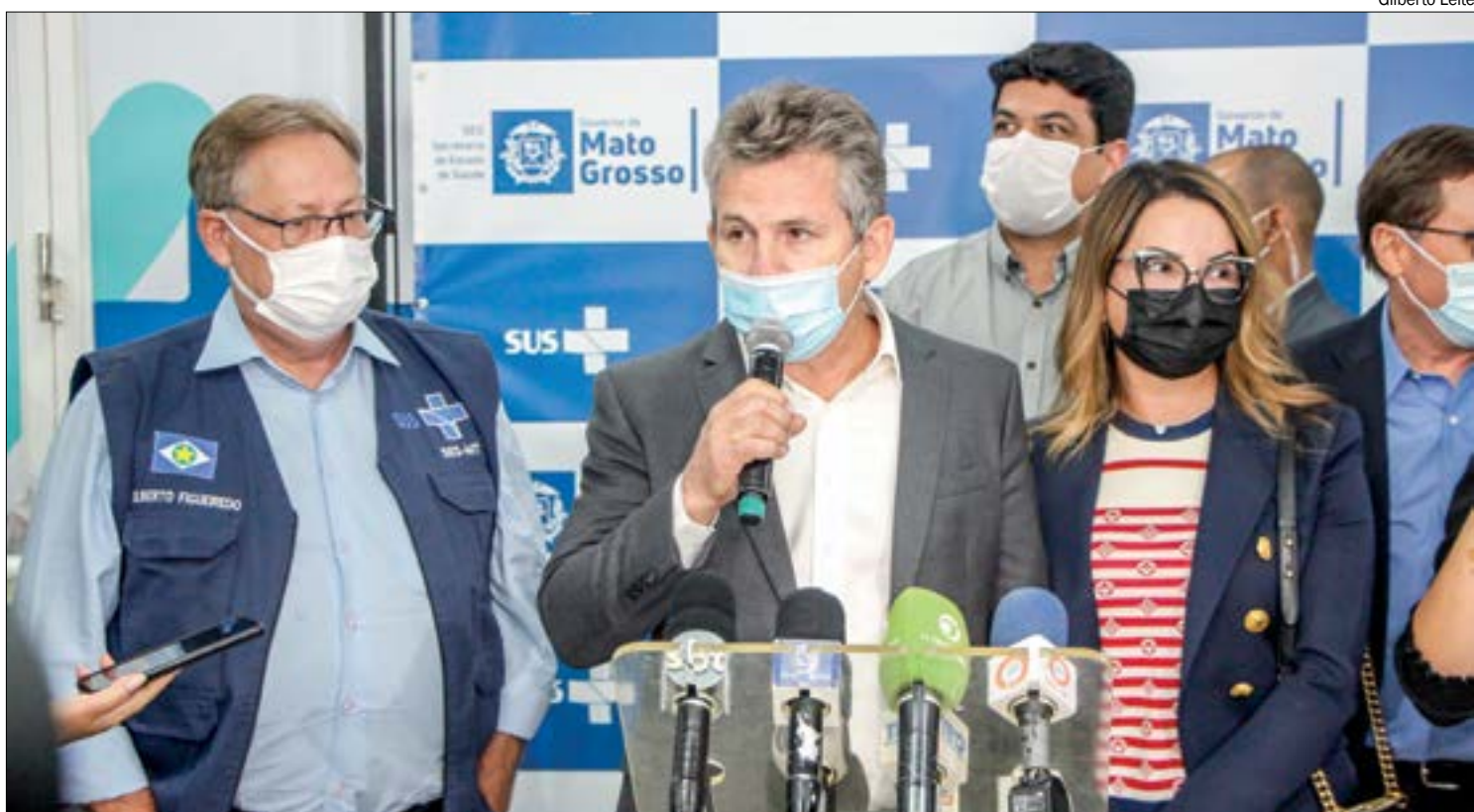
Governador Mauro Mendes (DEM) deu início às tratativas para compra de 1 milhão de doses de vacina

No primeiro momento foram recebidas 126.160 doses, que irão contemplar 60.074 pessoas, com duas doses.