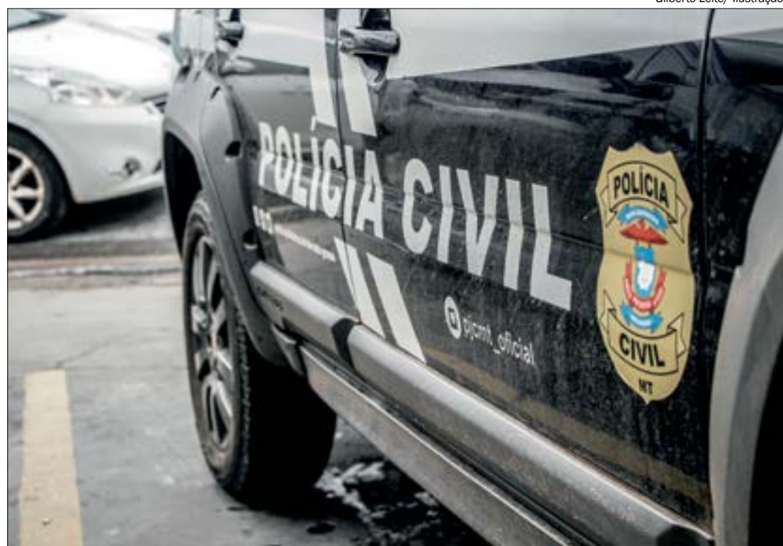
Até o momento o suspeito de praticar os abusos não foi preso. A Polícia Civil está investigando o caso