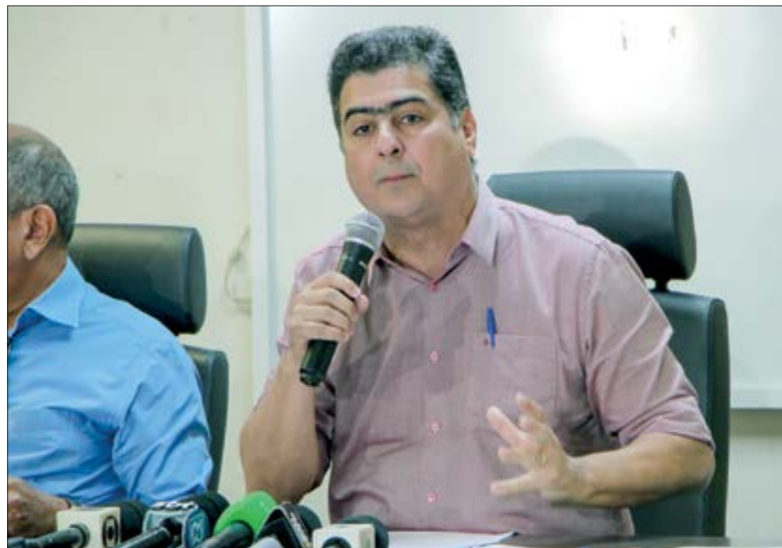
Prefeito Emanuel Pinheiro irá criar lei para punir organizadores de eventos que causarem aglomerações em Cuiabá