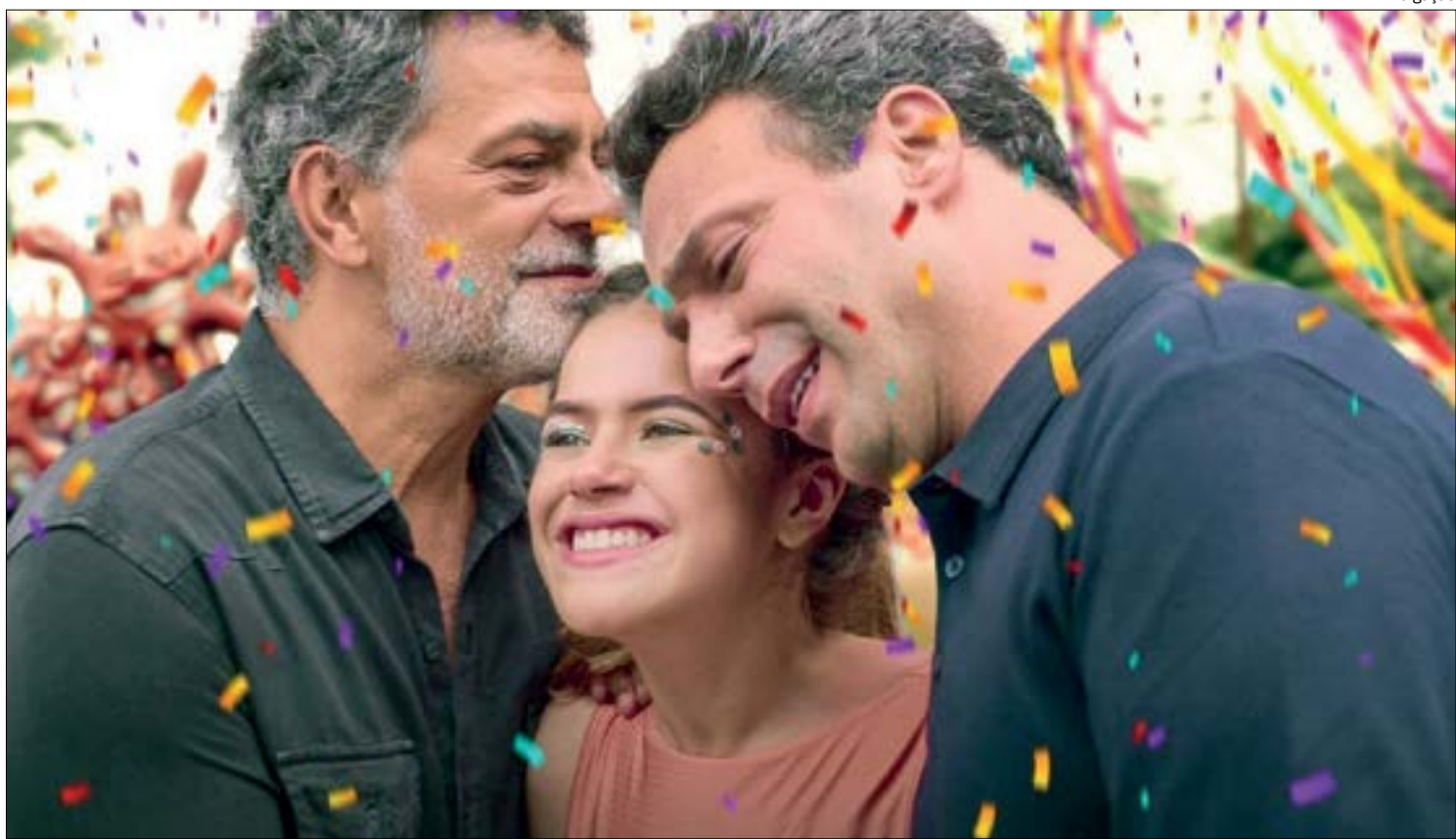
O longa está entre os cinco mais vistos em todo o mundo na plataforma de streaming

Esta é mais uma produção de Talita Rebouças. Anteriormente, a escritora teve suas obras adaptadas para a telona, como no caso de Fala Sério Mãe, sucesso de bilheteria. Já Pai em Dobro fez o percurso inverso: ganhou primeiro o roteiro cinematográfico e, posteriormente, o livro, que foi lançado em dezembro de 2020.