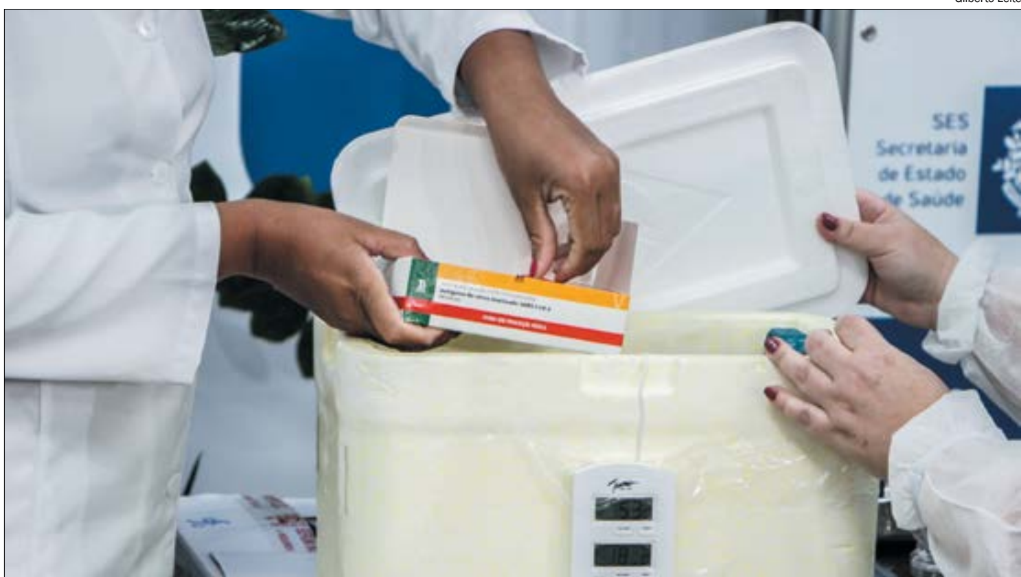
As doses estão sendo enviadas para 16 polos regionais para início da 1ª fase de imunização

Contudo, o governador recomendou que a população continue a adotar as medidas preventivas contra o vírus, uma vez que serão muitas fases ainda para que a vacina seja aplicada de forma geral.