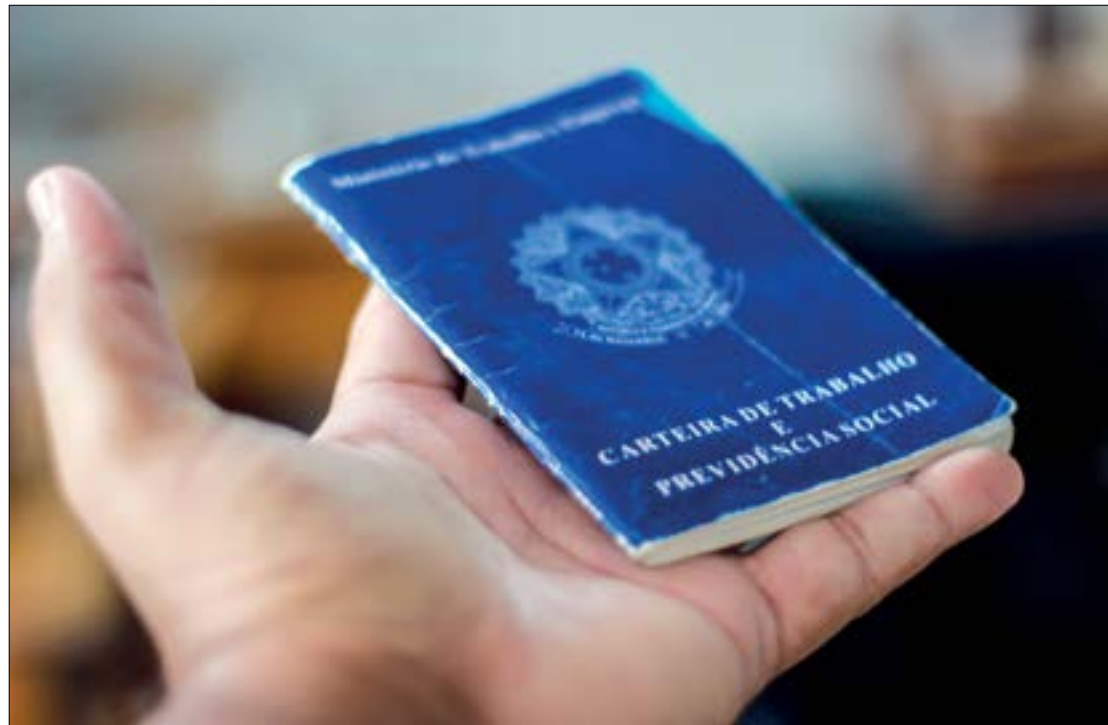
Os interessados podem comparecer aos postos de atendimento, portando documentos pessoais e comprovante de residência