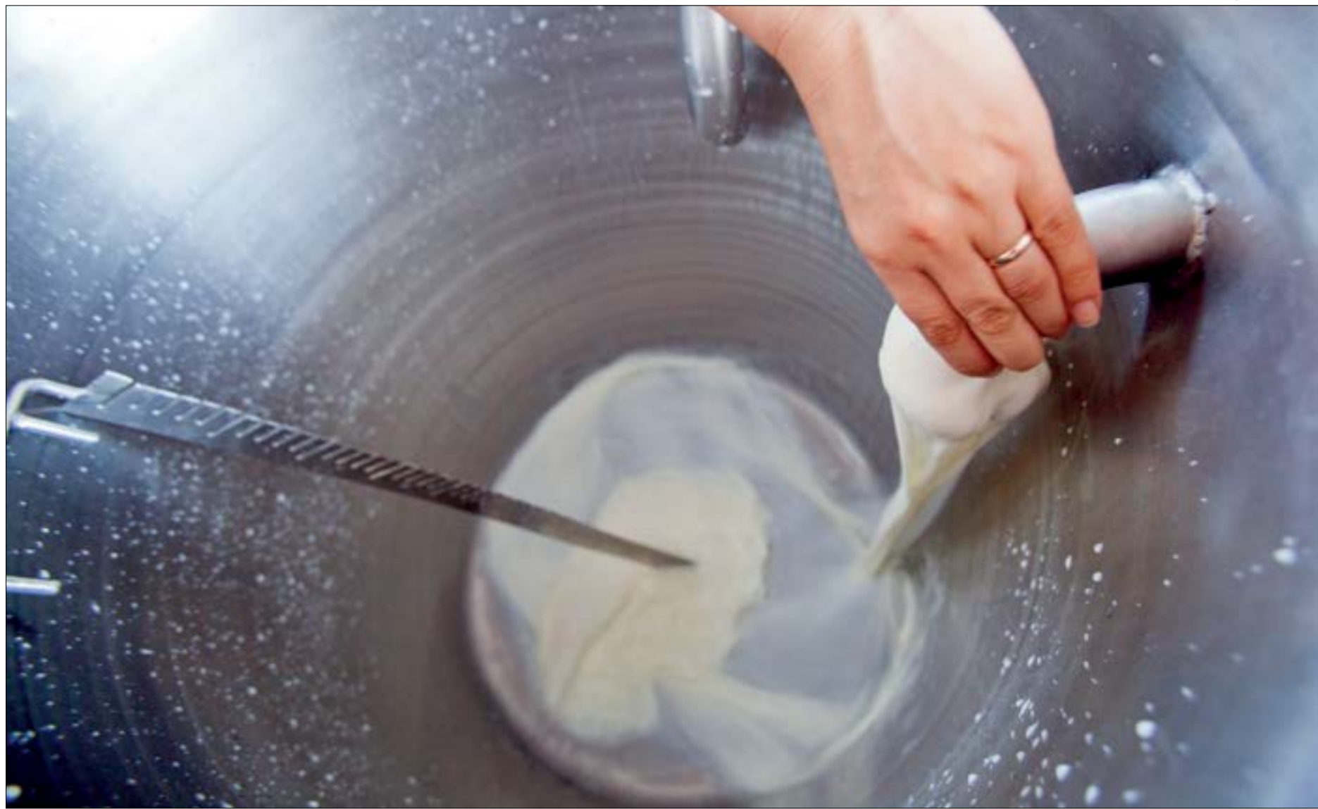
A diminuição do consumo interno e aumento da produção de leite pressionam preços de laticínios

ACÚMULO DO ANO - Apesar de o volume captado em novembro de 2020 ter registrado acréscimo, a queda acumulada no ano - de janeiro a novembro - chegou a 8,24%, em relação ao ano anterior. O percentual correspondeu a 32,91 milhões de litros adquiridos em Mato Grosso.