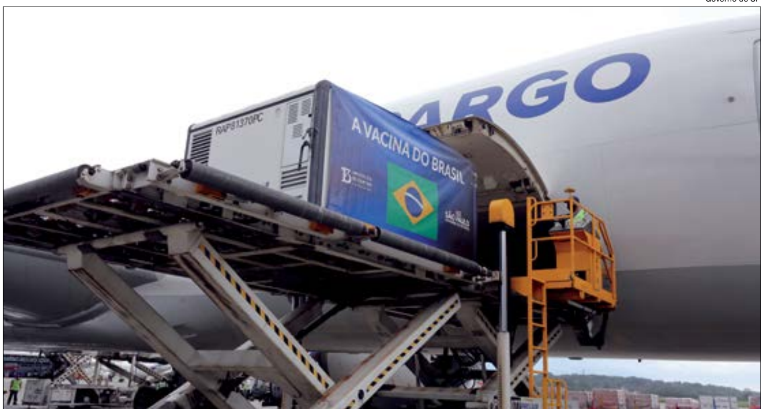
Mato Grosso vai garantir as duas doses da vacina ao grupo compreendido na primeira fase da vacinação

Quem não constar nos registros dos sistemas, mas é do grupo de risco, também será imunizado. Nesse caso, a pessoa terá que apresentar documento que ateste sua participação no grupo e, assim, o profissional da saúde po-