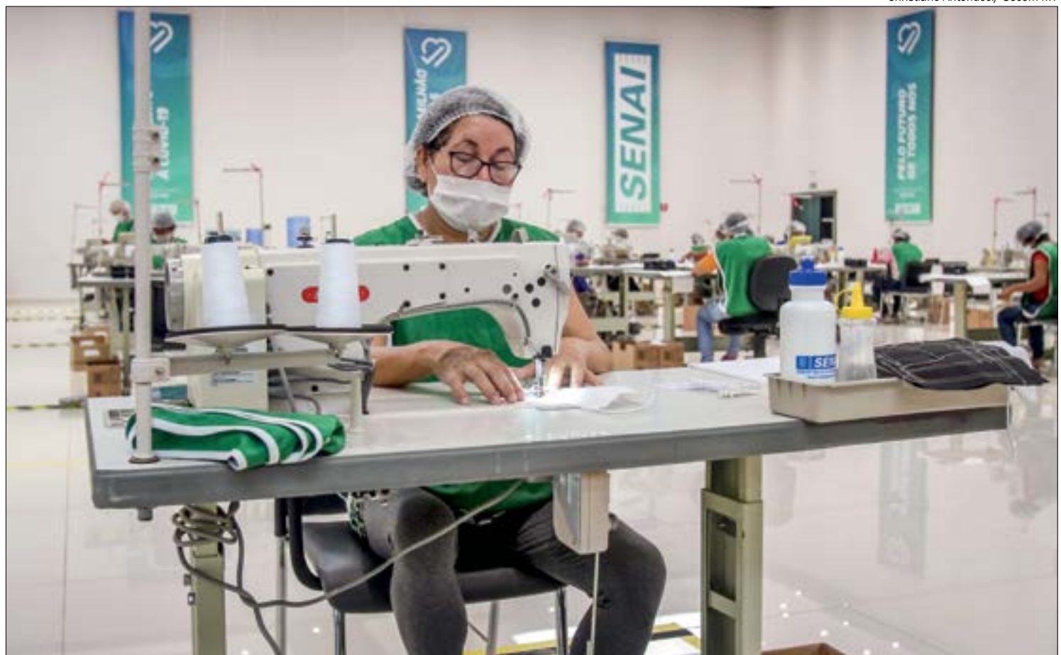
Setores que tanto amargaram prejuízos durante os meses de pico da doença estão esperançosos com a retomada da economia

Para as indústrias, segundo Rogieri, é essencial redobrar os cuidados no ambiente de trabalho e reforçar as orientações às equipes. "Já chegamos tão longe, vencemos tantos desafios, não podemos co-