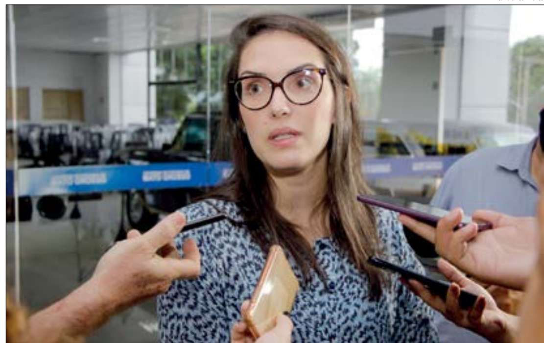
A deputada destacou que o sistema de saúde está à beira do colapso e que se comportamento não mudar os próximos dias serão muito difíceis

Haverá uma estrutura no Centro de Eventos do Pantanal atendendo de domingo a domingo, das 7h às 22h. Para a primeira fase, será necessário fazer um cadastro no portal da prefeitura, além de atualizar o cartão SUS. Já na segunda e terceira fases, as vacinas serão aplicadas nos polos regionais de saúde.