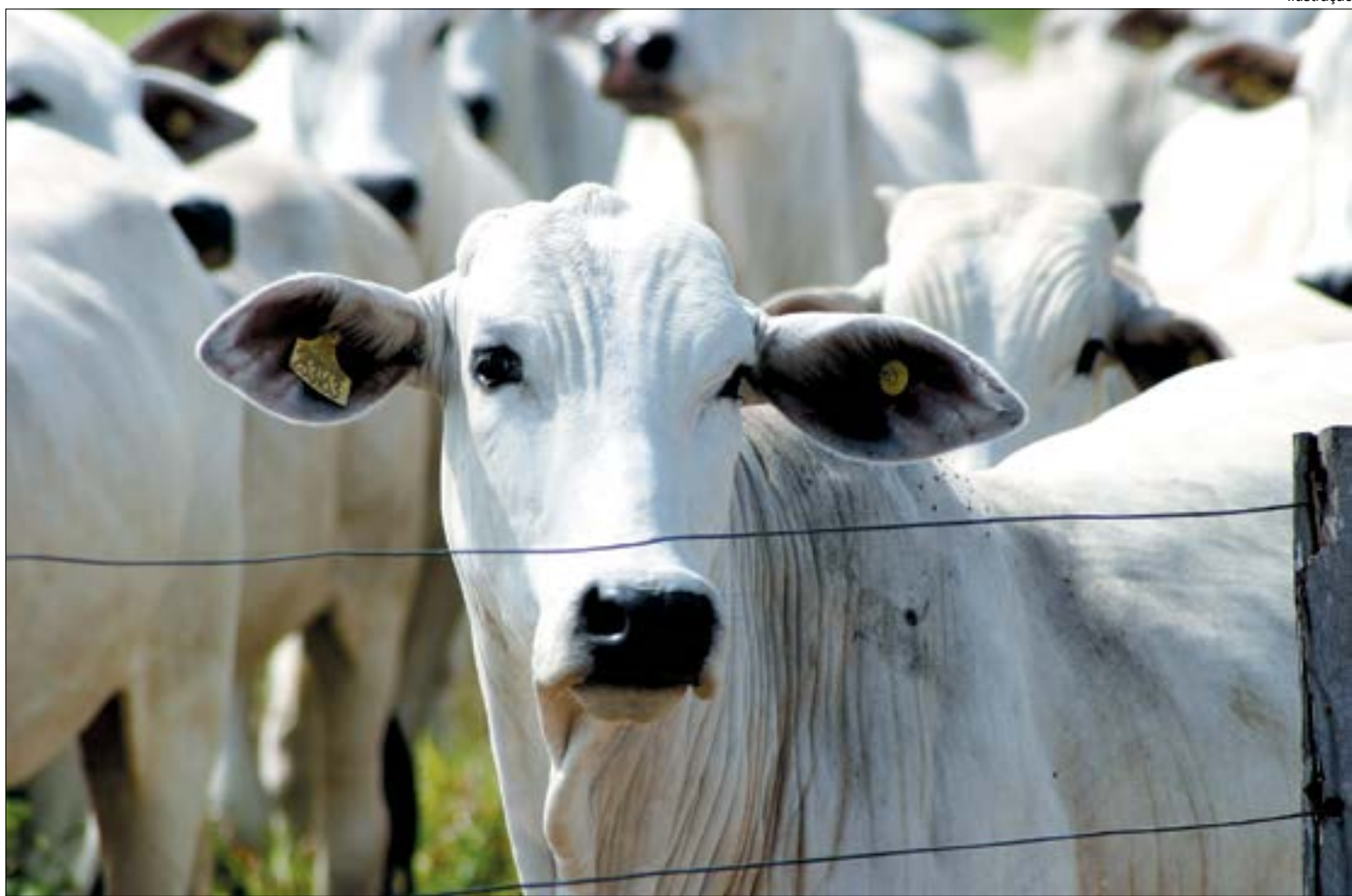
O preço ao produtor superou as perdas do fim do ano passado, com valorização de 12% em um mês

Em Mato Grosso, depois de a arroba do boi à vista alcançar seu pico de preço no início de novembro de 2020, o produto passou a registrar quedas e causou perdas de até 10% para o produtor em dezembro. A pressão de baixa na arroba do boi gordo, em novembro, foi pautada pela menor demanda interna e as meno-