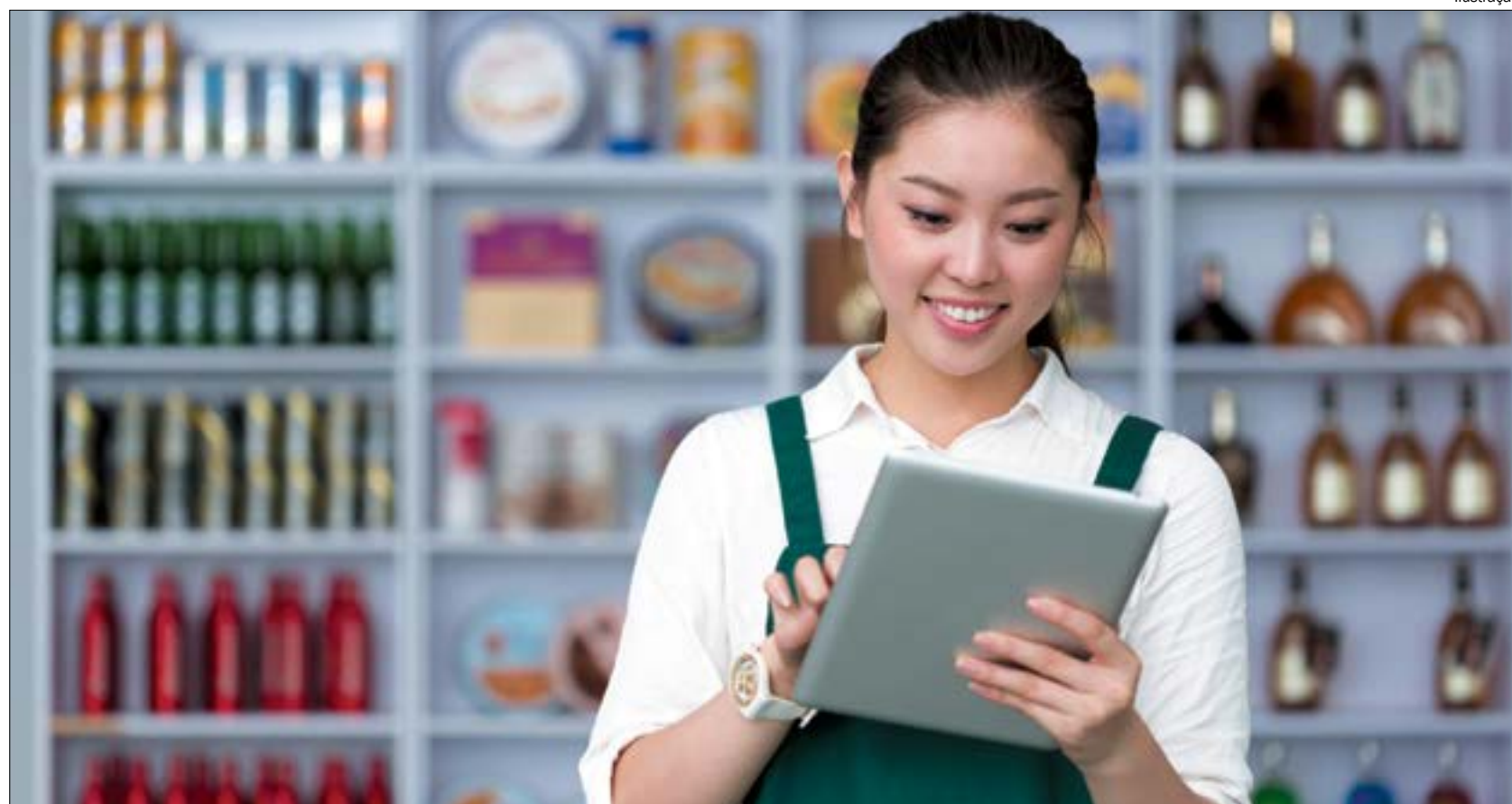
Estão sendo ofertadas 100 vagas para promotor de vendas, com carga horária de 160 horas na modalidade EAD

A Seciteci divulgará a lista com as matrículas deferidas no dia 3 de fevereiro. A previsão para o início das aulas é dia 17 de fevereiro. Os alunos receberão certificados após a conclusão do curso. Para mais informações acesse www.secitec.mt.gov.br .