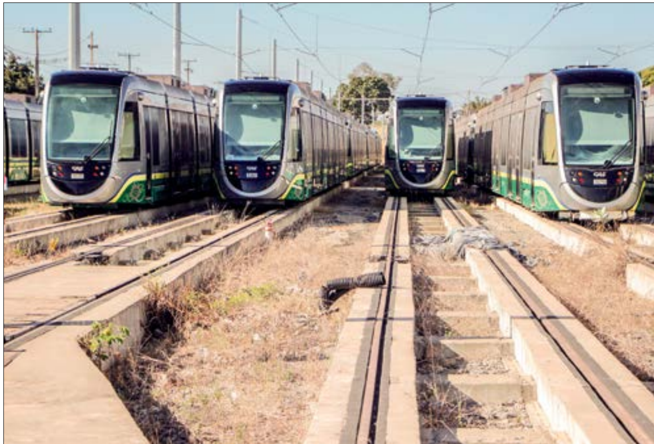
O desembargador aponta que a alteração do modal depende de uma decisão do Ministério de Desenvolvimento Regional

Superior Tribunal de Justiça (STJ), de que ainda não houve decisão do Ministério autorizando a troca.