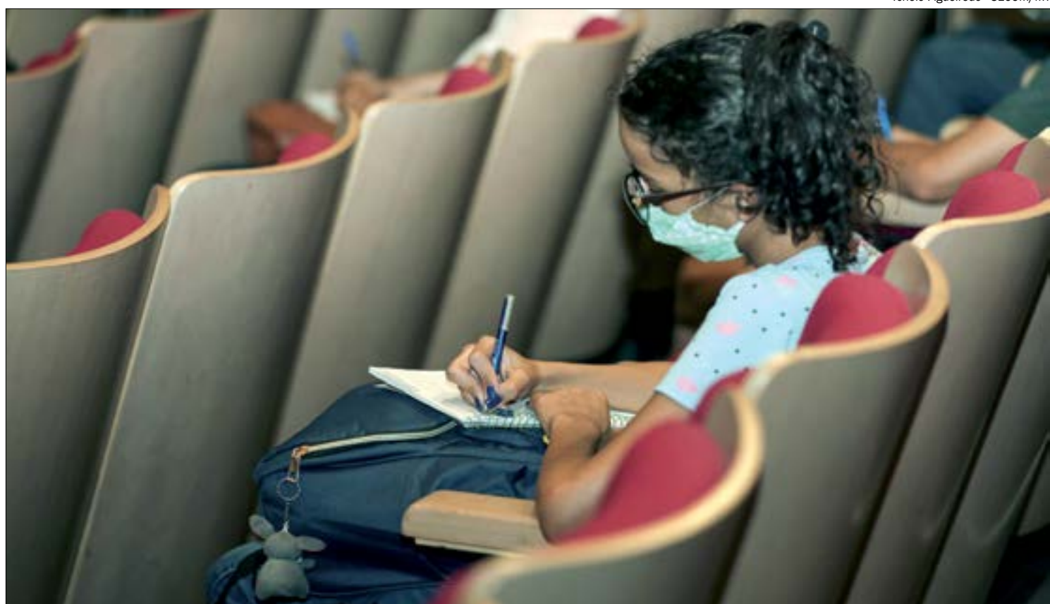
As provas estão marcadas para acontecer neste domingo (17) e no dia 24 de janeiro

Na decisão, o juiz comentou que o Enem já foi adiado no ano passado devido à pandemia do novo coronavírus e para nova edição do exame foram adotadas medidas sanitárias. O magistrado elencou as regras