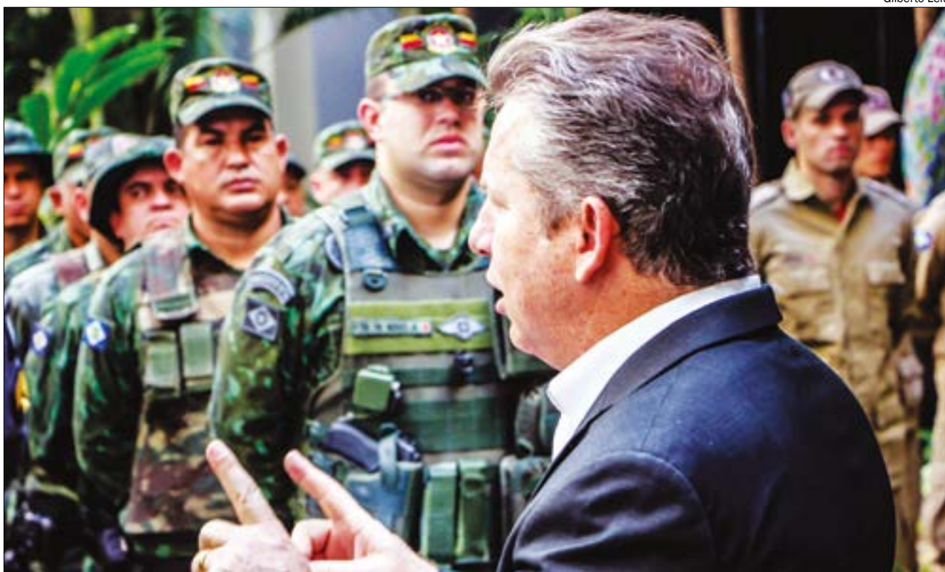
Mendes orienta fiscais: 'quem persistir na impunidade vai se dar mal'

De acordo com o governador Mauro Mendes (DEM), o pilar central do plano é assegurar que não haja impunidade em relação aos crimes ambientais. "Alerto aos cidadãos mato-grossenses que não apostem na impunidade, que não apostem que o Estado será ineficiente e por isso poderão praticar atos ilegais relacionados ao desmatamento, porque isso não vai ficar impune".