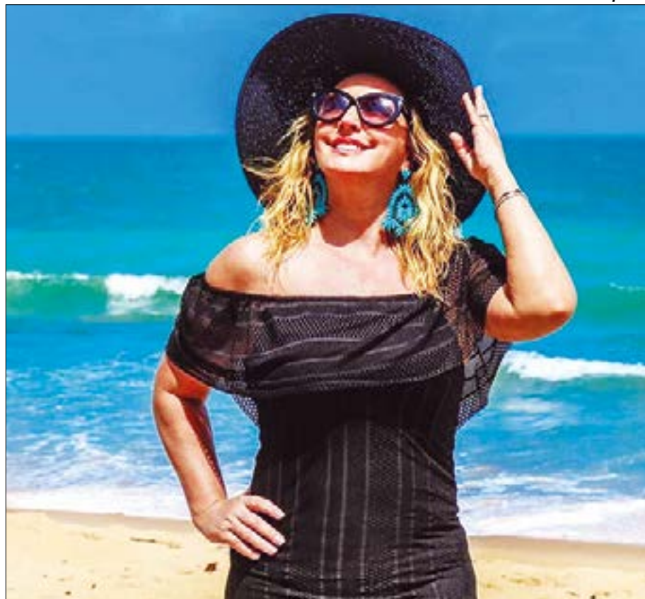
A primeira-dama de Cuiabá, Márcia Pinheiro