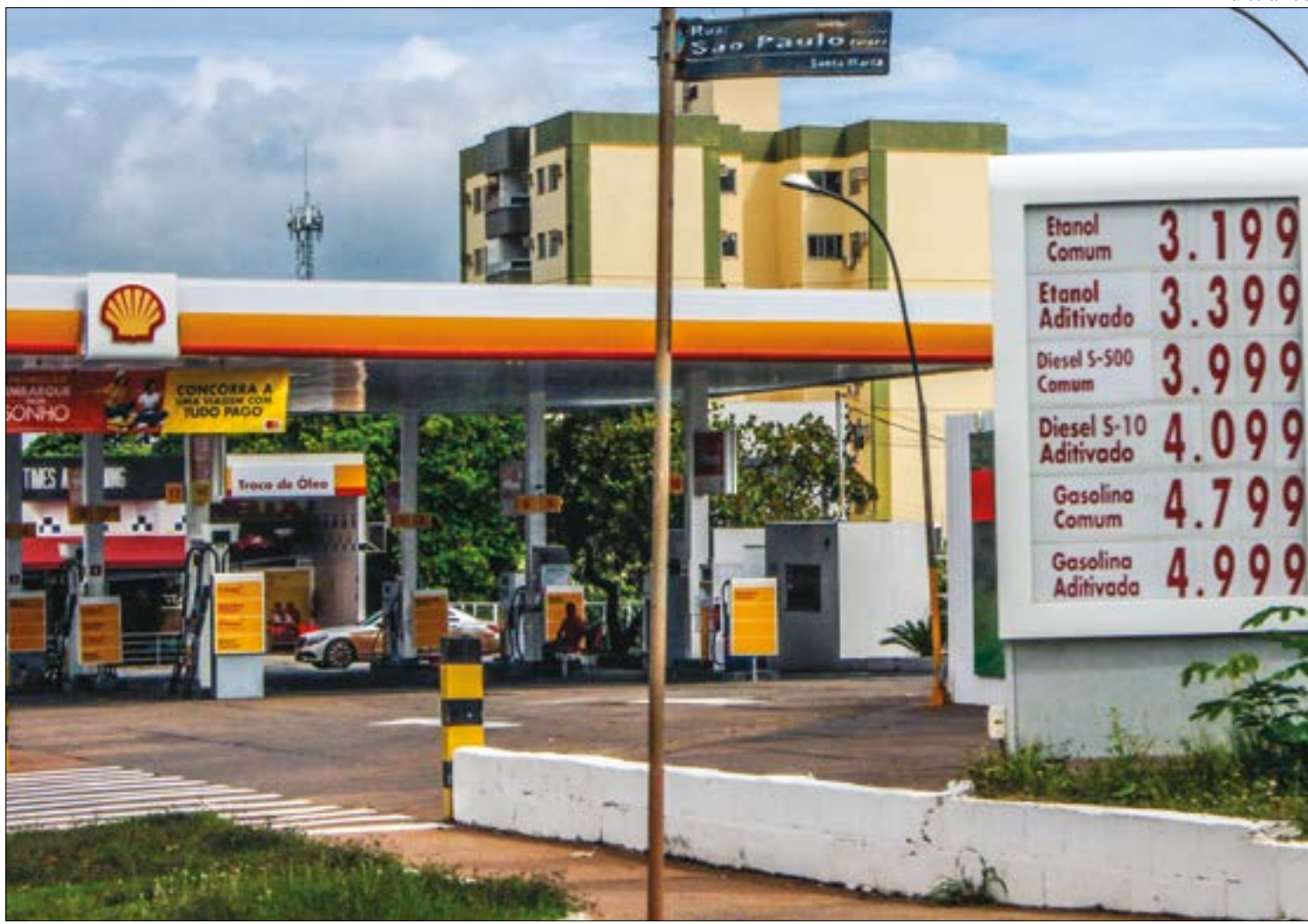
Preços subiram 20 centavos em menos de um dia, causando espanto aos motoristas

O setor varejista lembra que houve reajustes