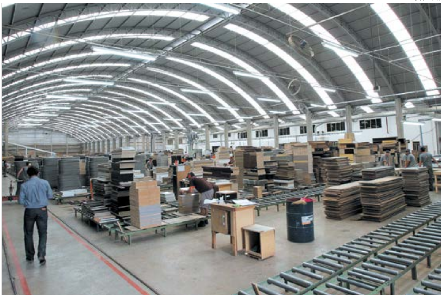
Depois de uma leve recuperação em outubro, a indústria mato-grossense voltou a encolher em novembro

A escassez de matéria-prima para a indústria gerou consequências negativas como desequilíbrio entre as cadeias produtivas e o encarecimento de produtos para o consumidor final. Segundo a CNI, o problema ficou mais evi-