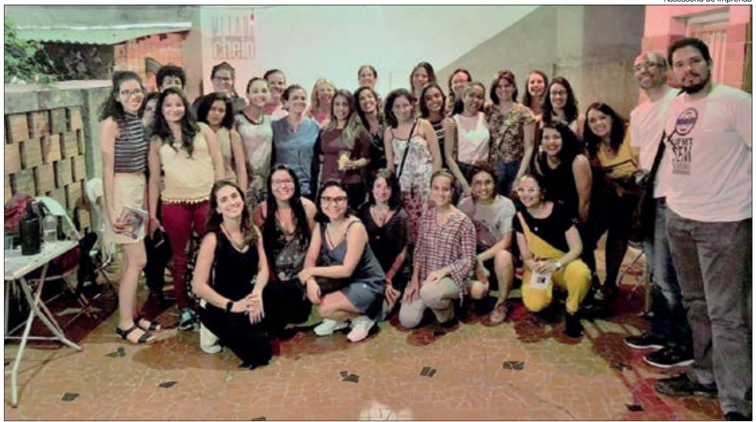
Além do encontro presencial, com limite de participantes, haverá transmissão on-line dos eventos