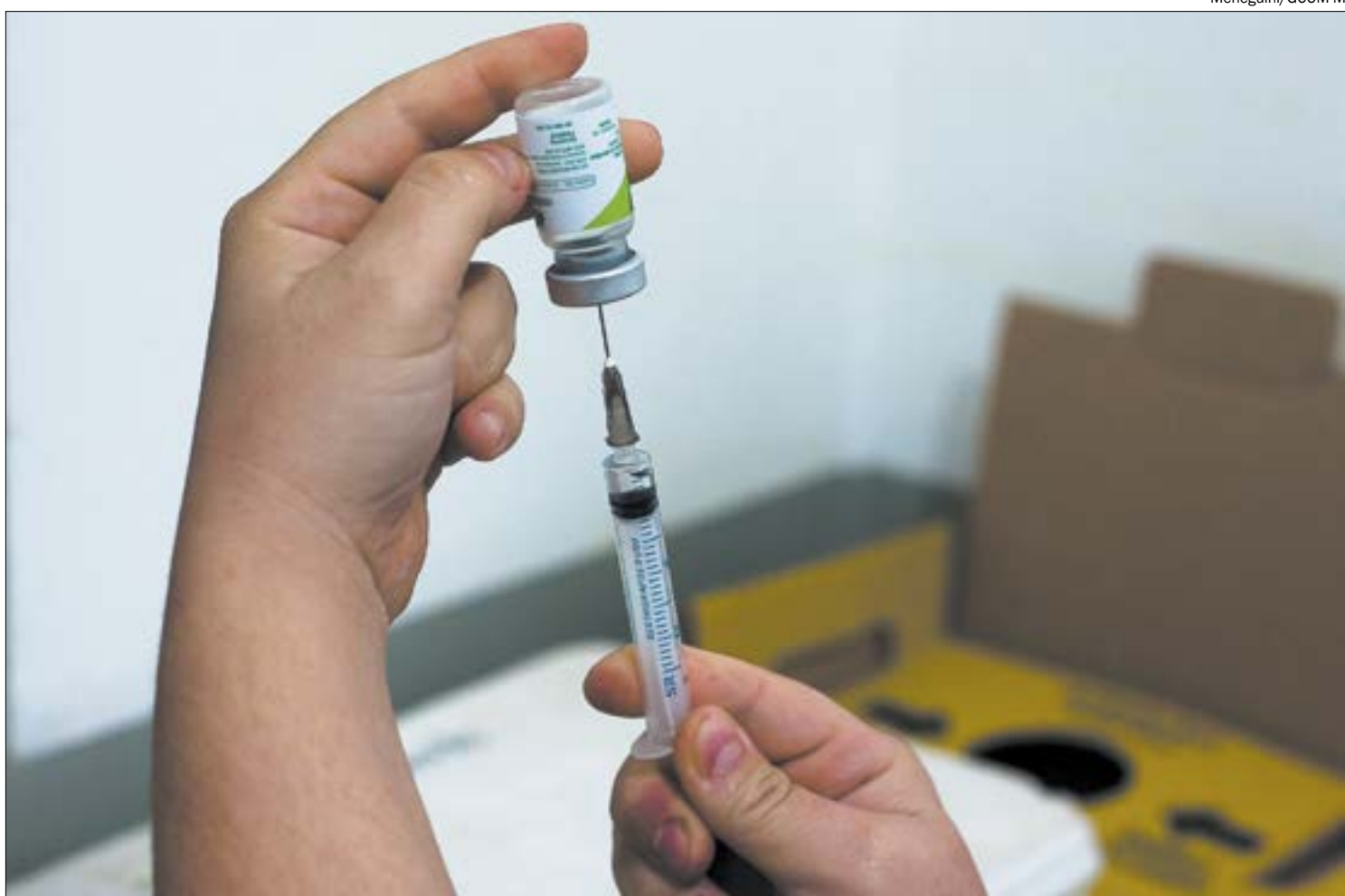
Expectativa é que cerca de 150 mil pessoas sejam vacinadas durante a primeira etapa em Cuiabá

A informação sobre o início da campanha nacional no dia 20 de fevereiro foi confirmada por prefeitos de várias outras capitais, que estiveram reunidos em conferência virtual com Pazuello. O Ministério trabalha para que a campanha tenha início simultaneamente em todas as capitais, três dias após o aval da Anvisa