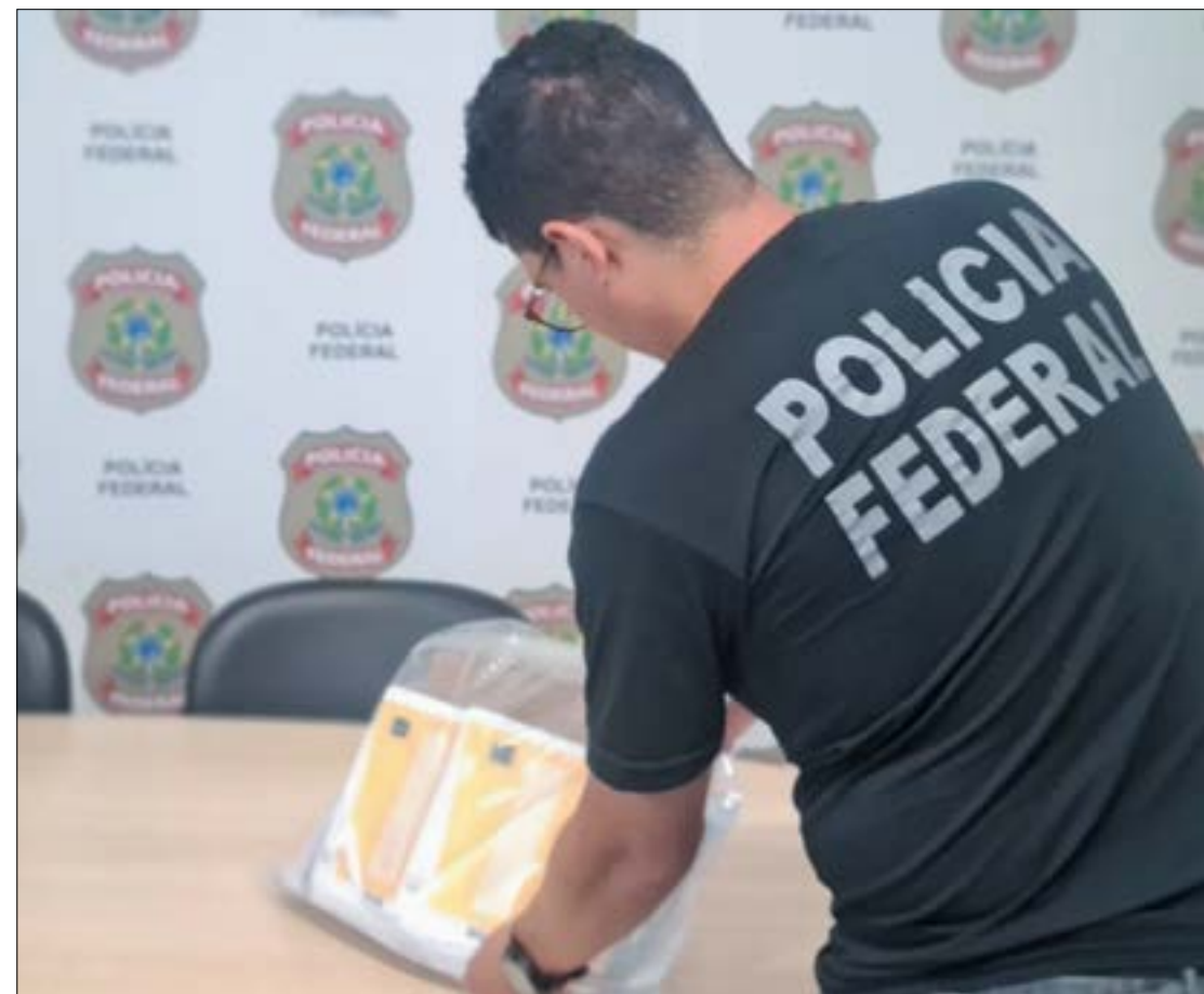
Os policiais realizaram busca na agência dos Correios, que comercializava milhares de selos falsificados