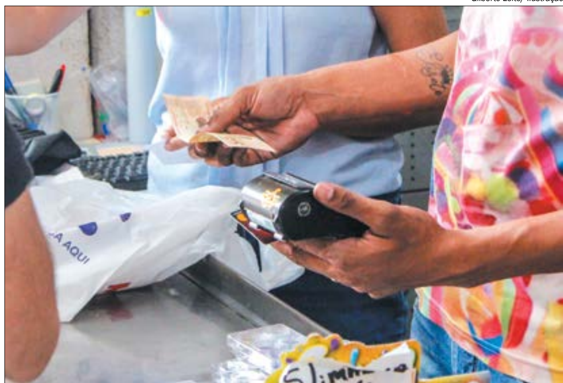
Para concorrer aos prêmios basta cadastrar no aplicativo ou site do Nota MT e pedir sempre o CPF na nota

um. Os sorteios especiais ocorrem em datas comemorativas, conforme calendário divulgado pela Sefaz.