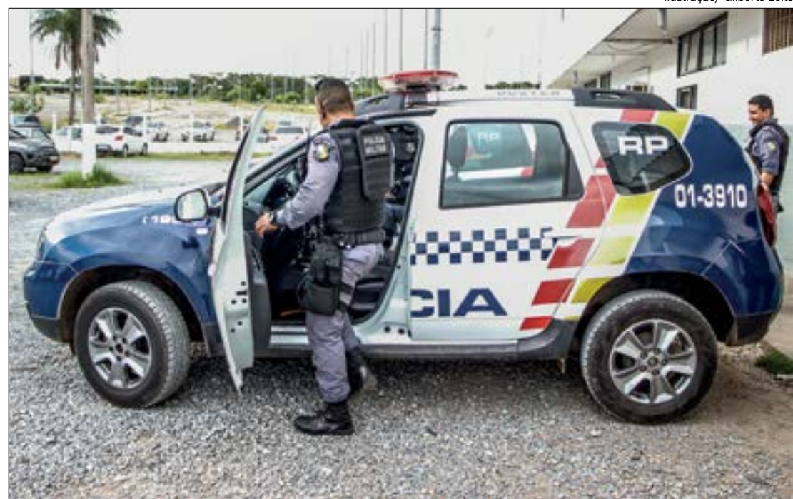
Uma ex-servidora pediu exoneração do cargo após sofrer assédio sexual por parte de Marcos Catão, presidente do Indea

“Não que um homem acusado de assédio não tenha o direito de se defender, mas a mulher vítima precisa se sentir segura, saber que existe justiça e que ninguém, por maior que seja sua posição, está imune à lei. Enquanto estiver na Assembleia Legislativa, como representante