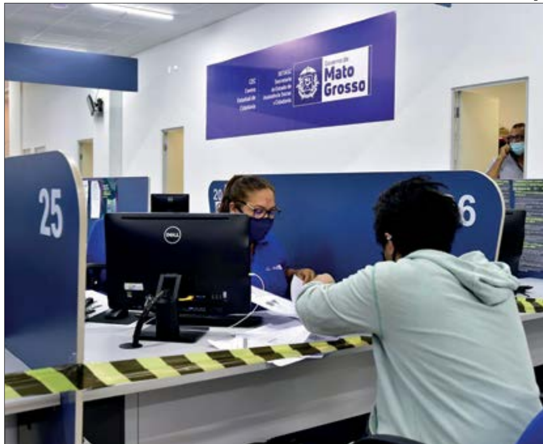
Os interessados podem comparecer aos postos de atendimento mais próximos de sua residência, na capital ou no interior