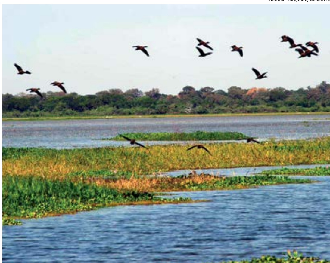
As águas que regam a Baía de Chacororé, a maior do Pantanal de Mato Grosso, estão represadas por obstruções dos canais

“Hoje, decorridos mais de dez anos, todos os Corixos à jusante da cidade de Barão de Melgaço, até a boca do Corixo Manizaque estão barrados, todas as pontes destruídas e em seu lugar aterro impedindo a passagem das primeiras águas, além de terem construído diques marginais em praticamente toda a margem esquerda do Rio