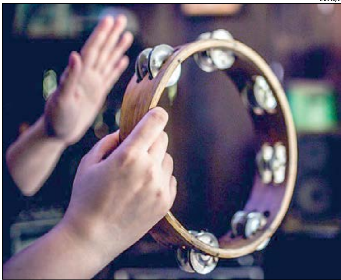
Samba na Praça vai realizar shows virtuais nas Praças da Mandioca, do Choppão e das Bandeiras