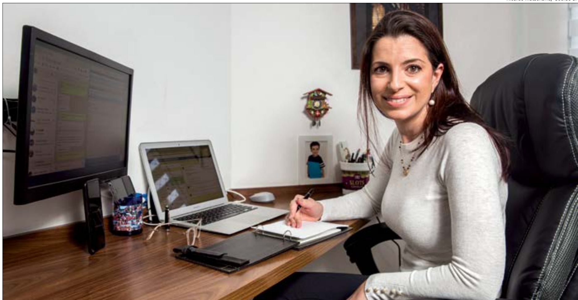
Para evitar perdas e desfalques maiores, as empresas adotaram o home-office e profissionais aprovaram nova realidade

“Contratar uma pessoa, ou uma equipe, para fazer parte de um time que trabalhe de maneira híbrida, parte na empresa e parte em home office, deve ser a tendência das organizações daqui para frente. O home office, que antes era tratado como uma ideia a ser pensada, saiu do papel em tempo recorde e os resultados, para empresas e colaboradores, foram positivos em sua maioria. Os processos